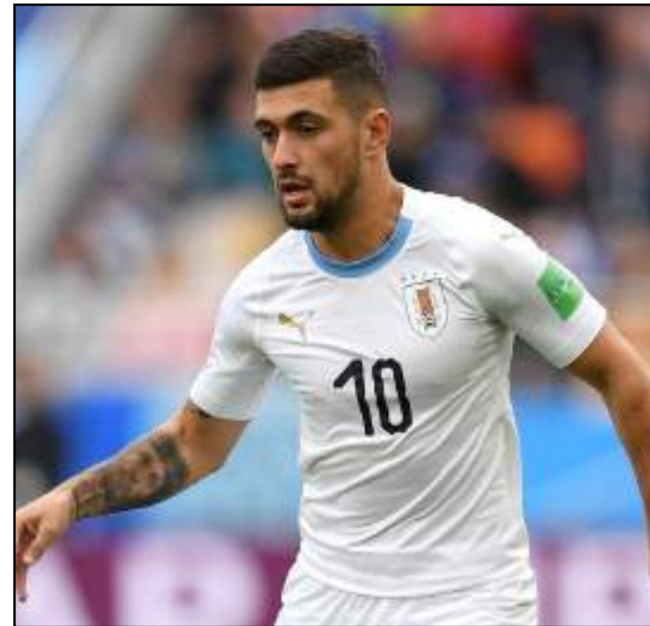
Cruzeiro espera verba por Arrascaeta