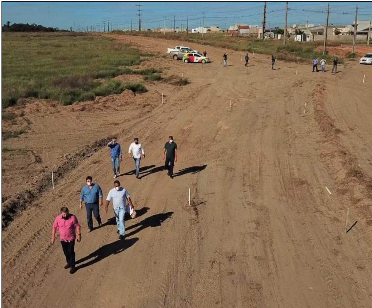
Obra iniciou sem autorização da Câmara

A Câmara aprovou uma lei no ano de 2018 aprovando a abertura da avenida no local, mas que não contempla o asfaltamento da mesma por parte do Executivo enquanto ali for uma área particular.