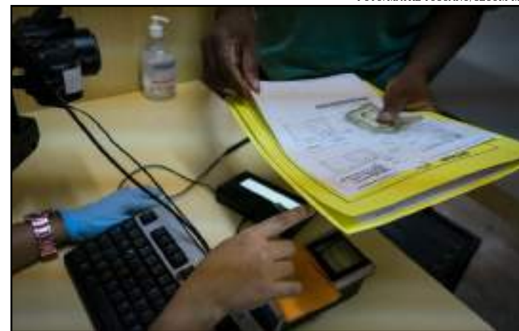
Agendamento prévio no site do Detran-MT