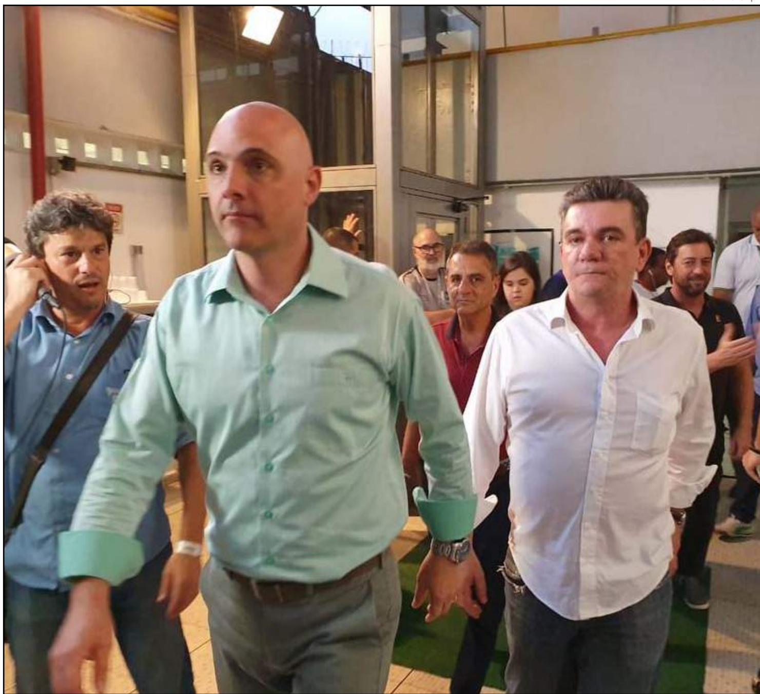
Presidentes de Palmeiras e Corinthians: coesão entre os grandes

Em 1918, o Campeonato Paulista terminou e o Paulistano foi campeão, porque os clubes entenderam que só seria possível realizar as partidas que definissem o campeão. O Paulistano venceu atuando 17 vezes, o Corinthians foi vice com 18 jogos e o Santos, quarto colocado, só teve doze atuações. Não se sabe de uma crise deste tamanho sem bom senso nem sem consenso. Neste momento, paulistas, gaúchos e mineiros parecem muito mais próximos de um desfecho favorável do que os cariocas.