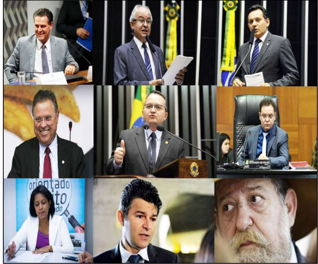
Possíveis candidatos à vaga de Senado na eleição complementar