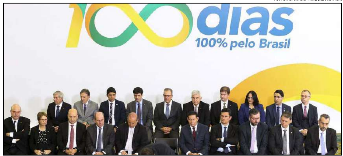
Cerimônia dos 100 dias de governo

fabetismo funcional (quem sabe ler e escrever, mas não consegue interpretar texto). A proposta não detalha qual será o método que deverá ser aplicado, mas, o “método fônico” - que apresenta as crianças às letras e aos sons da fala (grafemas e fonemas) antes de iniciá-las em atividades com textos-, é um dos apontados para nova abordagem de ensino. Foi assinado também os projetos de lei sobre educação domiciliar e Bolsa Atleta. O texto antes de ser publicado no Diário Oficial da União, precisa tramitar no Congresso.