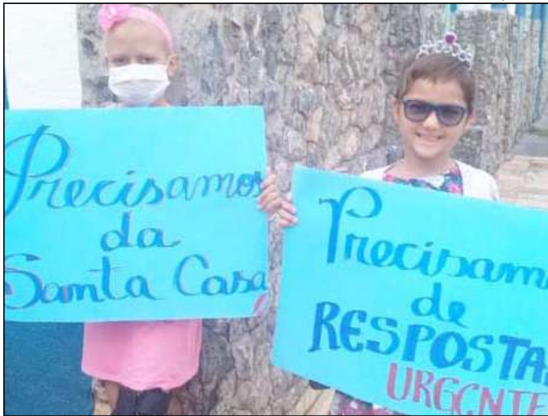
Manifestação na Santa Casa pede volta urgente dos atendimentos