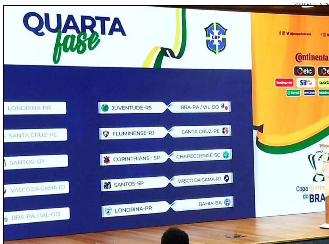
Sorteio da Copa do Brasil

A Quarta Fase terá jogos de ida e volta nos dias 17 e 24 de abril, exceto quem for sorteado para enfrentar o ganhador de Bragantino (PA) x Vila Nova (GO). Vasco, Fluminense, Corinthians, Bahia, Santos e