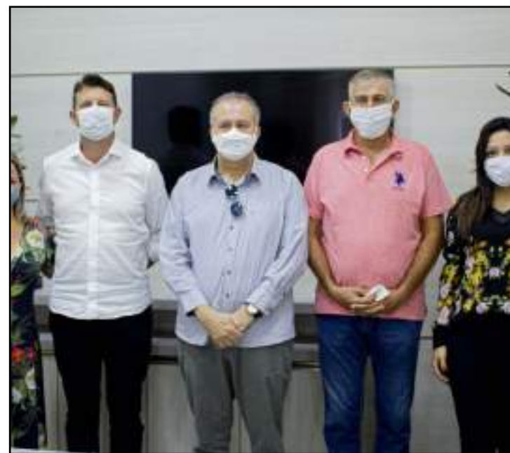
Ao final, serão 15 mil cestas básicas entregues