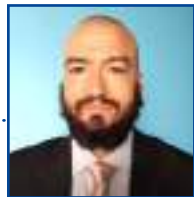
POR LEANDRO CARECA

A necessidade de se utilizar o celular com muito mais frequência faz com que as formas de controle de acesso sejam levadas ainda mais em consideração. Digitar uma senha verdadeiramente segura toda vez que precisar acessar o aparelho se torna um verdadeiro "pesadelo", e a biometria se mostra a mais conveniente das opções. Segurança e praticidade precisam andar juntas, não é mesmo?