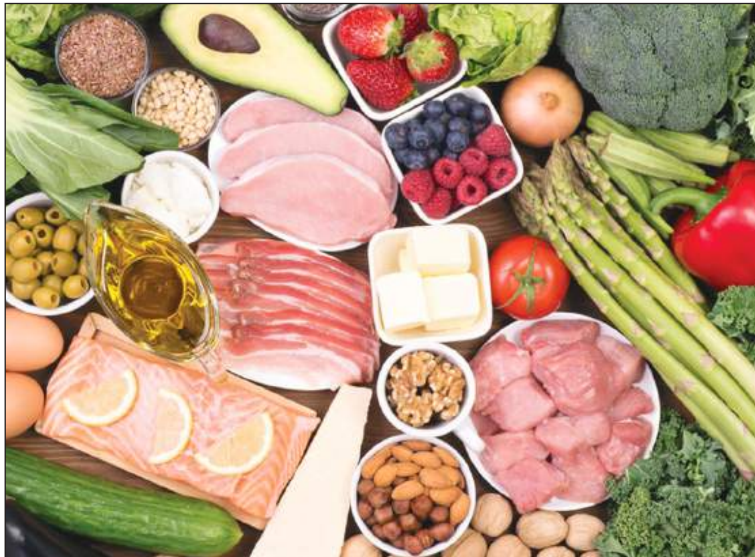
Alimentos que fazem parte do cardápio de uma dieta cetogênica

“O fato é que nosso corpo está acostumado a utilizar o carboidrato como a fonte principal de energia. Por isso, leva algum tempo até que nos adaptemos a extrair essa energia a partir das gorduras e proteínas. Durante esse período, nosso corpo dá sinais de que esse processo ainda não está ajustado – é o que chamamos de keto adaptação, que varia de pes-