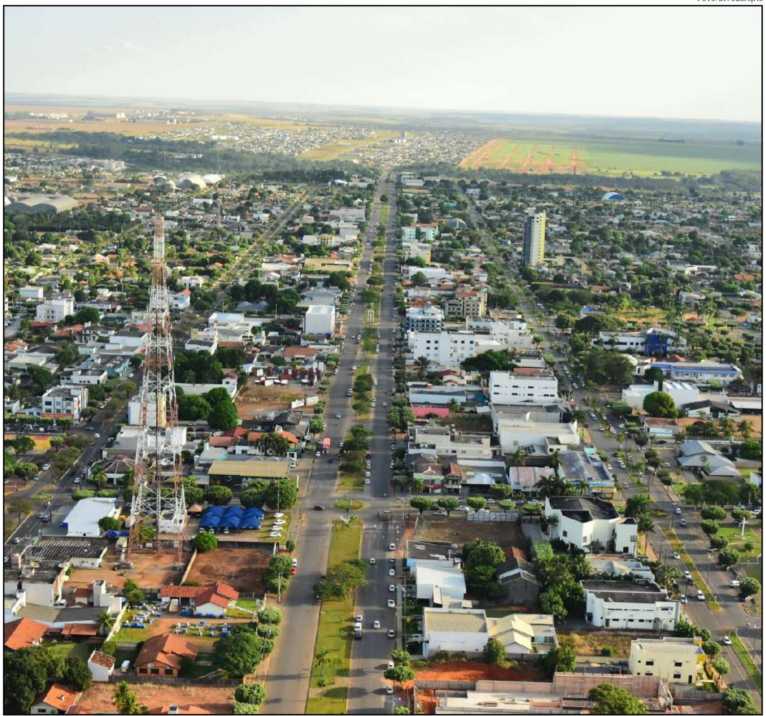
Sorriso entrou na lista de municípios com risco muito alto