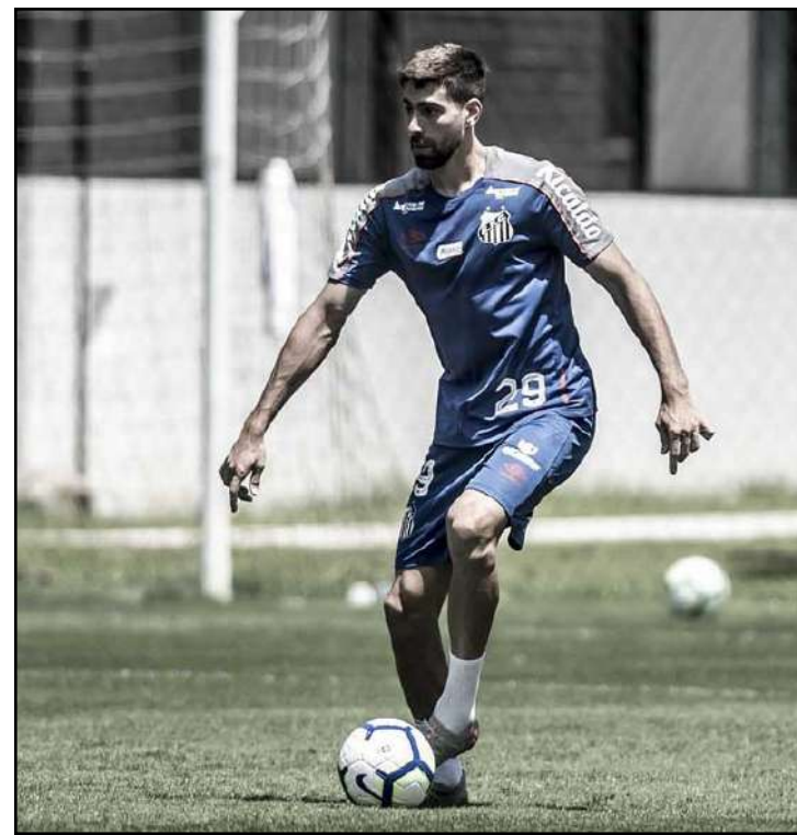
Peixe tinha 45 dias para pagar ao Club Brugge pelo empréstimo