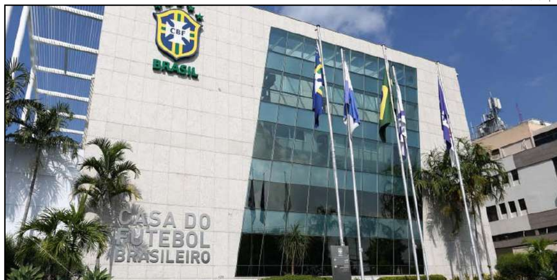
CBF e clubes devem abrir duas janelas até o fim do ano

As mudanças no cronograma de transferências ocorrem para tentar conter os efeitos da pandemia sobre o futebol brasileiro. Muitos clubes tiveram as finanças fortemente afetadas e o adia-