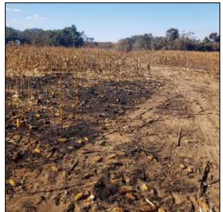
200 hectares foram queimados