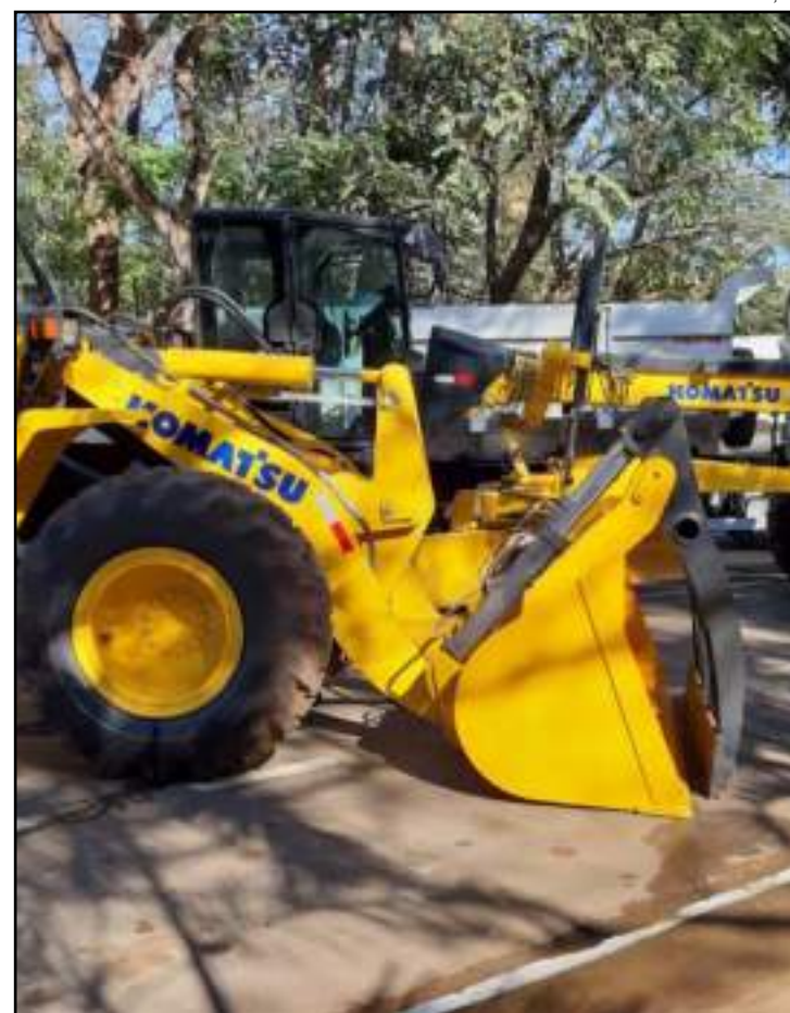
Investimentos na área ultrapassam os R$ 5 mi neste ano

“Em dois meses ultrapassamos os R$ 5 milhões em investimentos de maquinários, isso é o imposto pago pelos munícipes retornando em forma de investimentos na saúde, obras, transporte e na agricultura. A motoniveladora, por exemplo, será usada na manutenção das estradas rurais e, juntamente com os maquinários entregues em junho, servirá para preparar as estradas para a safra 2021”, frisa Lafin.