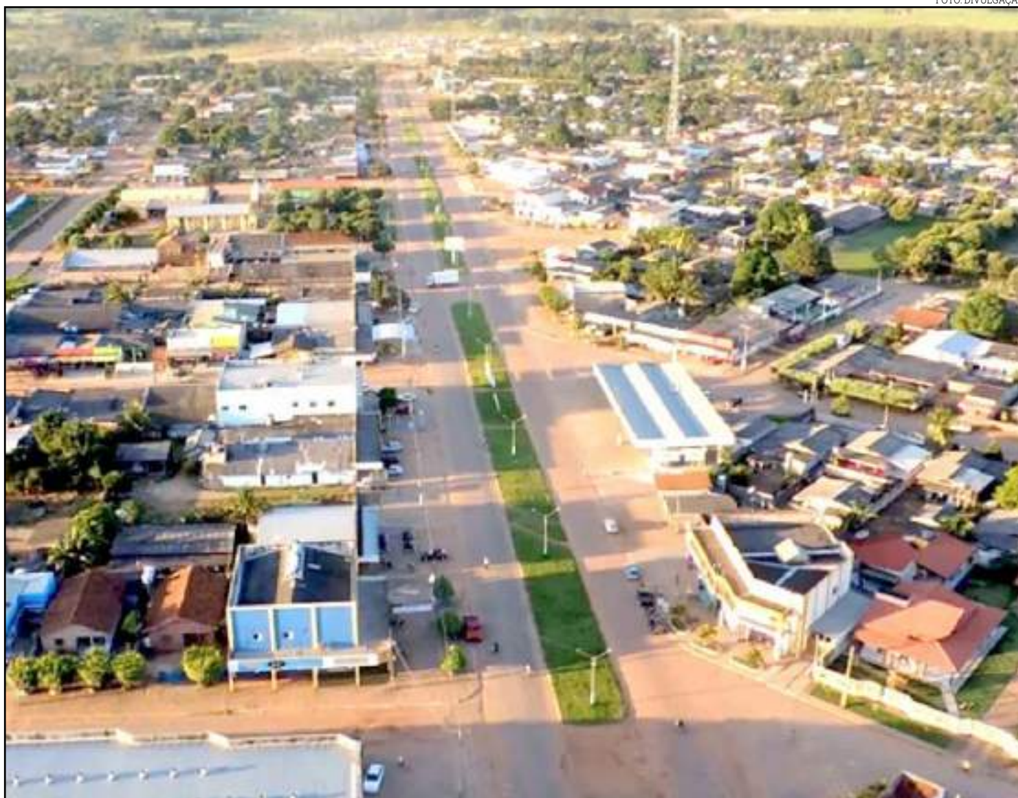
Carlinda ainda está livre de casos da Covid-19

Dentre os 20 municípios com maior número de casos de Covid-19 estão Cuiabá (4.949), Várzea Grande (1.597), Rondonópolis (1.480), Sorriso (946), Lucas do Rio Verde (909), Tangará da Serra (816), Primavera do Leste (803), Sinop (570), Nova Mutum (534), Pontes e Lacerda (476), Campo Verde (400), Cáceres (363), Confresa (330), Barra do Garças (270), Campo Novo do Parecis (267), Sapezal (253), Colíder (252), Querência (239), Matupá (223) e Peixoto de Azevedo (208).