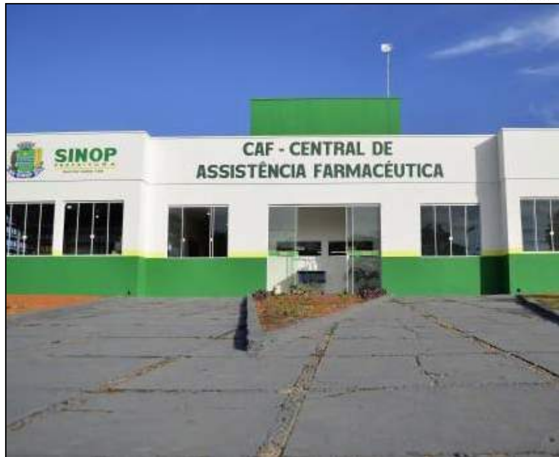
Farmácia fica no Jardim das Primaveras

busca de trazer melhorias à população e esse projeto, em especial, havia sido idealizado pelo secretário