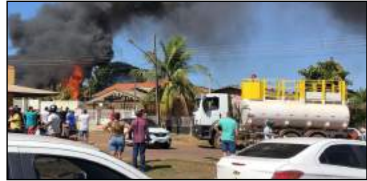
Vizinhos tentaram socorrer o idoso, mas fogo estava muito alto