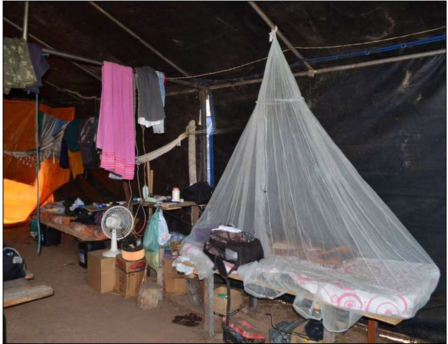
Trabalhadores em condição análoga a de escravos

A mudança ocorreu em razão de denúncias semelhantes contra a empresa fabricante de panelas em