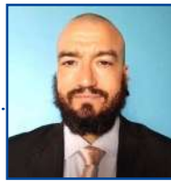
POR LEANDRO CARECA

E a gente vai ficando por aqui. Suas opiniões, sugestões e críticas são muito importantes, e você pode entrar em contato pelo fone (66) 99971-6500, pelo e-mail, lsmussi@hotmail.com ou visitar nosso perfil em facebook.com/pagina-