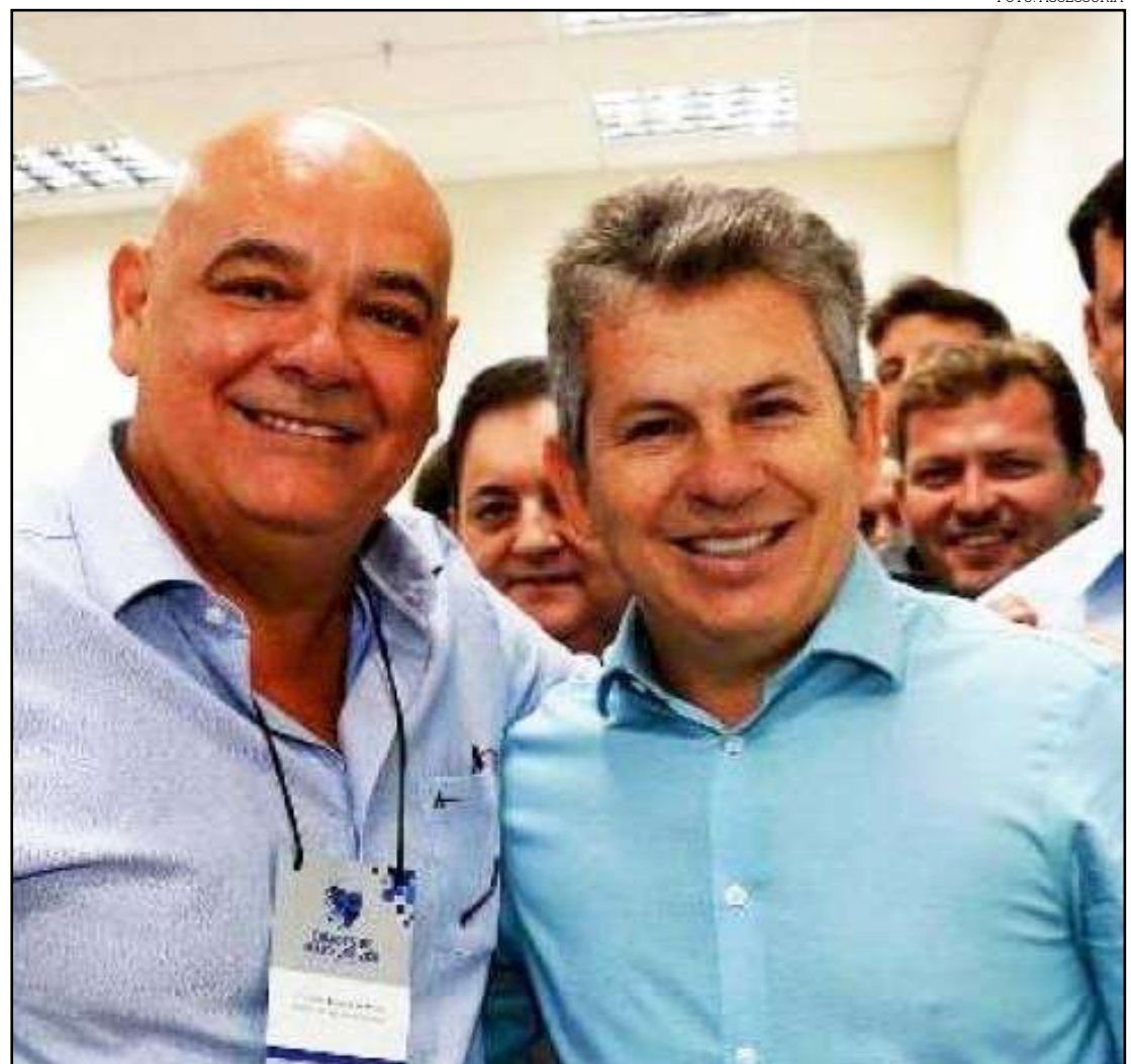
Ferreira e Mendes: ordem de serviço para sequência de pavimentação da MT-322

Também integram a lista os trechos da MT-222, na região de Sinop, e a revitalização do Anel Viário de Rondonópolis. As outras 64 ordens de serviços referem-se à construção de pontes de concreto, previstas nos programas Pro-Concreto.