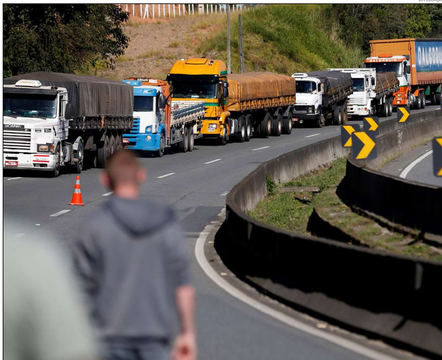
Valor será disponibilizado pelo BNDES; limite de financiamento por motorista é de R$ 30 mil

Onyx foi questionado sobre a política do governo para o preço do diesel. Ele afirmou que o tema é uma das reivindicações dos caminhoneiros e será tratado em reunião na tarde desta terça entre o presidente Jair