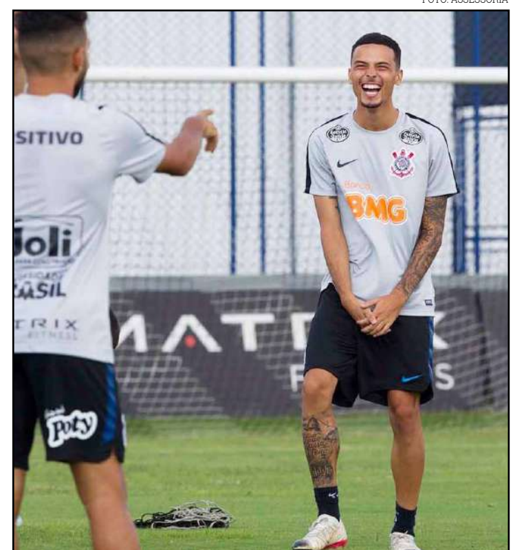
Volante é uma das opções em Chapecó da Copa do Brasil