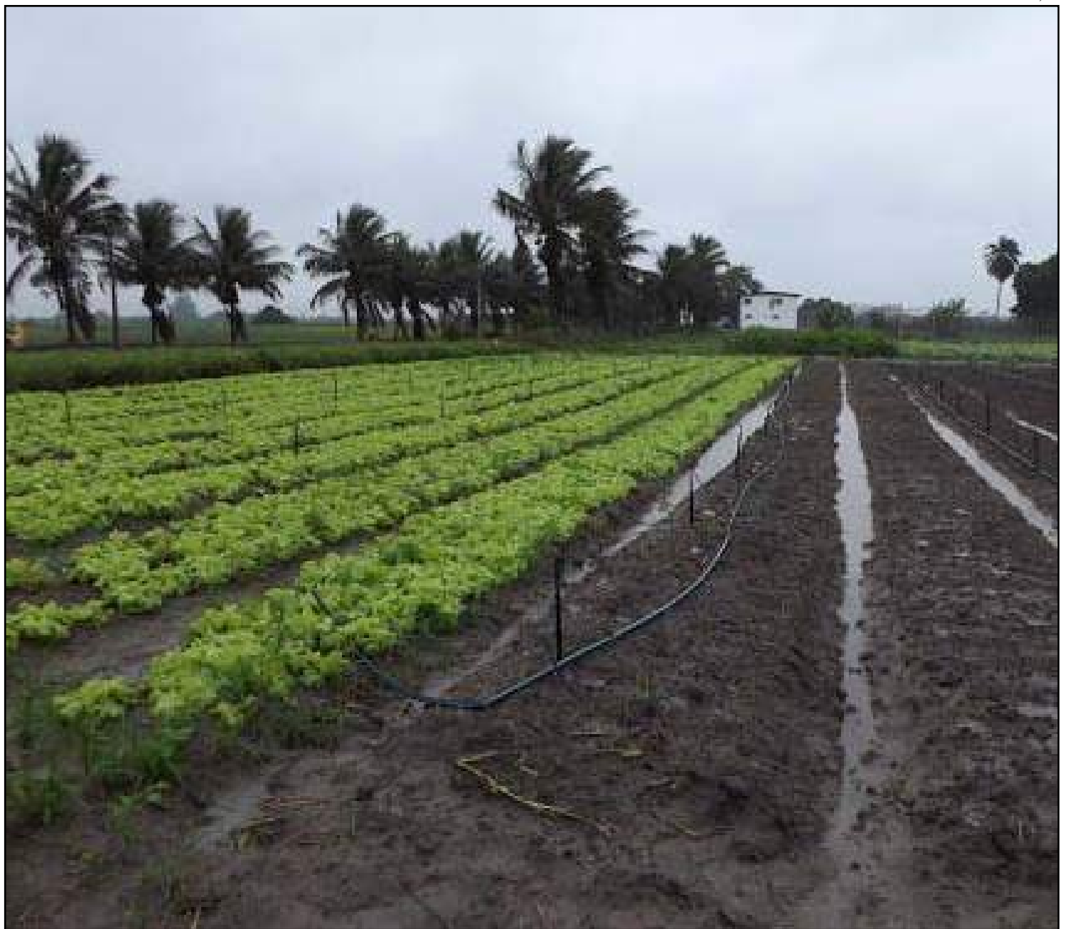
Planejamento do cultivo deve levar em conta o calendário da segunda safra

E o planejamento, claro, envolve a definição do calendário de plantio da safra principal, sem esquecer do posicionamento do cultivo da segunda safra. "Se a gente pensa que uma ocorrência de La Niña eu tenho veranico de fevereiro a março, então, provavelmente eu tenho que antecipar a minha semeadura da safra para tentar fugir desse veranico no período de semeadura da segunda safra. Porque se tenho veranico de 10 a 15 dias logo após a semeadura da segunda safra, o risco de perda da produção é muito grande", comenta.