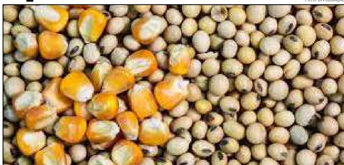
Preços atrativos motivaram agricultores a fechar com antecedência negócios

As indústrias de etanol instaladas em Mato Grosso aderiram à campanha "Abasteça com Etanol". O estado tem ao todo 13 indústrias em operação, que devem produzir juntas mais de 3,7 bilhões de litros do combustível nesta temporada. Deste montante, apenas 1,2 bilhão de litros costumam ser consumidos no mercado interno, que registrou queda expressiva na demanda (cerca de 60%, segundo o Sindálcool-MT) durante o fim de março e meados de abril, período de "pico" no isolamento social no estado em função da pandemia.