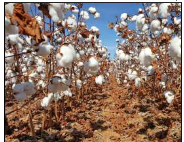
Colheita das lavouras avança lentamente