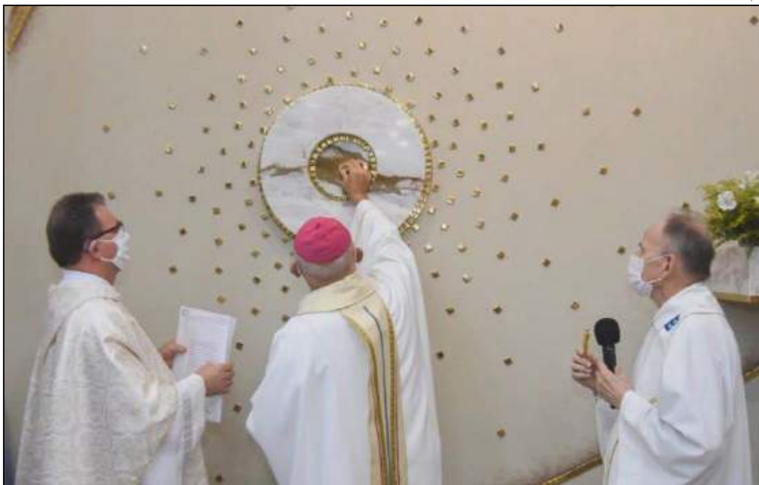
Como a relíquia de Santo Antônio chegou em uma paróquia da Amazônia?