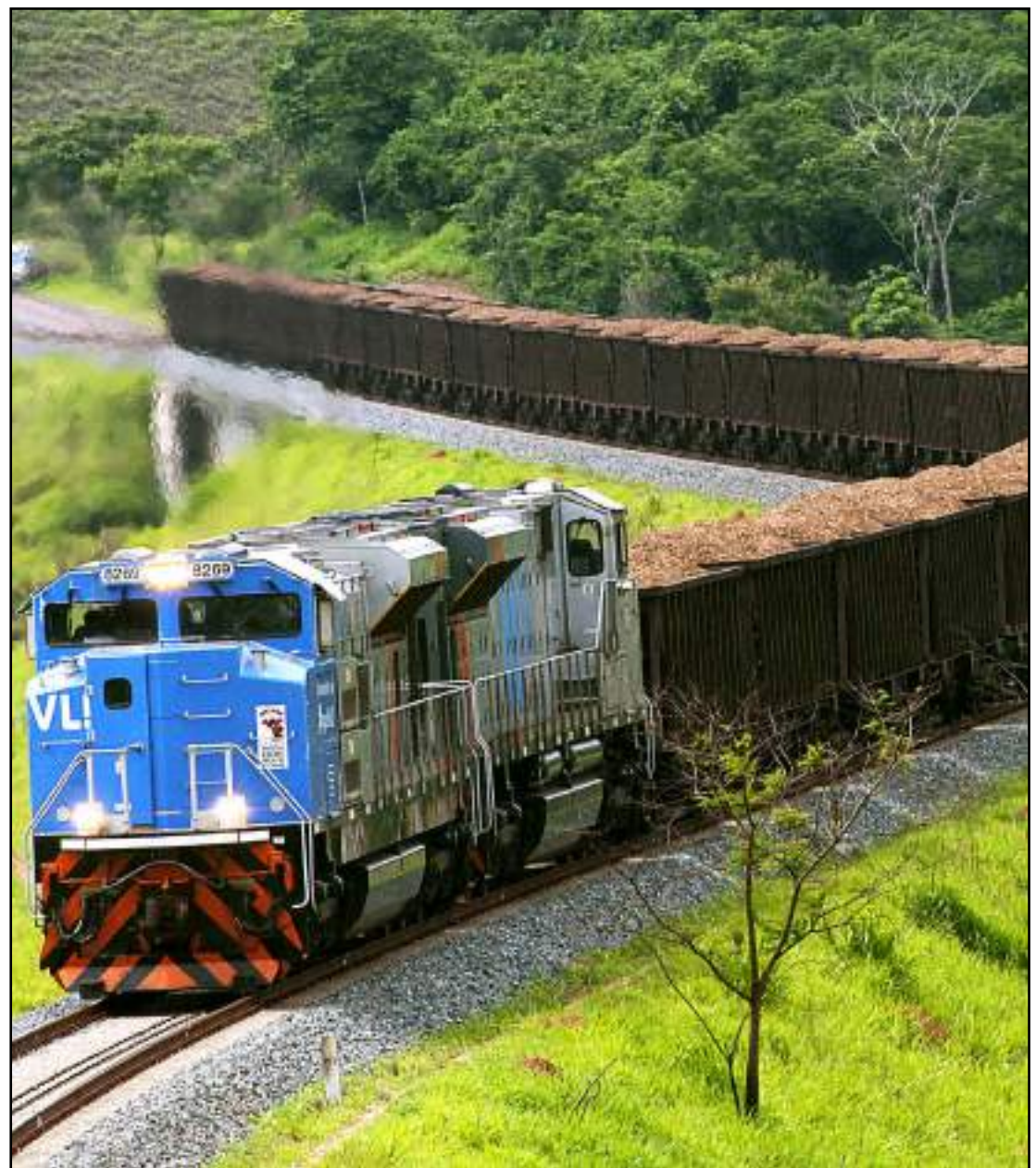
Investimento de 21 bilhões ao longo do tempo