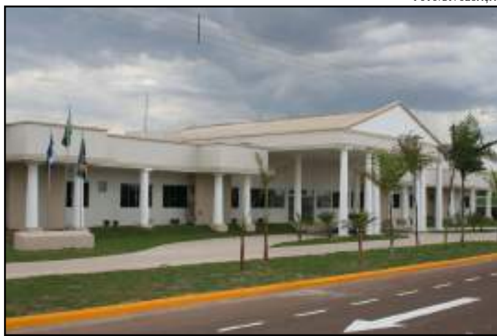
Fórum de Sinop ainda continuará fechado

Segundo a Portaria-Conjunta, na primeira etapa haverá apenas expediente interno, com o retorno exclusivo da presença física dos servidores e colaboradores (estagiários, terceirizados e credenciados), no horário das 13h às 19h, com manutenção da suspensão dos prazos pro-