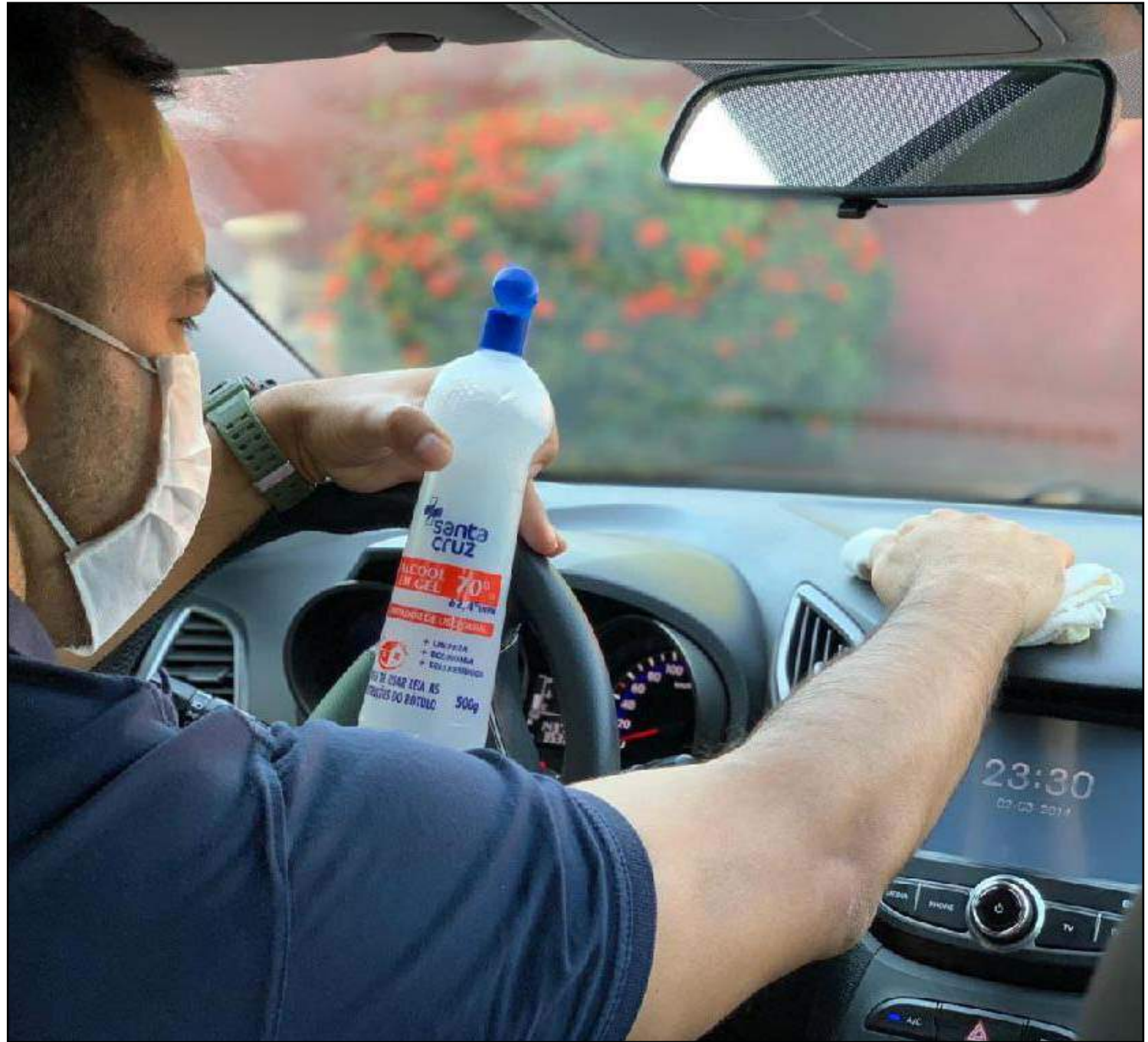
Limpeza do interior do veículo

Autoridades de Saúde recomendam que o capacete não seja de uso coletivo, por