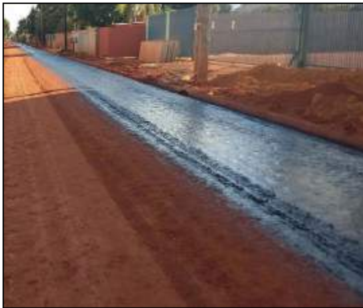
Investimento será de R$ 11 milhões

e Travessa Palmas, além das avenidas Cascavel e Ouro Preto. Esta será a 1.ª etapa dos trabalhos. De acordo com o edital, as obras serão executadas com montante obtido através do Programa de Financiamento à Infraestrutura e ao Saneamento (Finisa). A definição da empresa está prevista para o dia 17 de agosto. Os pagamentos serão feitos conforme andamento das obras, previsto em cronograma físico-financeiro especificado no edital do certame. Ao todo, a empreiteira vencedora terá 540 dias (18 meses) para concluir os trabalhos.