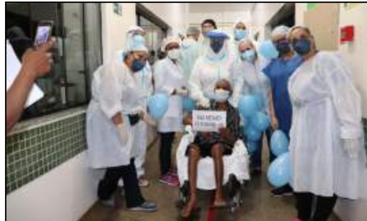
De um total de 1.779 infectados, 843 pessoas venceram a doença