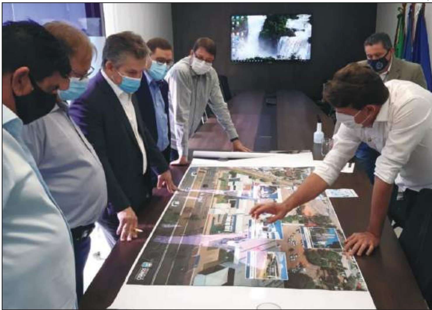
Leitos serão montados em parceria entre Governo do Estado e prefeituras

Também já foram registrados desde o início da pandemia um total de 41 óbitos confirmados, enquanto três mortes estão sob investigação.