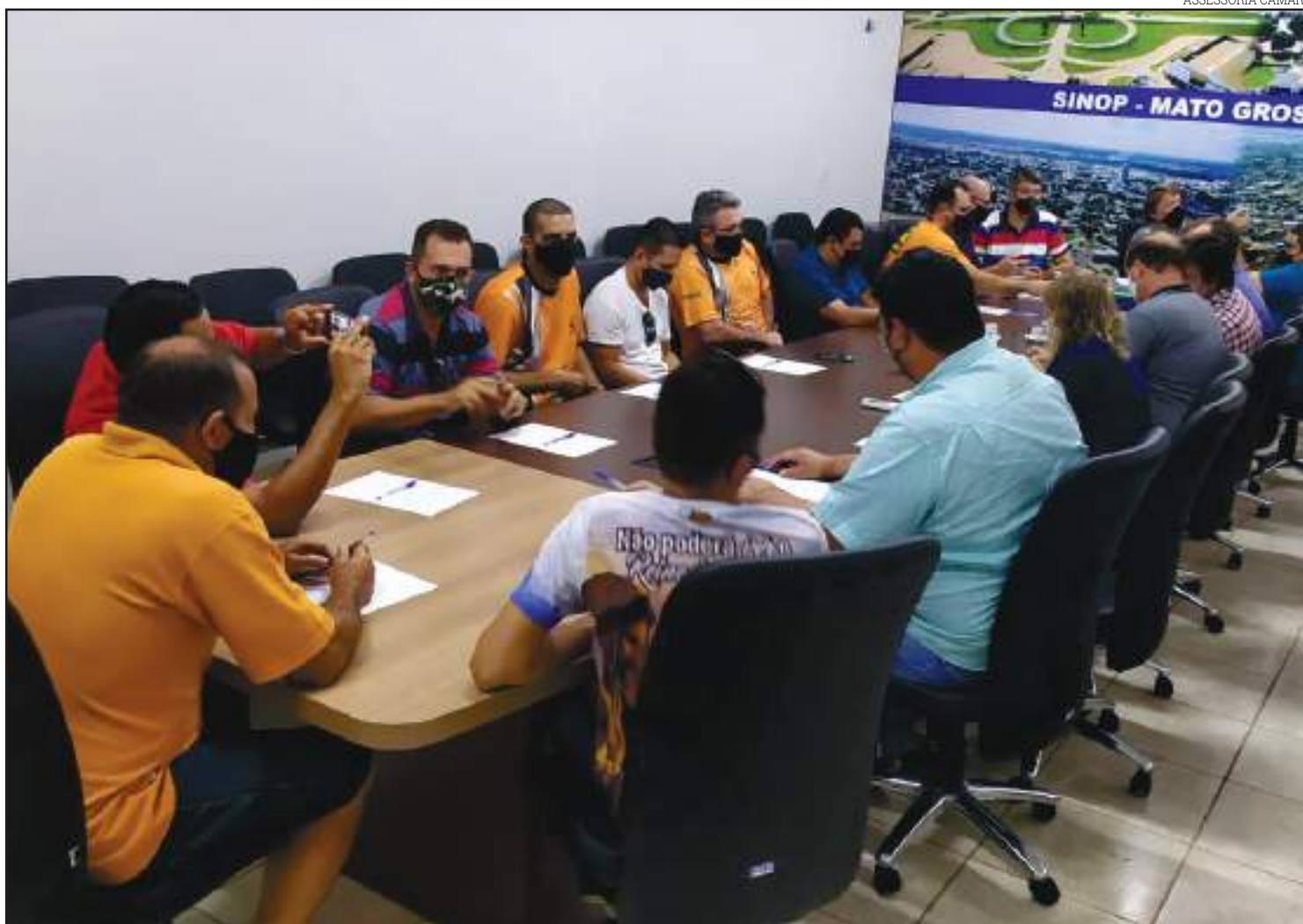
A categoria, composta por 40 motoristas

Para que o recurso chegue ao destino, será necessário que a Prefeitura Municipal desenvolva um Projeto de Lei que deverá ser encaminhado à câmara e aprovado pelos vereadores. Todos os parlamentares presentes, anteciparam o voto e confirmaram o apoio para aprovação. “Essa reunião de hoje mostrou a sensibilidade desta câmara de vereadores, se propondo a devolver um valor para prefeitura transformar em um auxílio para o pessoal que trabalha com as vans. Esse recurso chegando na prefeitura, vamos estudar tecnicamente a evolução desse projeto, a legalidade dele, como que faz nas peças orçamentárias, quais são as modificações que deverão ser feitas, para criar um projeto e mandar