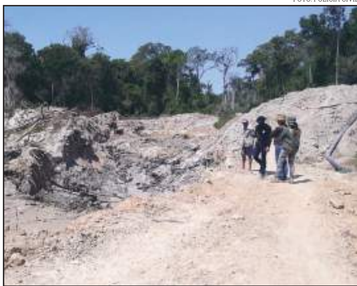
Cinco homens foram detidos na zona rural de Apicás

Também foi localizada uma máquina escavadeira, que não estava em funcionamento, porém, utilizada no garimpo. As equipes constataram quatro garimpeiros trabalhando dentro de um buraco. As cinco pessoas foram conduzidas para a Delegacia de Apicás. Todos os