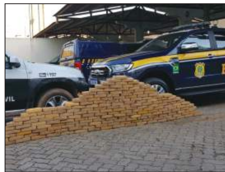
Cinco homens foram detidos na zona rural de Apicás