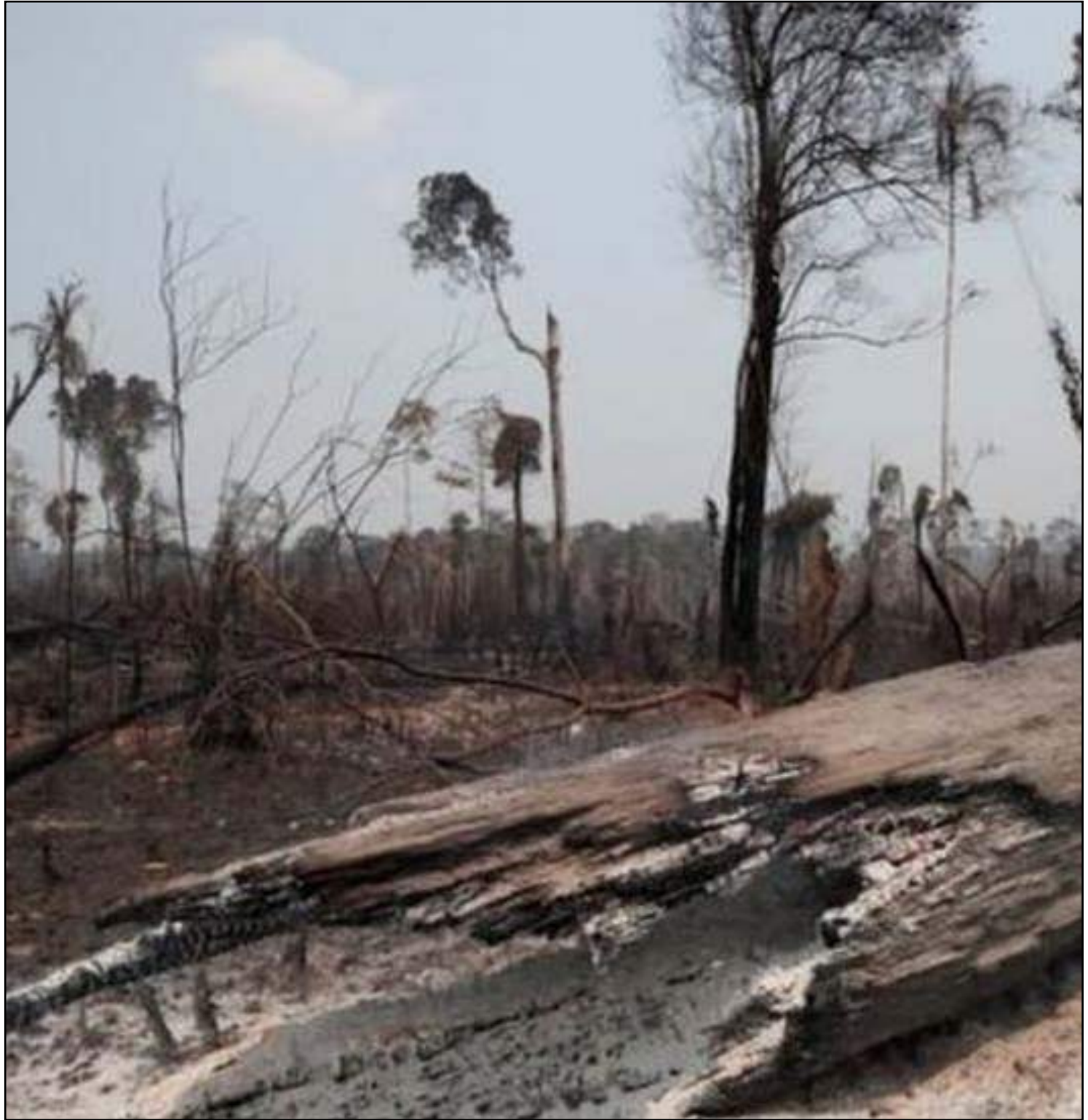
Desmatamento na Amazônia bateu novo recorde nos alertas de desmatamento em junho

Os números dos alertas de desmatamento compilados pelo Deter estão públicos e disponíveis na plataforma Terra Brasilis desde 2017. A Amazônia Legal inclui o Acre, Amapá, Amazonas, Pará, Rondônia, Roraima e parte dos estados de Mato Grosso, Tocantins e Maranhão.