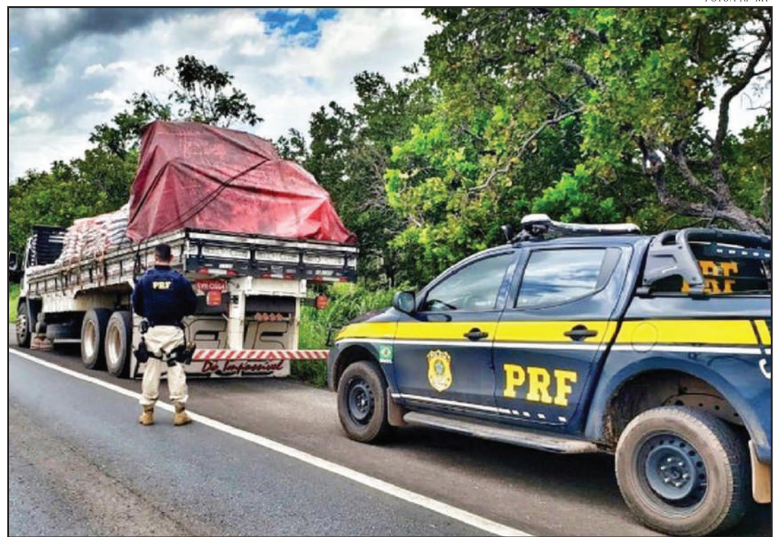
Ações iniciaram ontem e seguem até domingo

Na Operação do ano passado, de 29 de março a 1º de abril, a PRF em Mato Grosso registrou 35 acidentes, que resultaram em 4 mortos e 19 feridos nas cinco rodovias federais que cortam o estado.