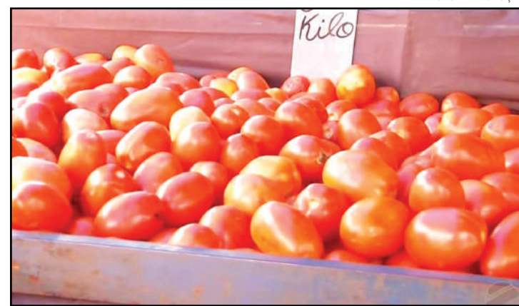
Em março, preço do tomate chegou a aumentar 88,6%