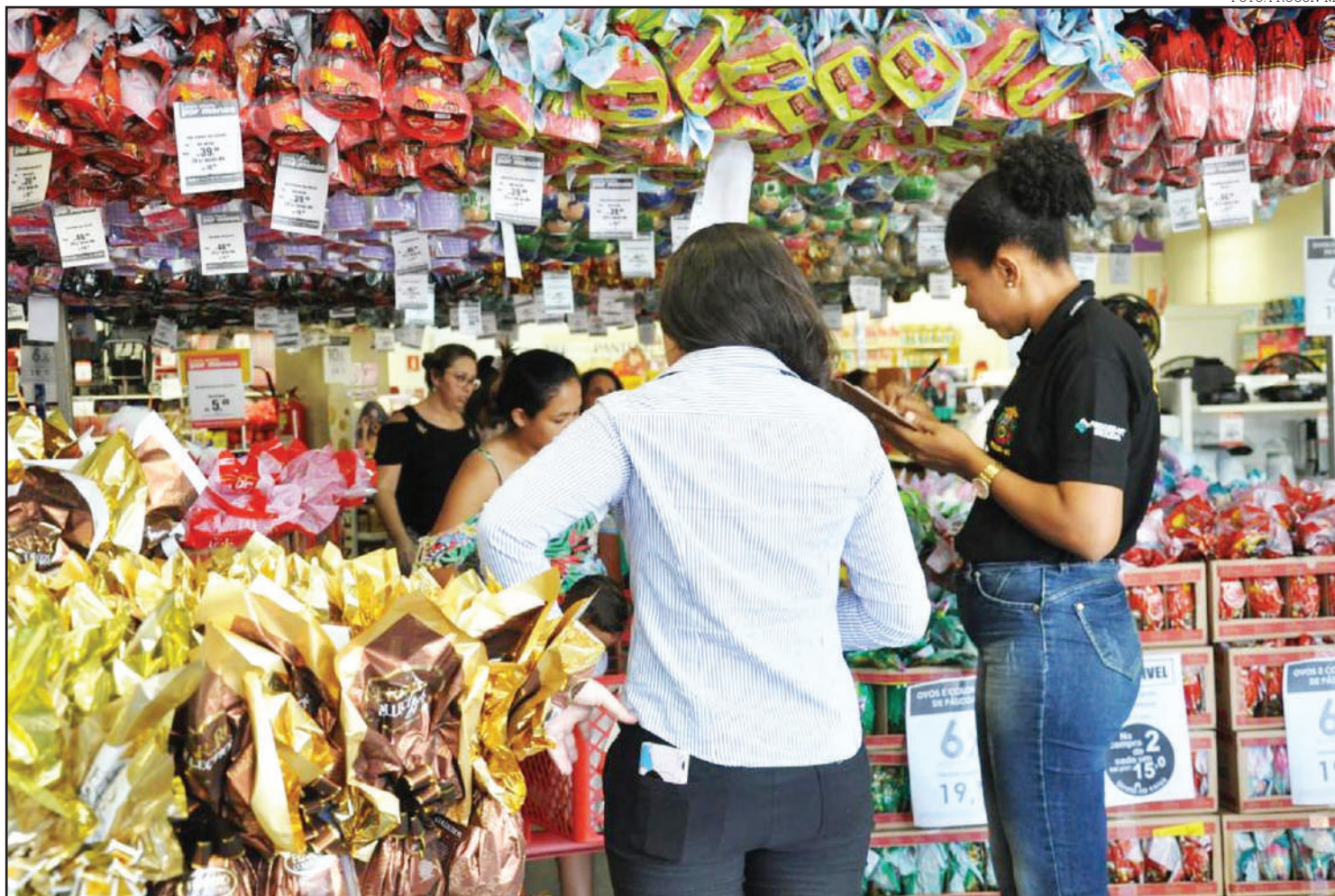
Preços dos ovos foram levantados pela fiscalização do Procon

Outro estudo realizado pelo Procon Estadual este mês aponta que os consumidores estão atentos e preocupados com o aumento de preço dos produtos, tanto que 50% daqueles que responderam à pesquisa presencial realizada no órgão afirmaram que “não decidiram” ou “não vão comprar ovos ou produtos de chocolate na Páscoa deste ano”.