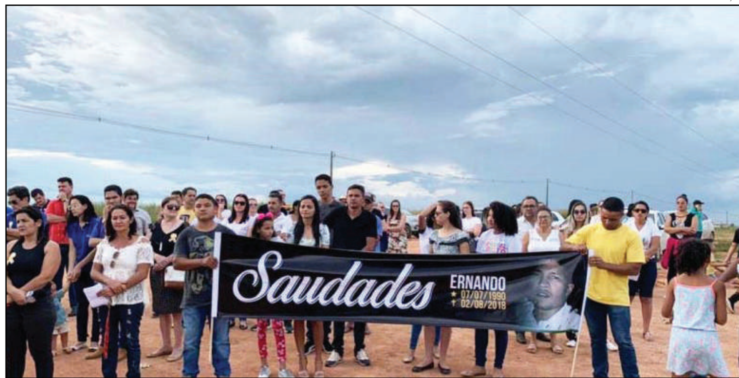
Alto número de mortes tem sido registrado no trecho da BR-163