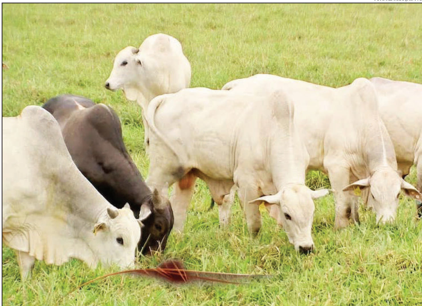
Preço do bezerro apresenta aumento diante da baixa oferta de animais

Na fazenda existem 2,5 mil matrizes, e o primeiro lote de bezerras devem ser desmamados até o final deste mês. “Temos parceiros que já se adiantaram e compraram, inclusive, a produção que vai desmamar a partir do final de abril. Essa situação é diferente dos anos anteriores”, comentou o proprietário da fazenda, Antônio Maércio