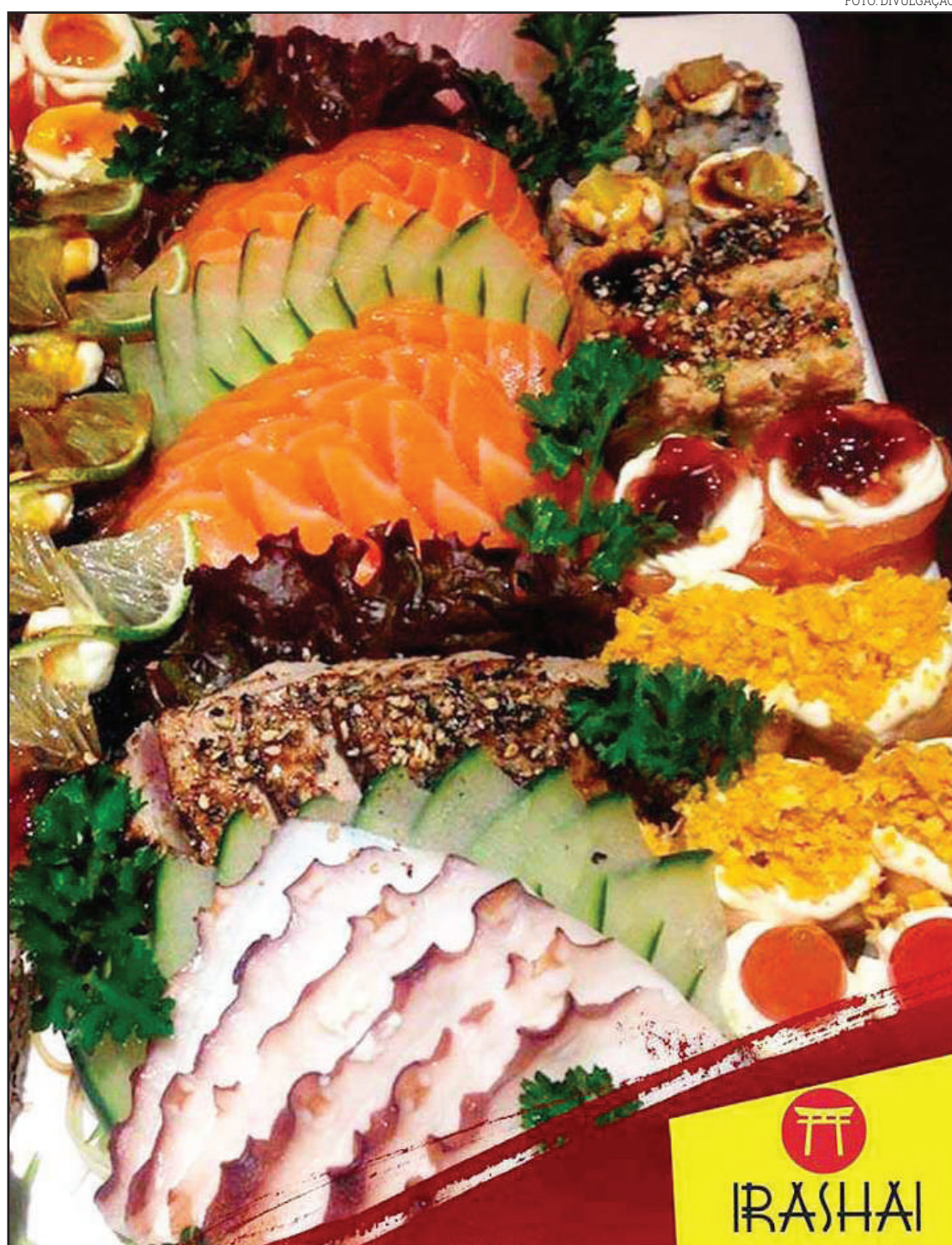
Combos são atração diferenciada para todos os públicos

DE – Qual sua previsão de futuro neste ramo?