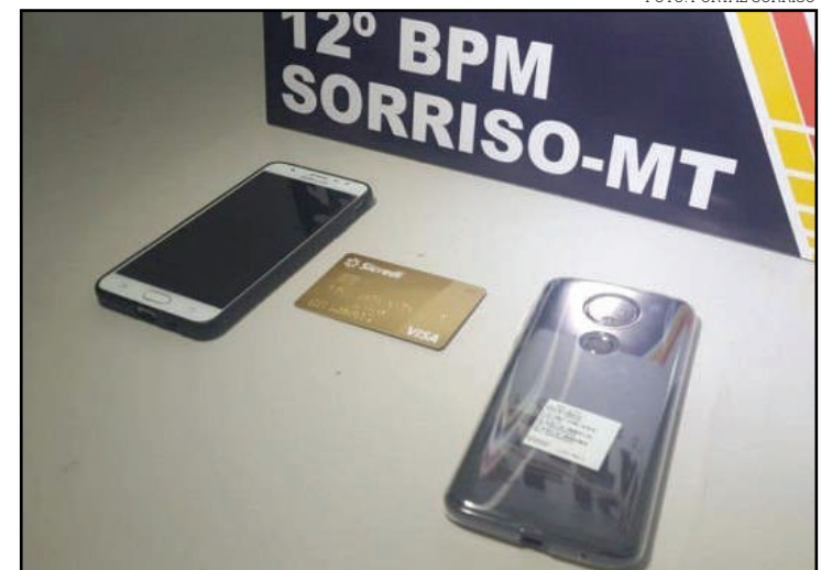
Menos gastou R$ 300 em uma pizzaria e comprou um celular em uma loja