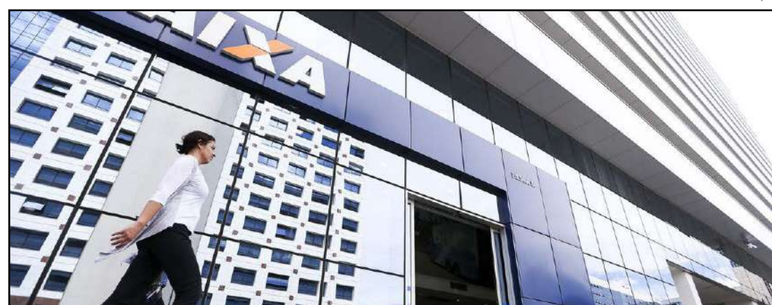
Confiança cresceu mais entre os empresários de indústria e comércio

De acordo com o economista da FGV Rodolpho Tobler, o resultado da prévia de agosto mostra continuidade na recuperação da confiança do empresariado brasileiro, que está apenas 2,7 pontos abaixo do patamar de fevereiro, antes da pandemia do novo coronavírus. A con-