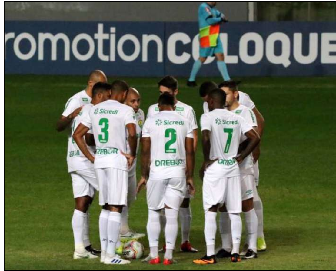
CBF adiou jogo do Cuiabá contra o CSA

Com isso, a delegação do Cuiabá, que está em Minas Gerais, onde venceu o América na terça (11), retorna hoje à capital mato-grossense para continuar a preparação para enfrentar o Confiança/SE, na terça (18), às 20h, na Arena Pantanal. Oportunamente, a Diretoria de Competições da CBF informará a nova data para realização da partida.