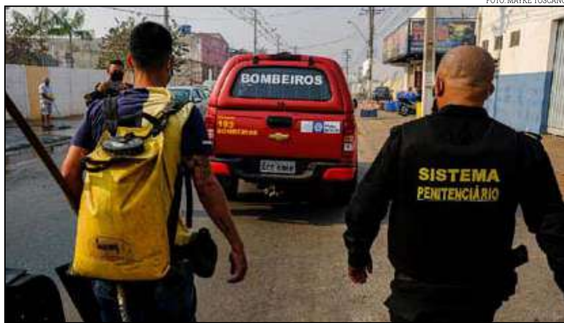
Aula prática de combate aos incêndios para os reeducandos

O Sistema Penitenciário e o Corpo de Bombeiros articulam para ampliar a parceria no uso da mão-de-obra dos presos como brigadistas, para que eles auxiliem no combate às queimadas urbanas em Mato Grosso. Em uma iniciativa inédita no país, recuperando do Complexo Penitenciário Ahmenon Lemos Dantas, localizado em Várzea Grande, passaram por dois dias de capacitação para começarem nesta sexta (14) a combater o fogo na área urbana de Poconé. A iniciativa partiu da juíza de Poconé que, diante do agravamento da situação no Pantanal, firmou a parceria junto a Vara de Execução Penal e a Secretaria de Estado de Segurança Pública, por meio da Adjunta de Administração Penitenciária. Contudo, com a chegada de bombeiros do Mato Grosso do Sul e as Forças Armadas na força-tarefa da Operação Pantanal 2, a mão de obra