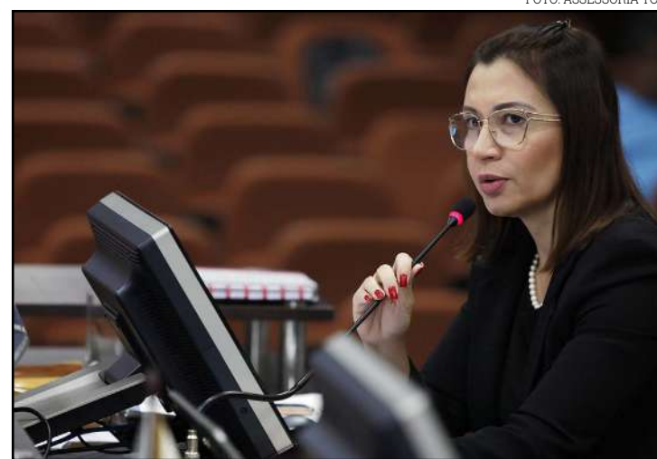
TCE apontou indícios de sobrepreço na aquisição