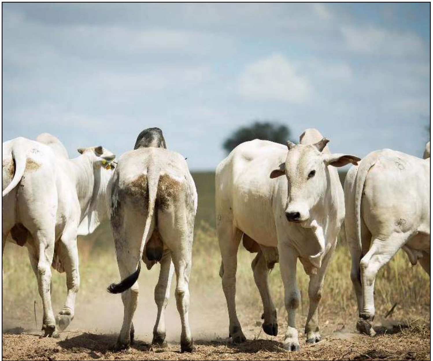
Exportações cresceram 42% em relação a julho/2019

A China responde por 48% das exportações brasileiras, enquanto Mato Grosso eleva este percentual para 59% de exportações de produtos de carne bovina.