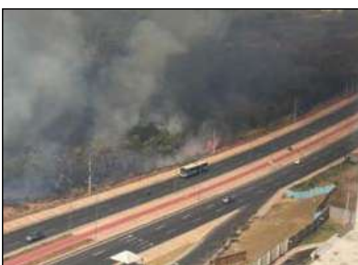
Incêndio teve início na manhã da última quarta

Com enormes labaredas, o incêndio de grandes proporções teve início na manhã de quarta-feira e destruiu grande parte da vegetação às margens da rodovia. Um helicóptero do Centro Integrado de Operações Aé-