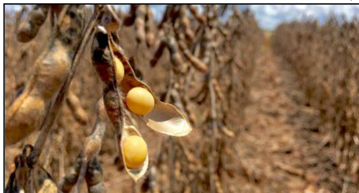
Nunca comercialização de uma safra começou com tanta antecedência

O preço de comercialização em julho girou em torno de R$ 87 a saca segundo o Imea. Em agosto, já ultrapassa a casa dos R$ 90, conforme a região. Aumento decorrente da maior procura pelo grão. “São vários os motivos que levam o produtor a fazer essa negociação e também o mercado a propor esses preços ao produtor neste momento. A relação oferta/demanda mundial acaba ditando estes preços. A China está comprando grandes volumes e o Brasil já está com o recorde de exportação consolidado este ano. A quebra de safra no ano passado nos Estados Unidos auxiliou para que o mundo comprasse