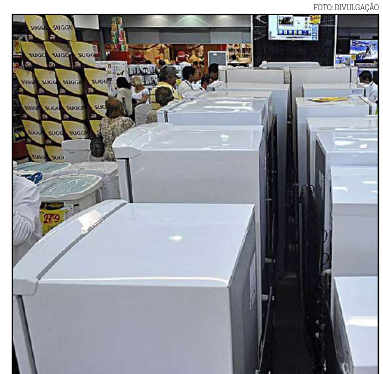
Benefício foi criado para reduzir os efeitos da Covid-19

prévia de agosto, enquanto o Índice de Expectativas Empresarial cresceu 4,8 pontos, para 90,4 pontos.