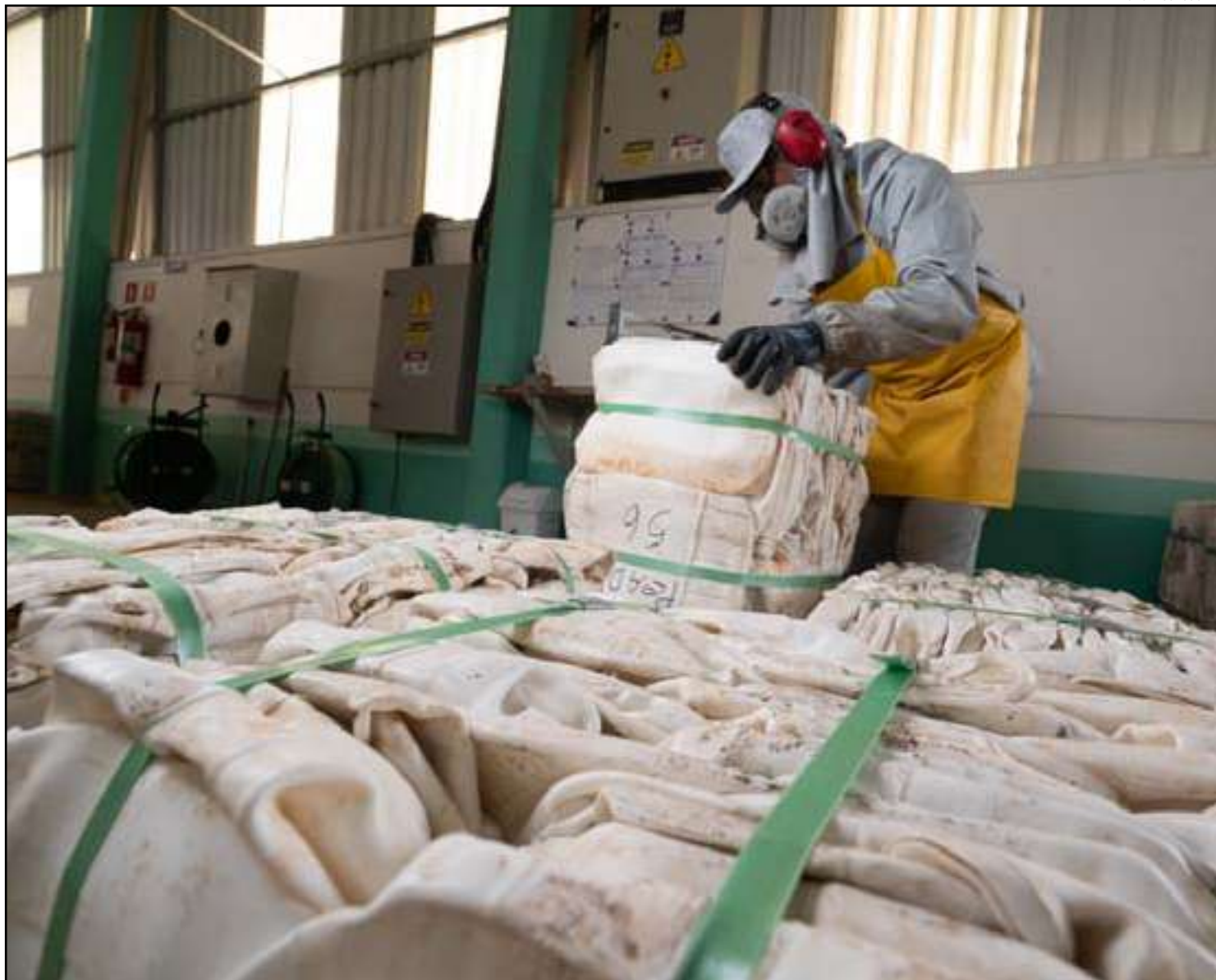
Sinop participará das comemorações do dia nacional

O Dia Nacional do Campo Limpo foi instituído no calendário brasileiro em 18 de agosto, por meio da Lei