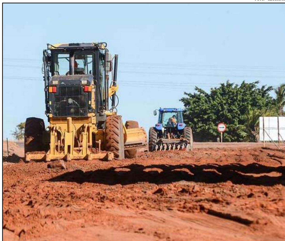
As obras rodoviárias são realizadas em todas as regiões de Mato Grosso

Além dessas obras rodoviárias, as construções de pontes de concreto também receberam recursos do Fethab. Foi aplicado o montante de R$ 28,2 milhões, do total de R$ 121 milhões investidos nessas obras de artes especiais. O investimento do Fethab representou 6% do valor total aplicado do fundo.