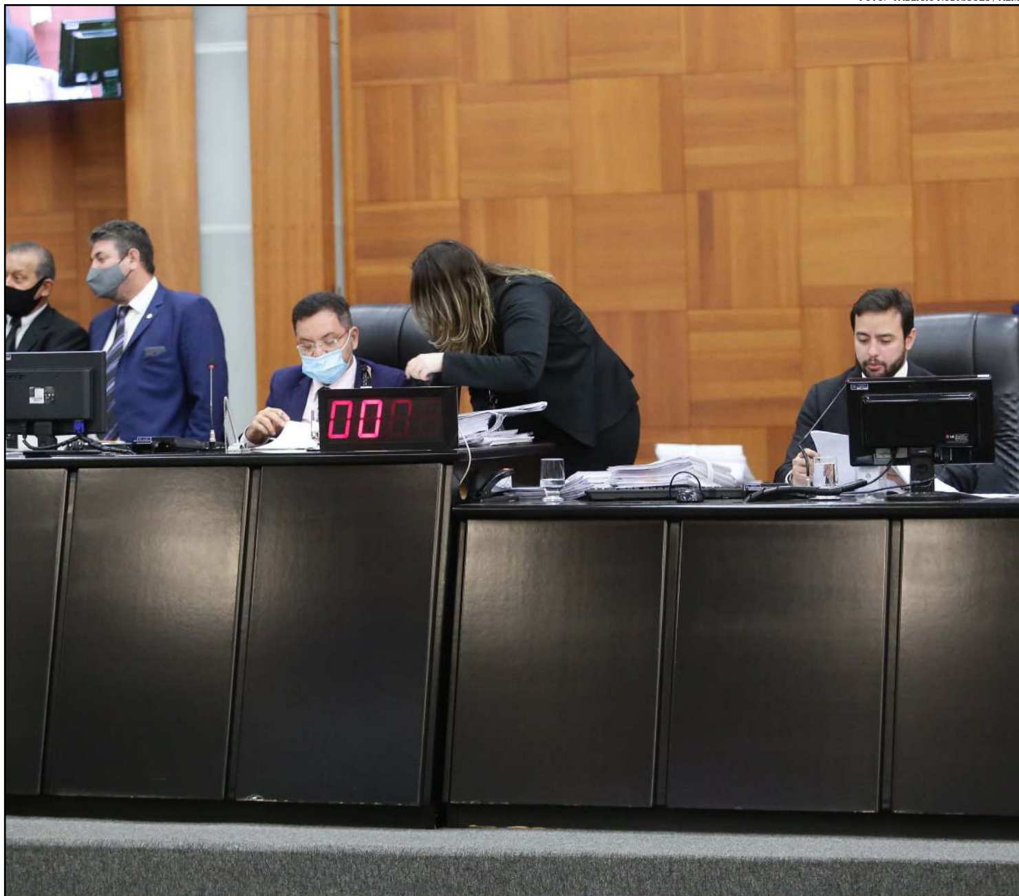
Apenas quatro parlamentares votaram contrários

Os deputados estaduais aprovaram ainda o Projeto de Resolução 149/2020, da Comissão de Fiscalização e Acompanhamento da Execução Orçamentária, que reconhece, para efeitos do artigo 65 da Lei Complementar Federal nº 101, de 4 de maio de 2000, a ocorrência do estado de calamidade pública no município de Ipiranga do Norte.