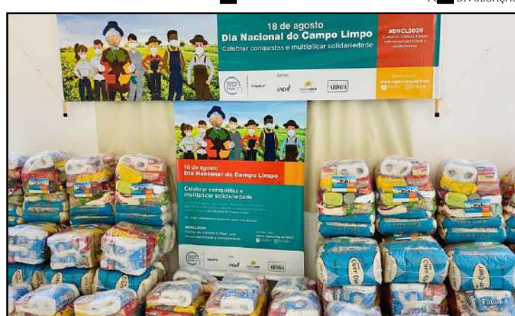
Entrega foi feita no dia 18

“Todo ano, nesta data, por 15 anos fizemos uma festa com as escolas, na Ardava. Este ano é diferente... Toneladas de embalagens vazias de defensivos recebem o destino correto! Só aqui na Central de Canarana, este ano serão 1.300 toneladas! A festa este ano teve