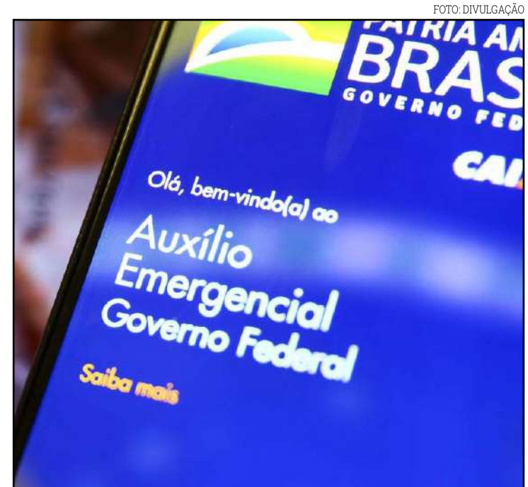
Auxílio foi pago a pessoas nascidas em outubro

O saque em dinheiro do benefício, em uma agência do banco, é autorizado posteriormente, conforme calendário definido pelo governo, considerando o mês de nascimento do beneficiário. As transferências para outros bancos ou para contas na própria Caixa seguem o mesmo calendário de saque. Nesse caso, os recursos são transferidos automaticamente para as contas indicadas pelo beneficiário.