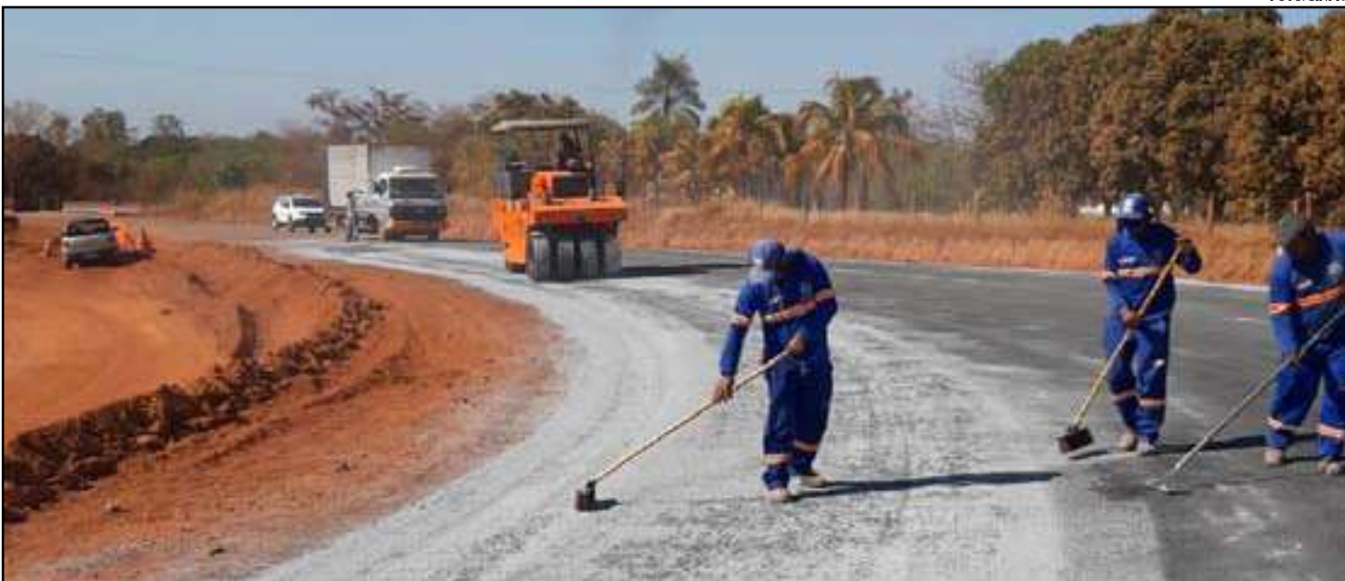
Estrada já tem nova aparência