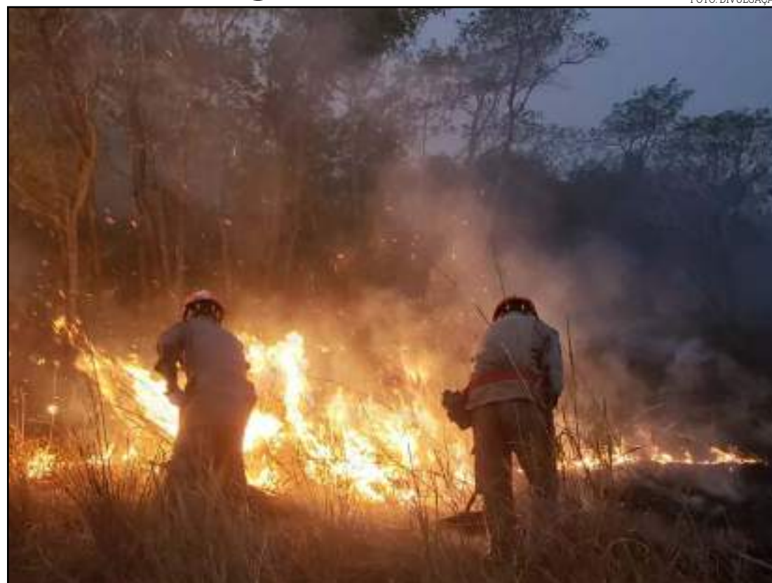
Protesto é considerado ilegal pela justiça federal

"Mesmo com essa temperatura baixa, a incidência dos focos continua. As equipes continuam em campo no