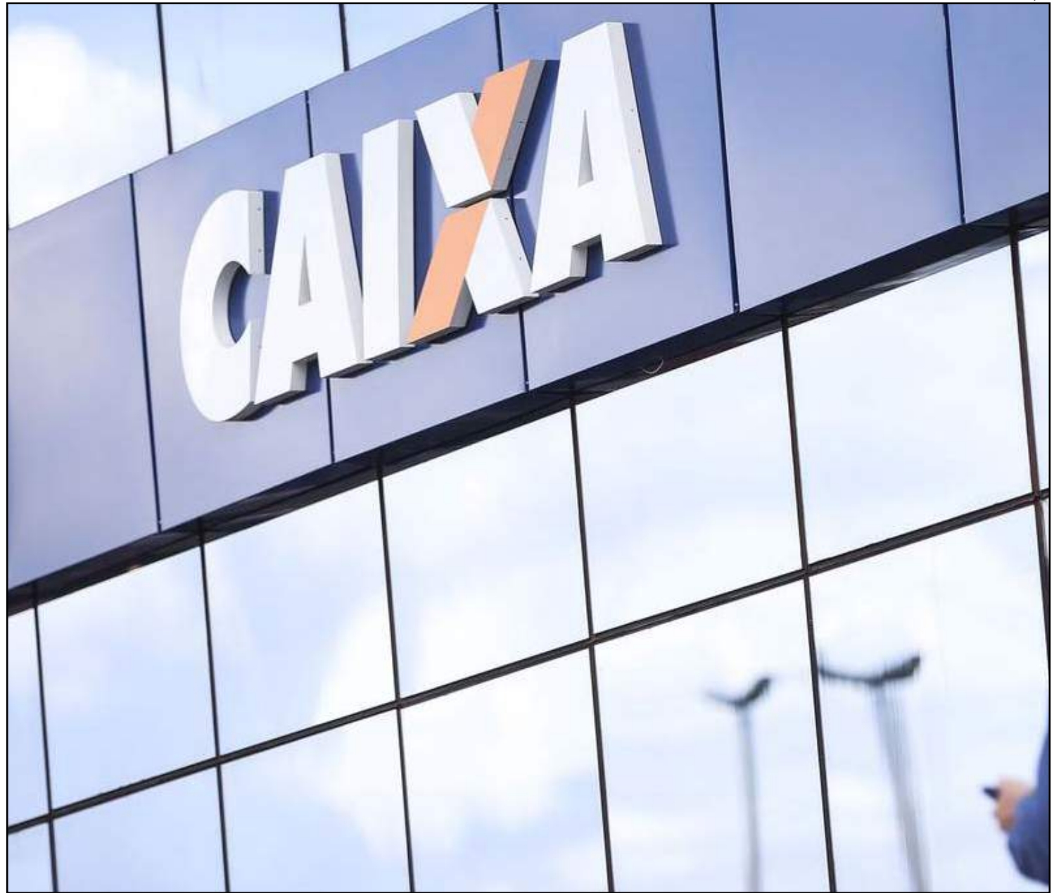
Agências ficarão abertas hoje das 8h às 12h

Para realizar o saque em espécie, é preciso fazer o login no Caixa Tem, selecionar a opção "saque sem cartão" e "gerar código de saque". Na sequência, deve ser inserida a senha para visualizar o código de saque na tela do celular, que tem validade de uma hora. O código deve ser utilizado nos caixas eletrônicos da Caixa, nas unidades lotéricas ou nos correspondentes Caixa Aqui.