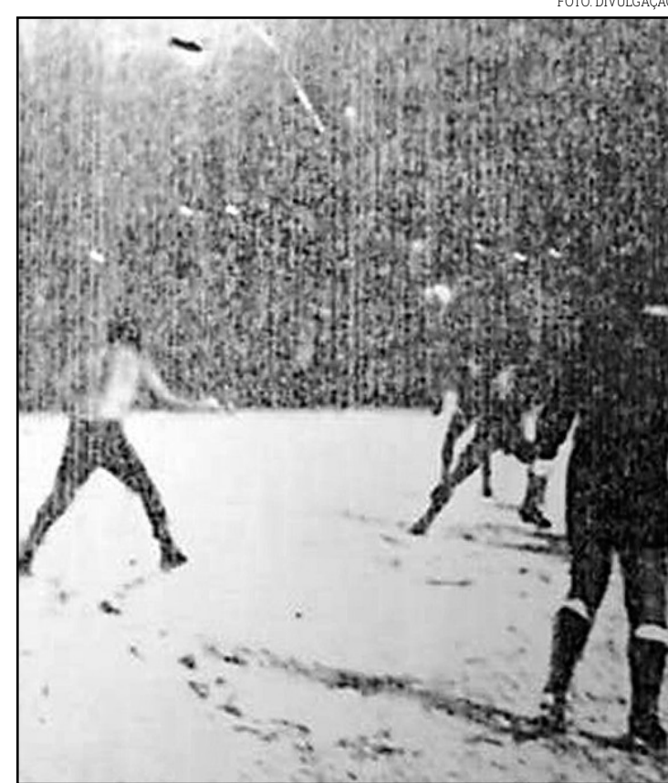
Gramado coberto de neve em jogo do Catarinense

"Tinha um repórter que, quando nós começamos a transmissão, o narrador chamou, mas nada dele entrar no ar. Quando conseguiu, entrou todo eufórico. Ele explicou a situação, eu estava com meus lábios encardados de tanto frio. Ele não conseguia falar direito, não conseguia abrir a boca para falar".