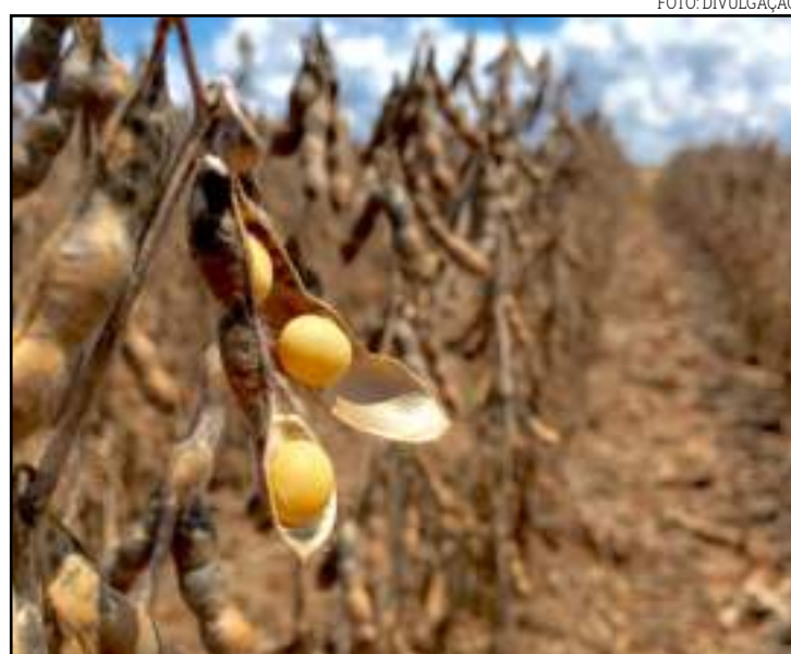
Produtor eleva suas pedidas, mas sem contrapartida

Em Rondonópolis, a saca passou de R$ 125 para R$ 129. Em Dourados/MS, a cotação avançou de R$ 130 para R$ 132. Em Rio Verde/GO, a saca seguiu em R$ 125.