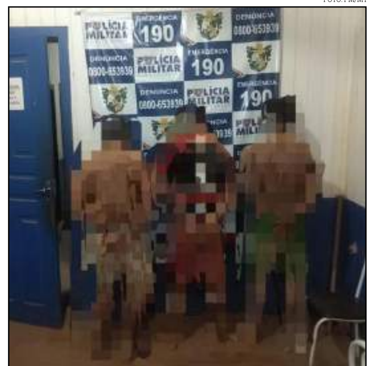
Trio é suspeito de estupro de adolescentes de 12 e 13 anos

As adolescentes confirmaram que sofreram abuso sexual pelos suspeitos. Os três homens foram presos por crime de estupro de vulnerável e levados à Polícia Civil.