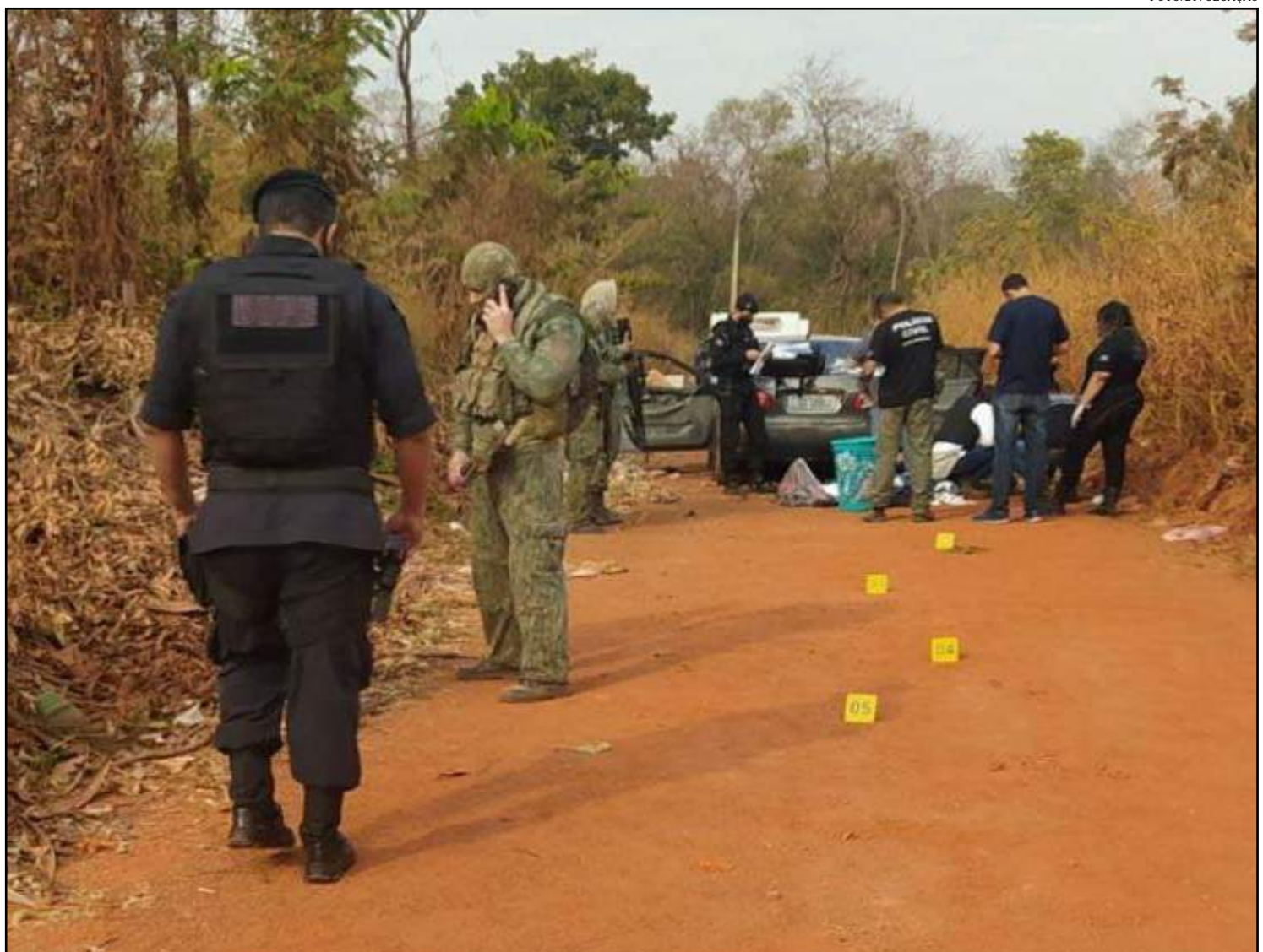
Confronto ocorreu nos fundos do residencial Belvedere, em Cuiabá