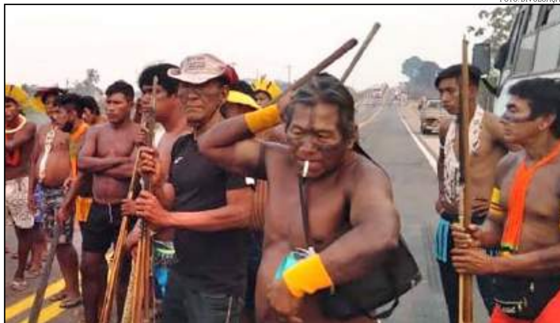
Protesto é considerado ilegal pela justiça federal

No início da tarde desta sexta (21) a passagem foi liberada às 12h e há previsão do fechamento da pista é ser retomado às 18h. Os indígenas continuam no trecho e logo mais deverá haver reunião por videoconferência com autoridades de Brasília. Carreiros que transportam soja, milho e demais produtos até portos em Miritituba e Santarém estão parados no local. Não foi informado