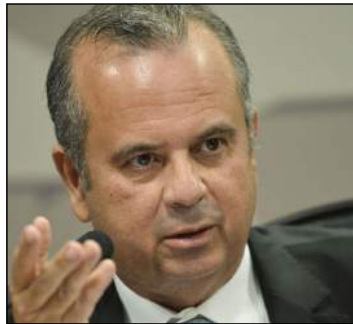
Meta é apoiar os municípios para a regularização fundiária