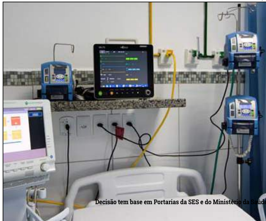
Decisão tem base em Portarias da SES e do Ministério da Saúde

“É imprescindível a notificação diária desses dados para a coordenação adequada e efetiva da situação no Estado.