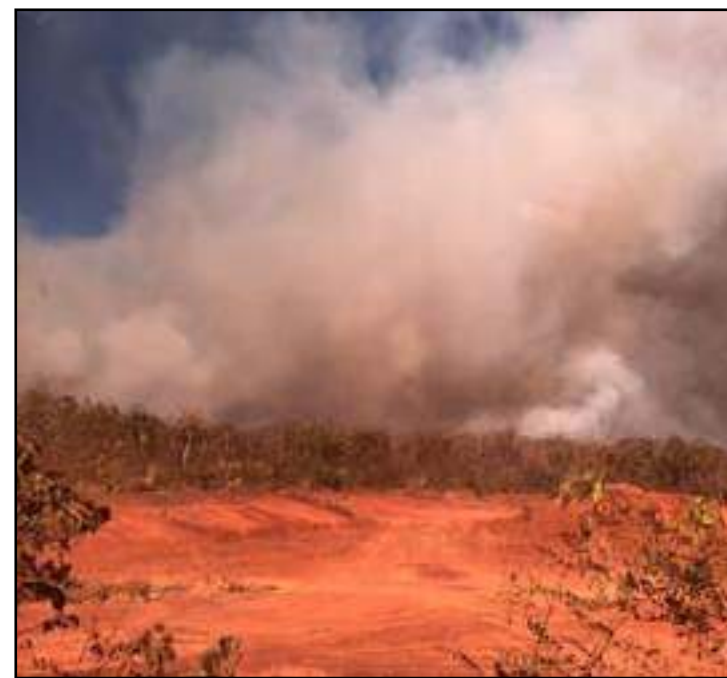
Queimadas na aldeia Tadarimana destrói vegetação

Ainda não foi possível fazer o levantamento dos danos causados pelo incêndio na região. Os bombeiros continuam os trabalhos para combater as chamas.