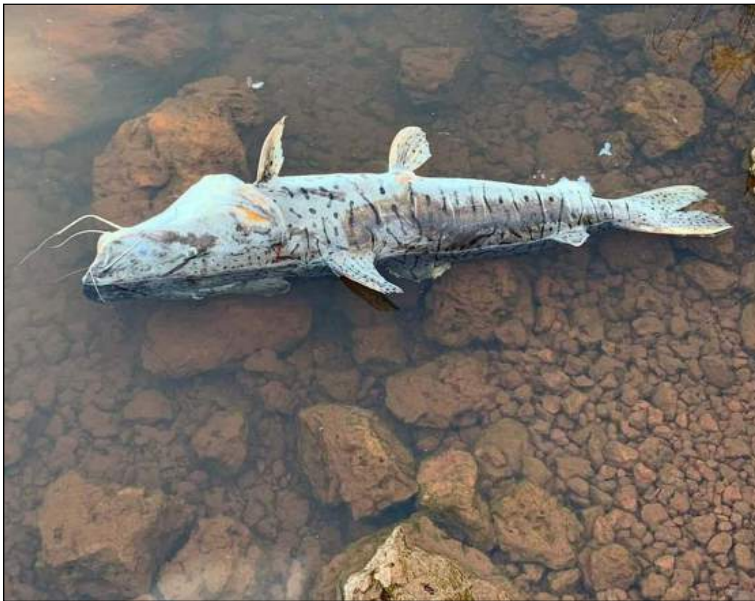
Nenhuma operação poderá ser feita sem autorização da Sema

Eles querem também que a UHE crie ou contrate um laboratório que seja especializado em alevinos, como