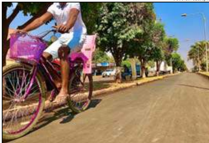
Principal ciclovia está passando por revitalização

Para quem usa a ciclovia a reforma melhorou as condições de uso. “Antes era cheio de buraco, agora melhorou, espero que façam em toda a ciclovia”, declarou um morador, que usa todos os dias a via para ir ao trabalho. A Secretaria de Infraestrutura informou que os trabalhos devem ser realizados em toda a extensão da via, mas o cronograma deve seguir em conjunto com a pavimentação de várias ruas do Palmeiras.