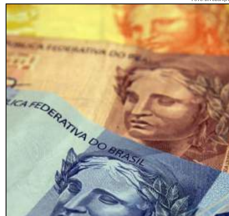
Com o novo limite, governos locais podem pegar mais de R$ 6 bilhões

lhões para a saúde estadual. Além disso, cada um dos deputados vem trabalhando em sua região para oferecer suporte às prefeituras na árdua missão de salvar vidas. É importante frisar que nosso estado tem dimensão continental, 141 municípios e as grandes distâncias dificultam o acesso à saúde”, concluiu o parlamentar.