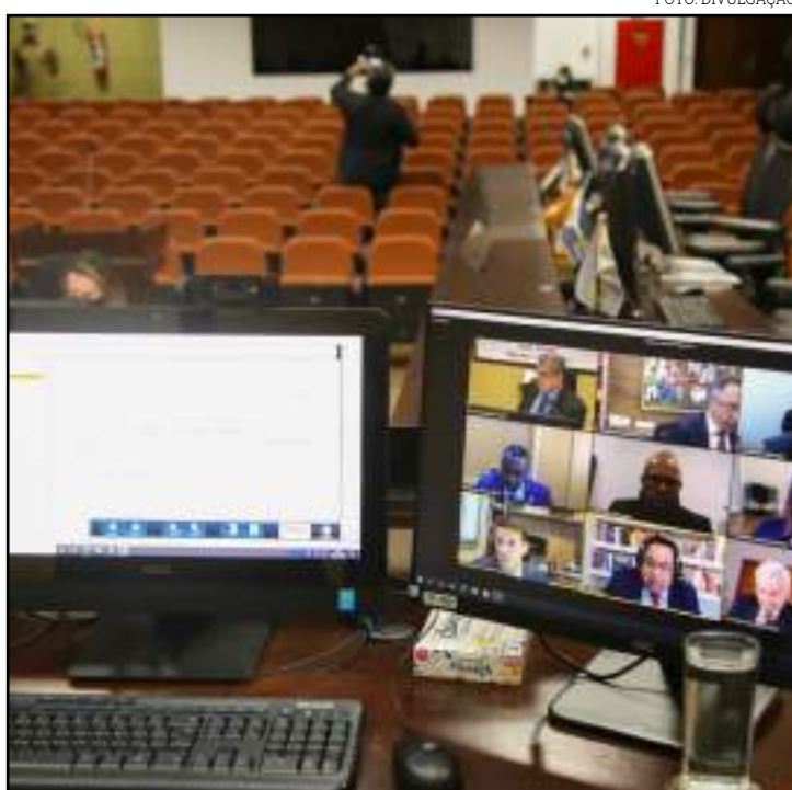
Foram vistoriadas dez unidades de saúde existentes no Estado

Além disso, em parceria com a Secex de Contratações Públicas, foi feita uma avaliação da transparência dos municípios do Estado, tendo a Secex Saúde e Meio Ambiente ficado responsável pela análise de cidades como Cuiabá e Várzea Grande. O