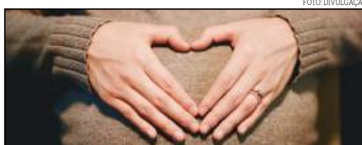
Até julho 200 mulheres grávidas morreram

Em Mato Grosso, a Comissão da Saúde da Assembleia Legislativa vive um momento histórico. Tem