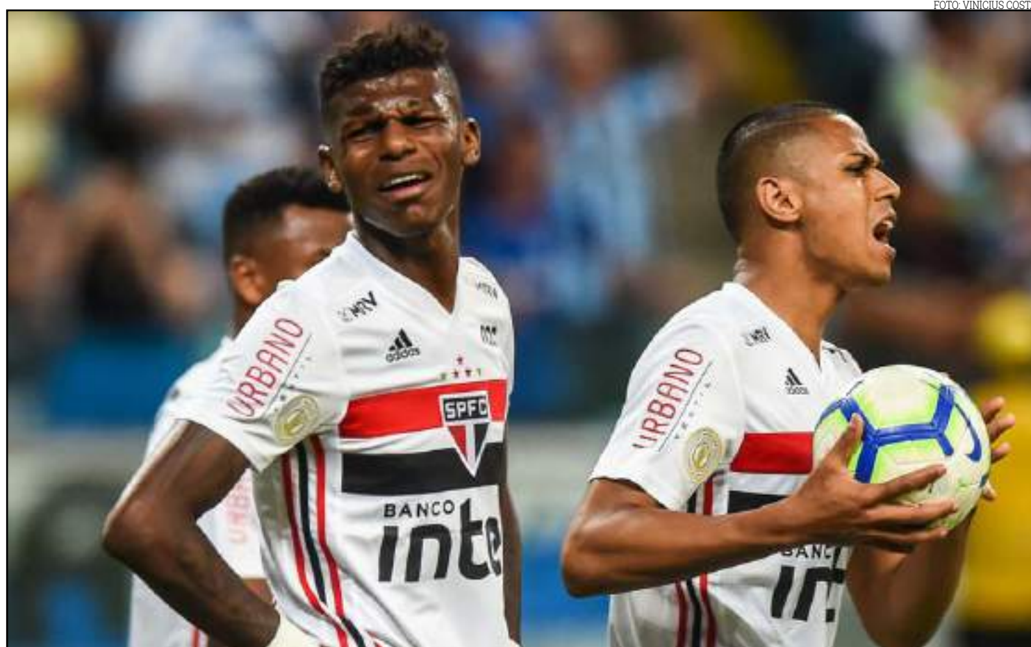
Arboleda e Bruno Alves eram incontestáveis na zaga do São Paulo

“O Hernanes estava aqui conosco, ele foi relacionado para o jogo passado, hoje não achei que era um jogo para ele entrar. Ele está cada vez melhor e pode passar a jogar em qualquer