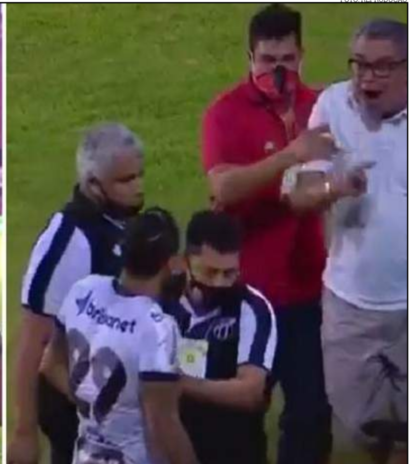
Árbitro relata invasão de campo e ameaças do presidente do Vitória