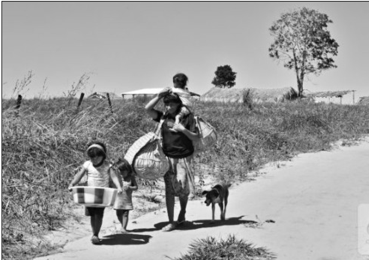
Indígenas em situação de abandono diante da pandemia

Liliane viajou os 500 quilômetros em estrada