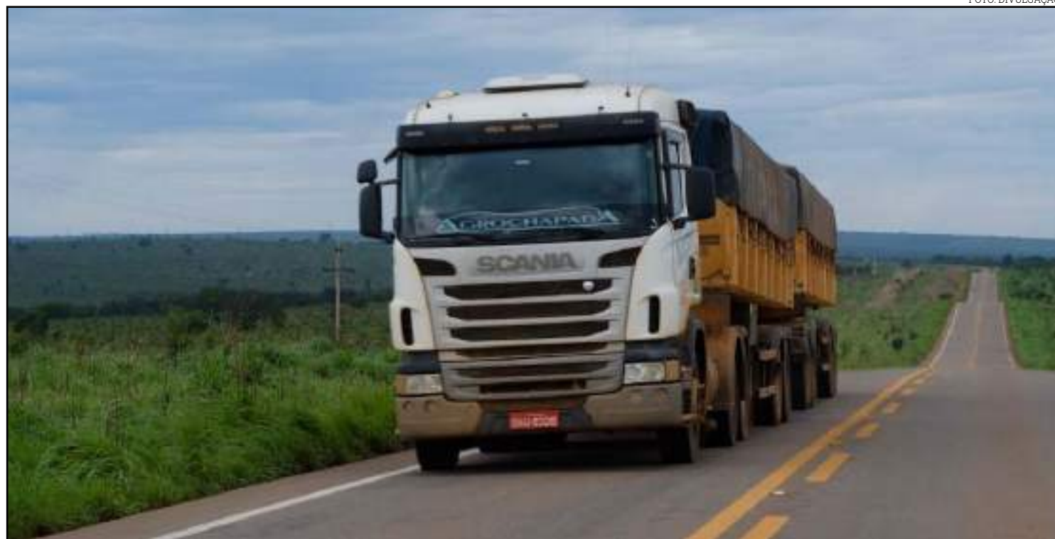
Pavimentação da BR-163 facilitou tráfego de caminhões

"A partir do início das operações das estações de transbordo de cargas em Miritituba, nós começamos a aumentar o envio para lá de volumes que antes eram escoados para Santos-SP e Paranaguá-PR, o que ficou mais intenso com a conclusão da BR-163. Estamos lutando para que se mantenha a qualidade do pavimento com condição de trafegabilidade, já que isso reduz significativamente o valor do frete. Com isso, aumenta o interesse de escoar pelo arco norte. Eu sempre afirmo que os volumes