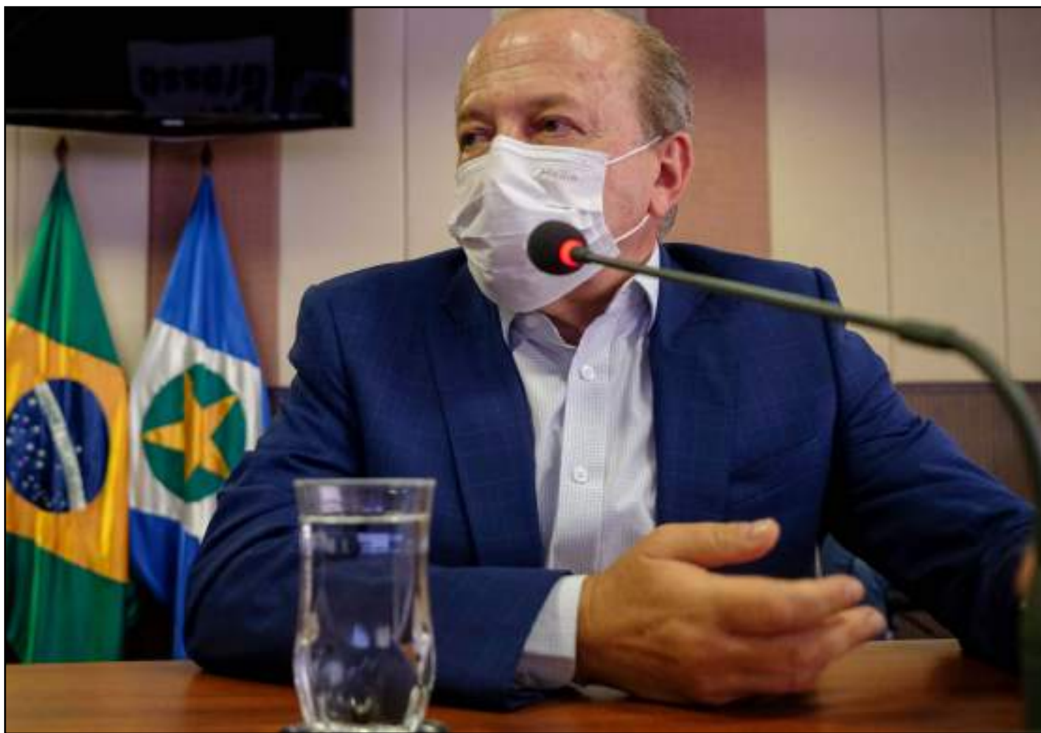
Pivetta deve apoiar agora o tucano Nilson Leitão

Já o grupo que havia, em fevereiro, alçado o nome de Pivetta para disputa não deve apoiar nem Fávaro e nem Leitão, o grupo deve apoiar o deputado estadual Max Russi (PSB), para a disputa ao Senado.