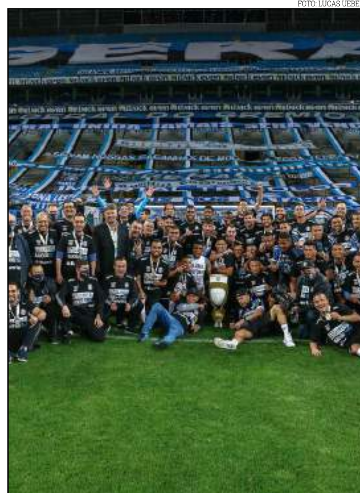
Jogadores, comissão e funcionários comemoram título gaúcho

bém precisamos tentar entender as fraquezas de hoje e ter certeza de que estamos lidando com elas".