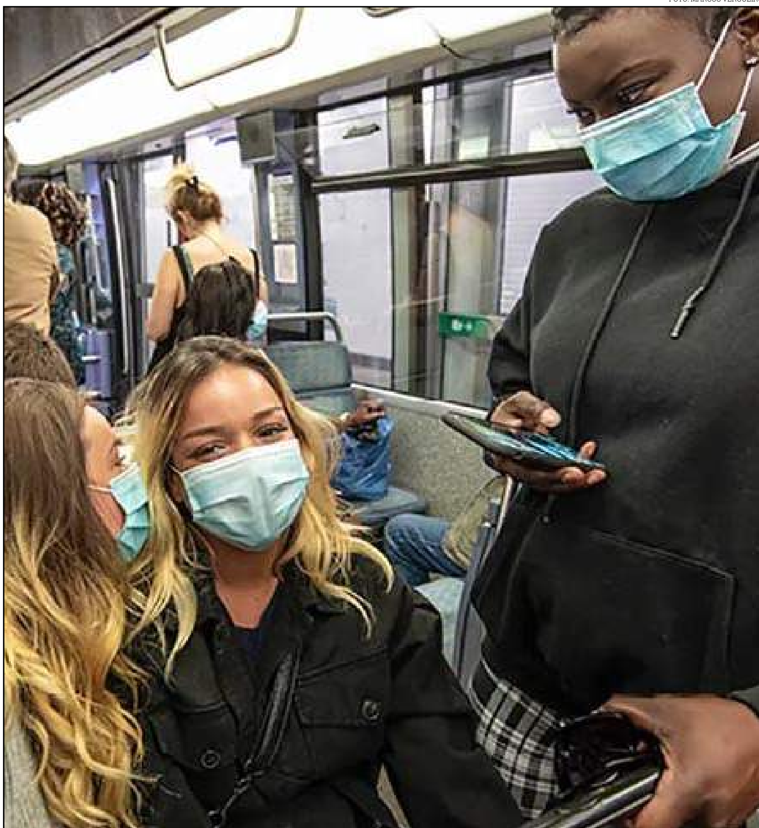
Tempo que se gastava em deslocamento foi alterado

O maior impacto deverá continuar na redução do congestionamento nas cidades em função dos veículos particulares. Mesmo nas grandes capitais, após a retomada das atividades, o volume de veículos a circular volta a subir, mas com a incorporação do home office, que deve aconte-