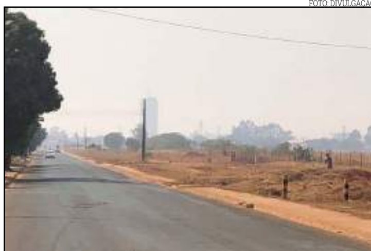
Fumaça cobriu parte da cidade na última terça

As temperaturas para essa semana devem ser superiores a 35°C, podendo chegar até 38°C na quinta-feira. Não há previsão de chuva para os próximos dias. A orientação médica é manter-se hidratado, fazendo ingestão de líquidos e umidificando o ambiente.