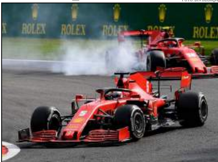
Ineficiência da unidade de potência preocupa para as próximas provas

"O motor está congelado nesta temporada, então não há nada que possamos fazer sobre isso. Estamos desenvolvendo para a próxima temporada e está progredindo bem no dinamômetro no momento. No carro há algumas restrições, então qual é o plano para nós? O plano principal é focar nas próximas temporadas - não ape-