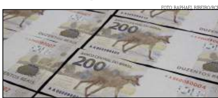
450 milhões de unidades da nota vão circular até o fim do ano

vidade do nosso país. Outras nações viveram fenômeno semelhante. Em momentos de incerteza, é natural que as pessoas busquem a garantia de uma reserva em dinheiro", afirmou, durante o discurso de lançamento do novo modelo. A cédula de R$ 200 traz cores cinza e sépia predominantes e homenageia o lobo-guará, animal típico da fauna do cerrado brasileiro, e atualmente ameaçado de extinção. A nota tem o mesmo formato e dimensões da cédula de R$ 20 (14,2cm x 6,5cm). A decisão de manter o formato, segundo o BC, é para melhor adaptação aos caixas eletrônicos e demais equipamentos automáticos que aceitam e fornecem cédulas de dinheiro. "O Banco Central tem atuado durante todos estes meses e tem conseguido fornecer cédulas e moedas de modo a atender às necessidades da sociedade de forma adequada. Ainda