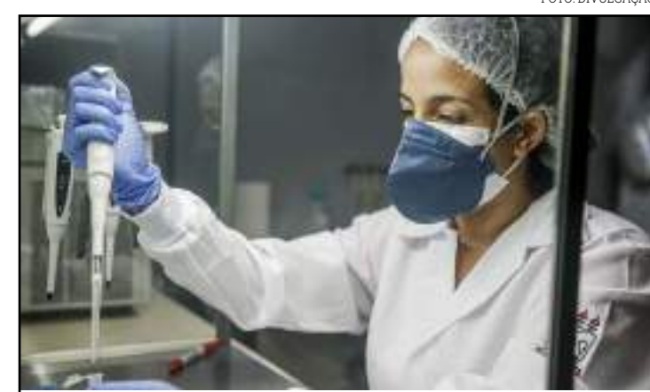
Entre 1º de agosto e 1º de setembro, 961 pessoas morreram