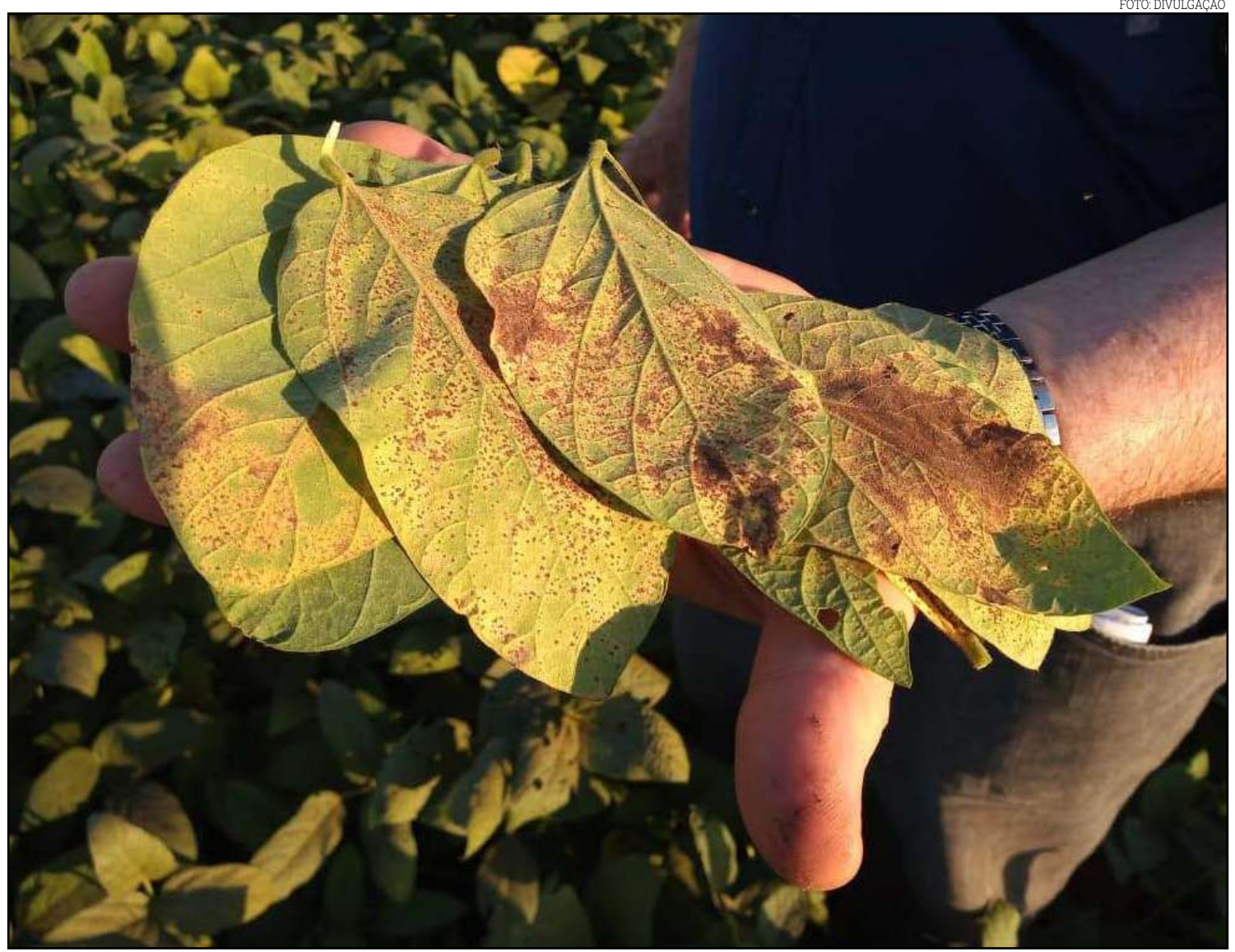
Plantio em Tocantins pode trazer consequências para Mato Grosso

“A discussão é sobre a propagação. Mas não há tempo hábil para a propagação, diz o relatório apresentado pela Agência de Defesa, justamente por causa dessa inundação. Então há um controle com relação a esse processo para que não haja nenhuma possibilidade de transmissão da ferrugem”, afirma Dourado.