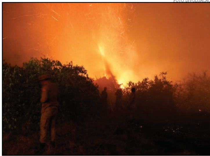
Incêndios consomem vegetação da Serra do Parecis

O dano ambiental é enorme e os fazendeiros também começam a sentir os prejuízos na agropecuária, porque o fogo já atingiu áreas de pastagem. Segundo o Corpo de Bombeiros, ainda não é possível saber o tamanho da área queimada, mas o incêndio já atingiu dois biomas: o Cerrado e a Amazônia.