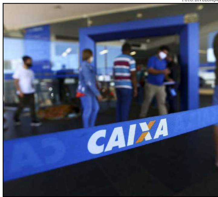
Cerca de 734 mil trabalhadores da iniciativa privada podem sacar

O fechamento do calendário de pagamento do exercício 2020/2021 será no dia 30 de junho de 2021.