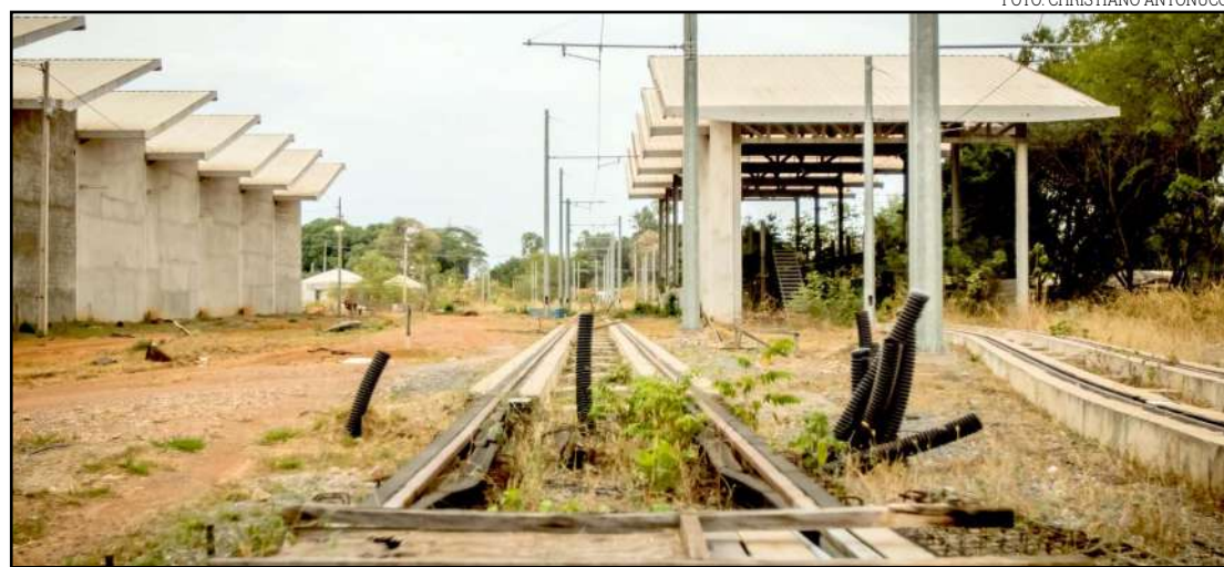
Obra era para estar pronta em 2014 para a Copa do Mundo

“Gostariamos de já ter resolvido isso. É um problema