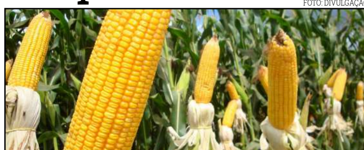
Houve baixa de 3,69% até dia 11 de setembro

Porém, especificamente no fim da semana passada, os valores subiram, devido à retração dos produtores, que estiveram resistentes nas negociações envolvendo grandes lotes. No campo, produtores brasileiros voltam a ficar atentos ao clima, tendo em vista que o tempo seco pode dificultar o se-