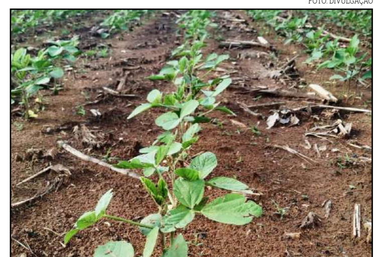
A partir de hoje, produtores podem plantar soja