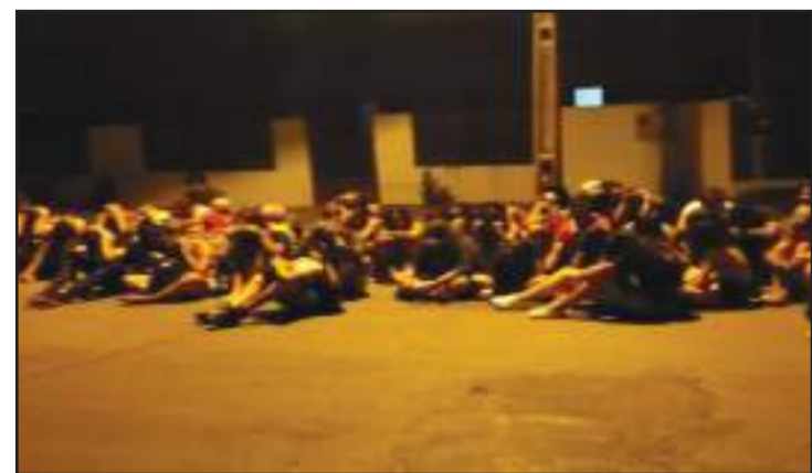
Festa tinha participação de 120 pessoas em Nova Mutum