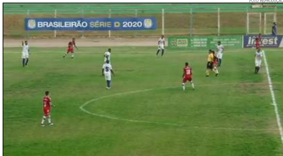
Galo do Norte foi derrotado pelo River-PI no Gigante do