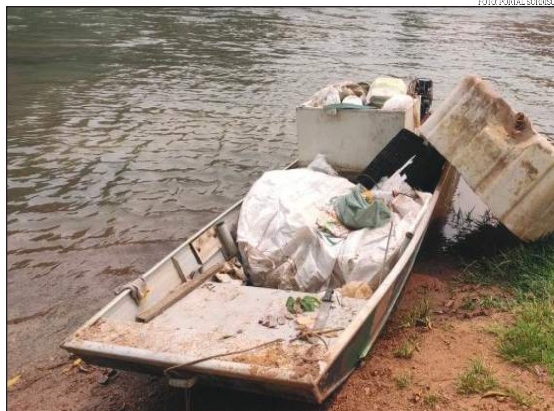
Rotary Clube realizou limpeza no Rio Lira

Mas, não diferente dos anos anteriores, os membros do Rotary encontraram uma grande quantidade de lixo descartado no rio, de onde foi retirado até mesmo um