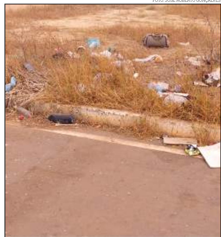
Garrafas plásticas e até uma bolsa são encontrados na rua

É importante não generalizar, afinal, nem sempre a educação que se aprende em casa é aplicada fora dela. Não se pode culpar os pais, que por vezes não têm culpa nesse processo. Mas vale, sim, o puxão de orelha aos animais ditos racionais que jogam lixo na rua. Custa caro levar uma sacola de lixo consigo e depositar em local próprio? O reflexo de uma sociedade é a soma de atitudes de seu povo. Isso é questão de educação, algo difícil de ser compreendido por alguns indivíduos.