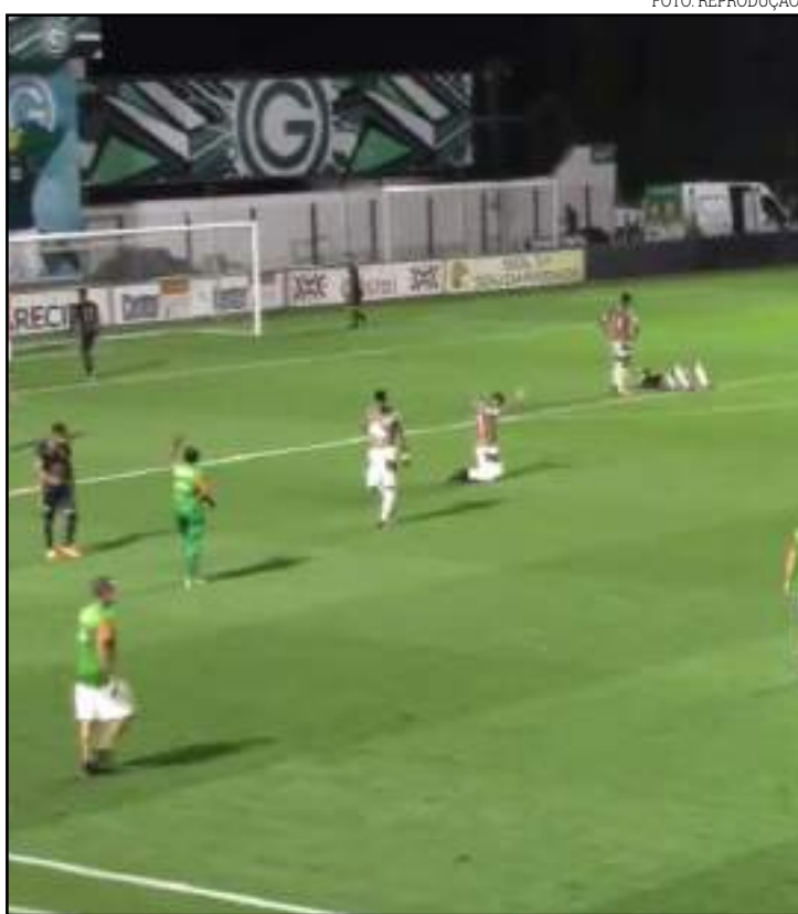
Operário surpreendeu ao estrear com vitória fora de casa

O União Rondonópolis recebeu o Águia Negra no Estádio Lutheru Lopes. A equipe foi para cima, principalmente no primeiro tempo, criando algumas oportunidades, mas não aproveitando nenhuma. Apesar da pressão, não conseguiu superar os sul-mato-grossenses. Na próxima rodada, o União visita o Goiânia/GO, no sábado (26), no Estádio Olímpico.