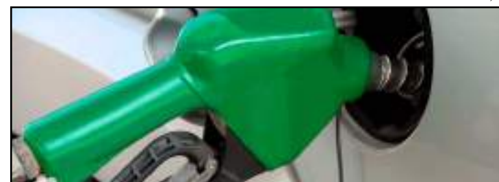
Projeto quer que estabelecimentos mantenham placas informativas