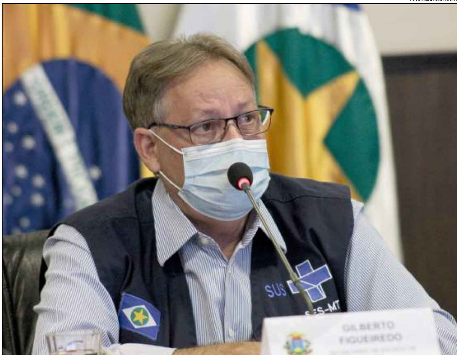
Visita ocorreu na manhã de ontem na capital do agro

“Hoje, temos 445 leitos de UTI-covid cativos, neste momento, com recursos públicos em Mato Grosso. Cada leito desses tem um custo mínimo mensal de R$ 600 mil. Temos mais leitos para covid do que para outras enfermidades. Assim como leitos de enfermaria. Temos um número substancial de leitos de enfermaria neste momento disponibilizados, livres, sem nenhum paciente. Temos 641 leitos cativos. Isso quer dizer um leito hospitalar em que a cama está vazia, mas que eu só posso utilizar para paciente covid, não posso utilizar para outro paciente”, explicou o secretário.