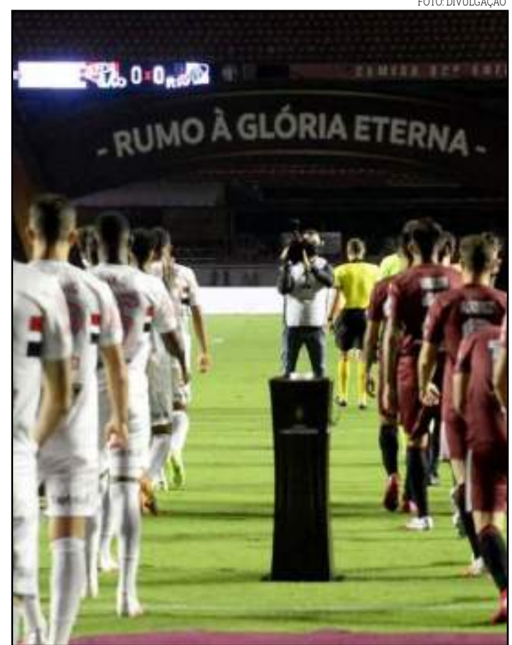
São Paulo empatou com o River em casa e precisa vencer fora

Nesta temporada, o rendimento do Tricolor em partidas fora de casa é irregular. Dos 11 jogos disputados, a equipe venceu quatro, empatou duas e perdeu outras cinco. Aproveitamento de 42,4% dos pontos conquistados. O único jogo disputado como visitante pela Libertadores foi na estreia, diante do Binacional, na altitude de Juliaca, no Peru. O Tricolor até conseguiu sair na frente com gol de Alexandre Pato, mas levou a virada e foi derrotado por 2 a 1.