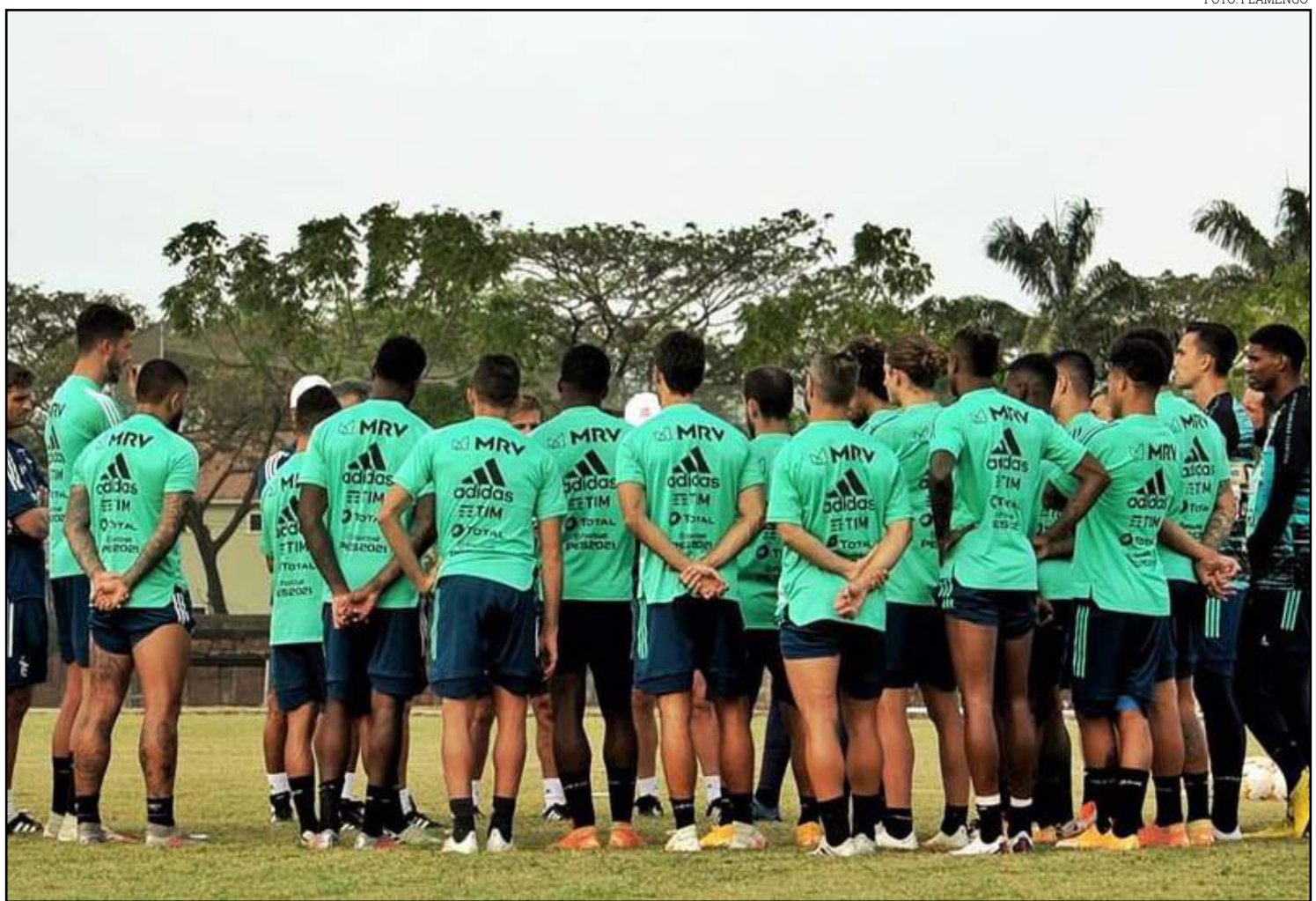
Treino do Flamengo em Guayaquil

Em outras ocasiões, Dome já utilizou Rodrigo Caio e Thuler na lateral, mas a experiência não deu um bom resultado. Outra alternativa é deslocar o canhoto Renê para direita, como foi feito contra o Santos. Neste caso, Ramon ganharia a chance de estrear em jogos de Libertadores. Há também a chance de improvisar um volante na lateral, por exemplo. No ataque, sem Gabigol e Bruno Henrique, Pedro será a principal referência. Além dele, apenas outros dois jogadores do setor estão à disposição: Vitinho e Lincoln. Se quiser deixar apenas Pedro como referência, Dome tem a opção de escalar os volantes Arão e Thiago Maia e povoar o setor de criação de meio de campo com Gerson mais adiantado ao lado de Everton Ribeiro e Arrascaeta, por exemplo. Será uma montagem de quebra-cabeça para o treinador. Sem levar em conta os possíveis atletas que podem viajar para o Equador, Dome teria no banco apenas dois go-