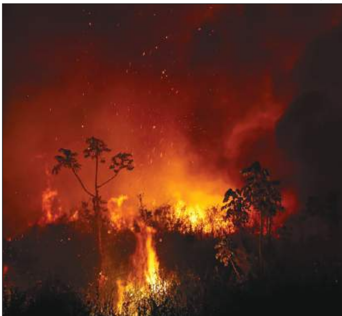
Nuvens de fumaça são vistas enquanto as árvores queimam

O fogo teve início na região de Poconé e já são mais de 1,74 milhão de hectares queimados em Mato Grosso até o dia 13 de setembro. O Pantanal já registrou o maior número de focos de incêndio, desde então. Foram 5.603 focos até o dia 16 de setembro. Apenas nos primeiros 16 dias deste mês, foram detectados 5.603 focos de calor contra 5.498 registrados no mês inteiro de setembro em 2007 - o recorde para o mês até este ano.