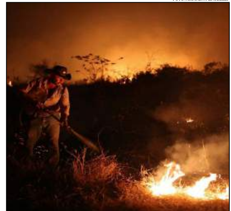
Fumaça sobe de incêndio no Pantanal em Poconé