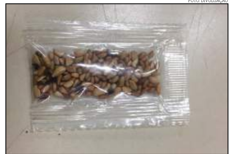
Três casos de pacotes com sementes que chegaram foram registrados pelo órgão

De acordo com o Indea, o material tem procedência e qualidade desconhecida, podendo ser um potencial veiculador de patógenos ou espécies de plantas daninhas exóticas e potenciais causadores de prejuízos econômicos à saúde vegetal. O risco é que, com o cultivo, pragas ou doenças que não existem no Brasil, possam ser introduzidas. A orientação do Ministério para quem receber esse material, é para que entregue em alguma unidade do órgão ou ainda em unidades do Indea.