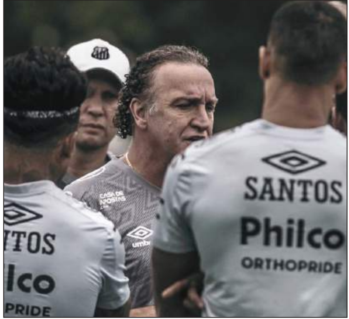
Cuca vira presidente em meio ao caos no Santos

"A vinda do Cuca trouxe grande ânimo ao elenco, que se sente protegido e amparado. Por isso ele está prestigiado. Eles vão precisar muito da liderança do professor Cuca para blindar essas questões políticas. Para um jogador como o Marinho se referir ao Cuca com presidente mostra que eles estão abandonados. Jogador gosta quando dirigente dá respaldo para eles. Infelizmente notei que eles não tinham esse respaldo, então criou-se uma certa revolta dos jo-