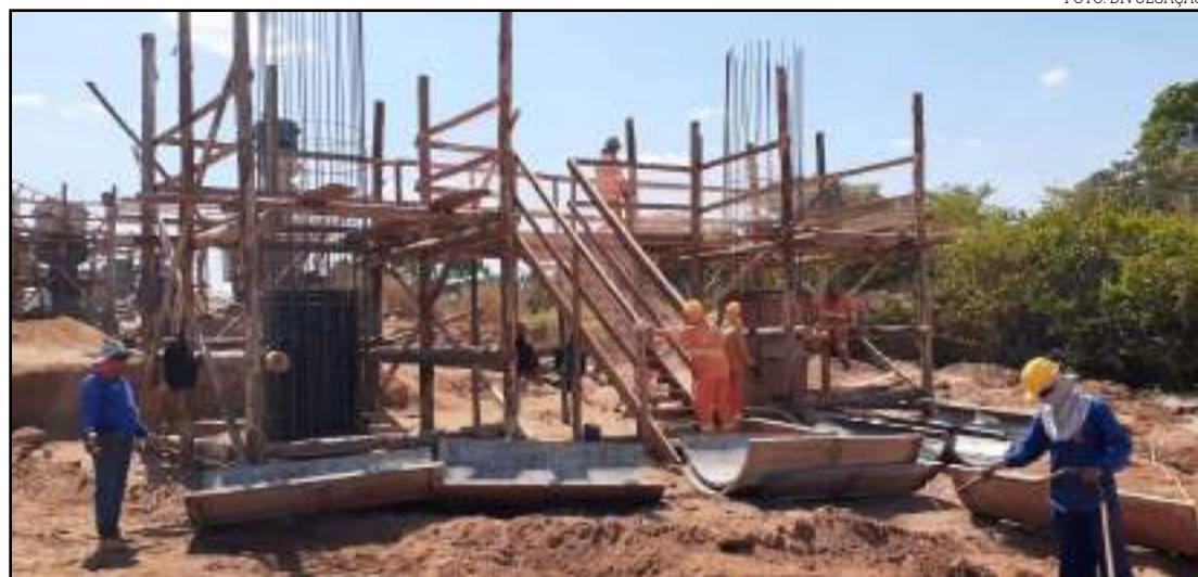
Começam a aparecer as primeiras estruturas da fundação da ponte

A ponte sobre o Rio das Mortes terá 483,60 metros de extensão, e quando finalizada, será a maior ponte de Mato Grosso. O investimento será de R$ 52 milhões. Segundo a Sinfra/MT, a empresa prevê a construção da ponte em cerca de dois anos.