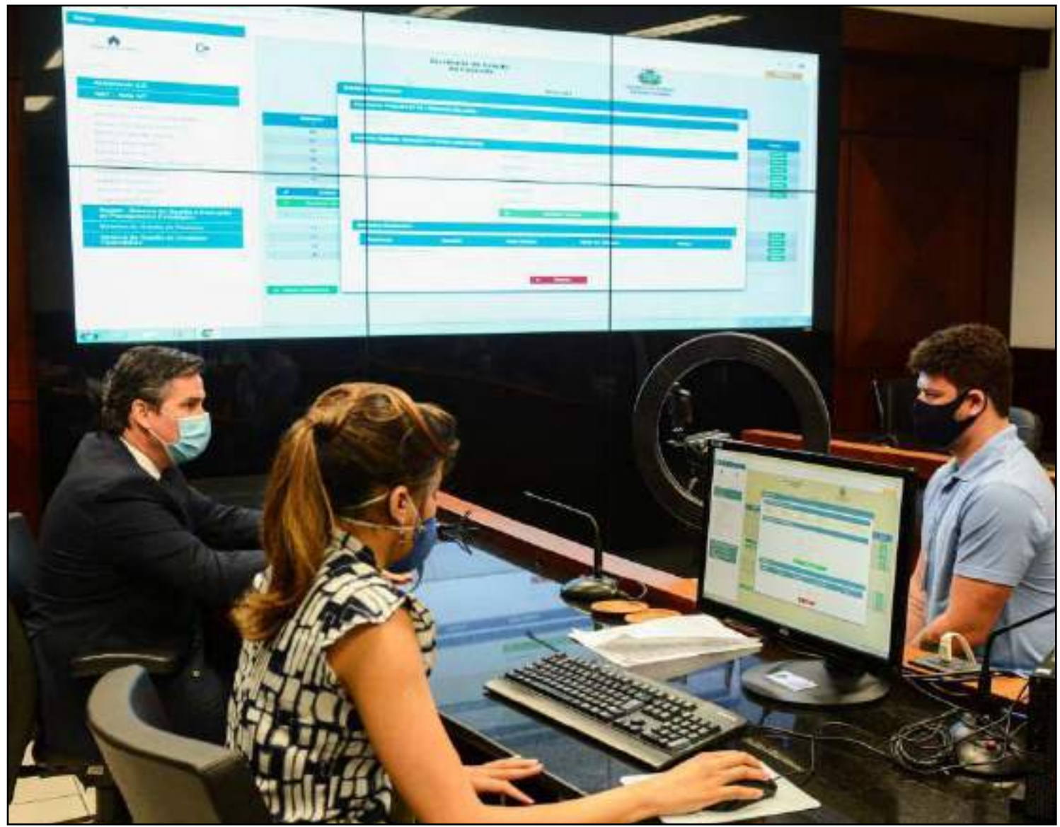
Próximo sorteio será realizado no dia 15 de outubro

Pode participar do Programa Nota MT qualquer cidadão, regularmente inscrito no Cadastro de Pessoas Físicas da Receita Federal, que tenha adquirido mercadoria, como consumidor final, ou passagem rodoviária. Os estabelecimentos comerciais deverão informar aos adquirentes, no ato da emissão da NFC-e ou NF-e e do BP-e, a necessidade de inclusão do CPF para participar dos sorteios. Aqueles que ainda não participam do Programa Nota MT e querem concorrer aos prêmios precisam fazer, antes de tudo, um cadastro. Para se cadastrar basta instalar o aplicativo no seu celular ou acessar o site, escolher a opção "criar conta" e informar os dados solicitados. Na primeira etapa as