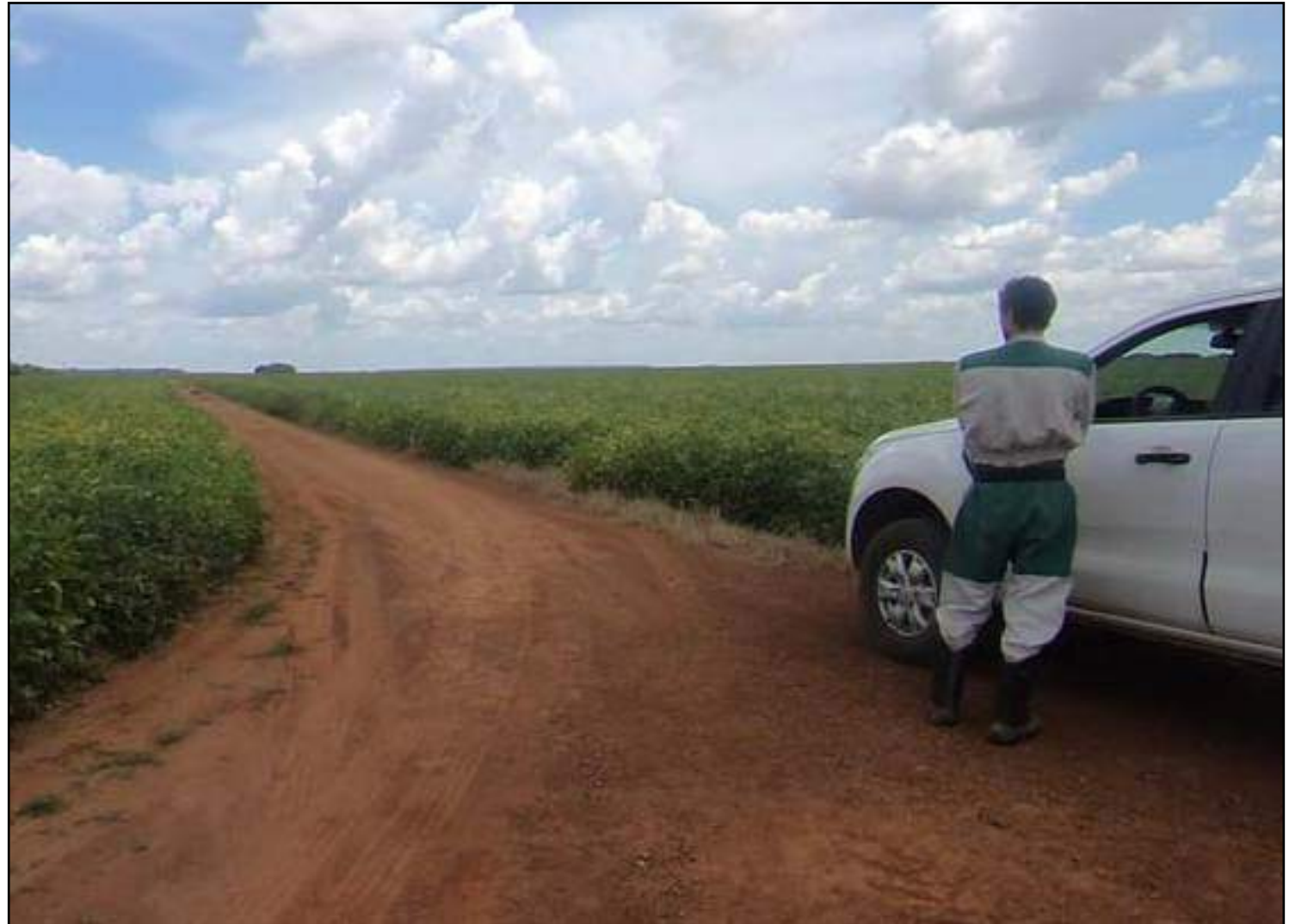
Traçado de ferrovia passa por Lucas do Rio Verde

O Ibama estabeleceu uma série de demandas, contidas no Plano Básico