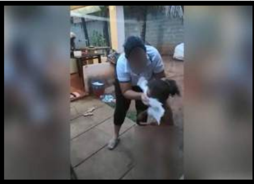
Uma mulher suspeita de maus-tratos contra a filha de um ano e nove meses foi presa em flagrante pela Polícia Civil em Ribeirão Cascalheira. A prisão ocorreu após o Conselho Tutelar acionar a equipe da Polícia Civil informando sobre um vídeo que mostrava a mulher agredindo a filha com uma vara e em seguida esfregando uma fralda suja no rosto da criança. A suspeita, 27 anos, foi autuada pelos crimes de maus-tratos qualificado e lesão corporal no âmbito da violência doméstica e também será investigada por possível tortura contra a criança.