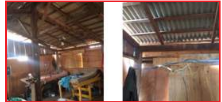
Local foi encontrado em condições precárias em Tangará da Serra