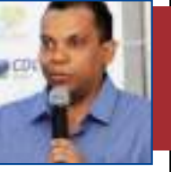
Por Clemerson Mendes