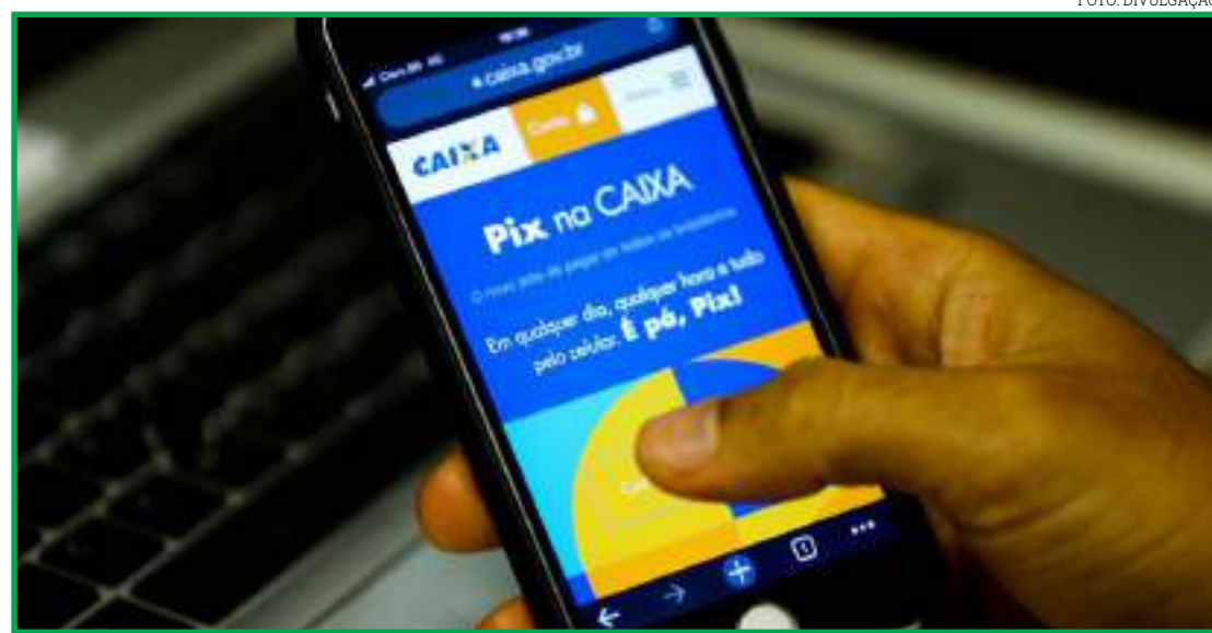
Bancos, financeiras, fintechs poderão oferecer novo sistema

sidade das instituições que estão aptas a ofertar o Pix reforçam o caráter aberto e universal do arranjo de pagamento, evidenciam a grande