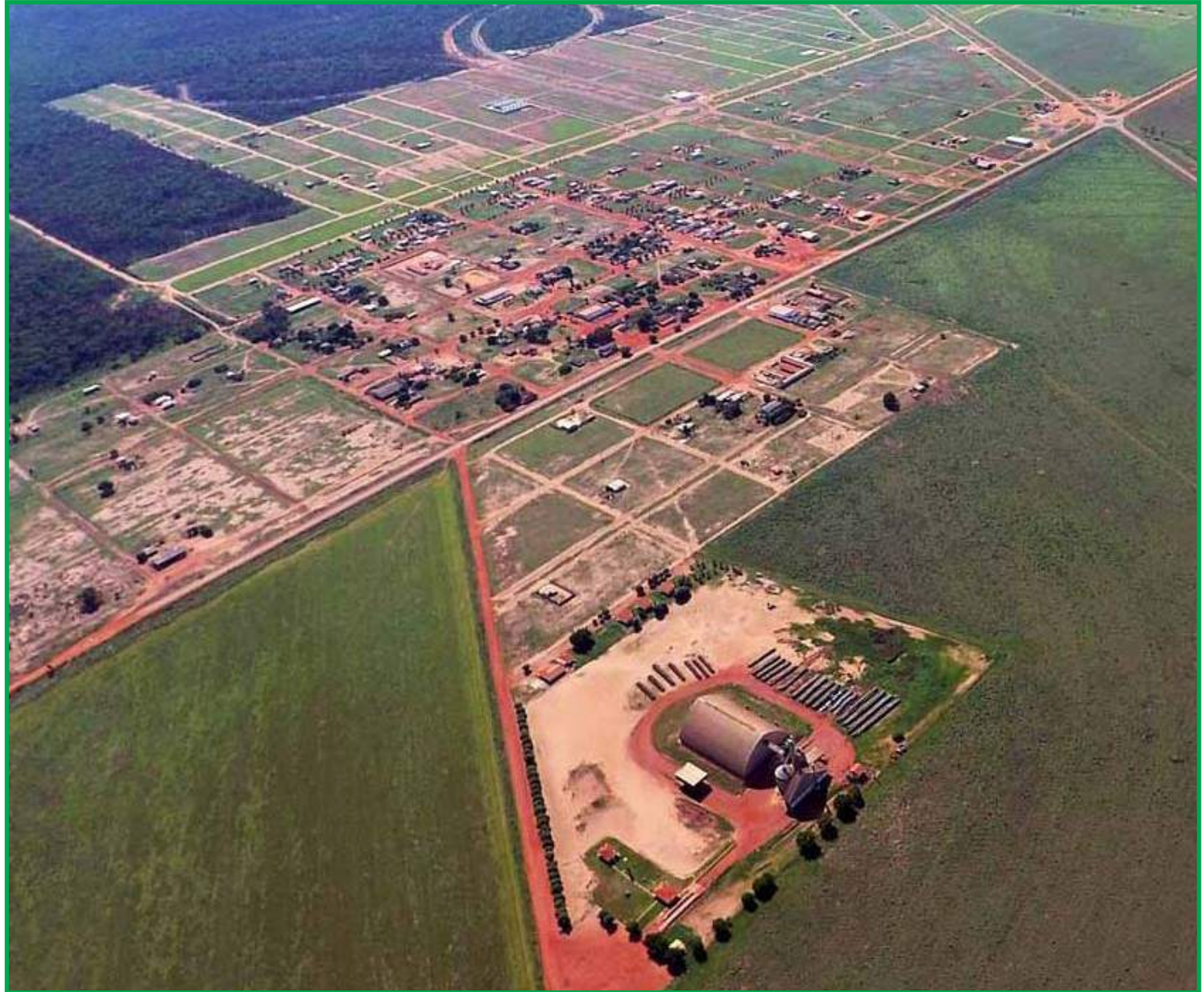
Santiago tem expandido no setor agropecuário

Ele observa que Santiago do Norte é uma fronteira agrícola em franca expansão. "Se os governos continuarem promovendo investimentos, a região vai crescer e Santiago se tornará uma cidade muito em breve", finalizou.