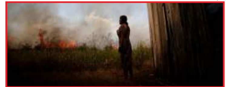
Decisão ocorre quase 2 meses após Salles anunciar suspensão dos trabalhos