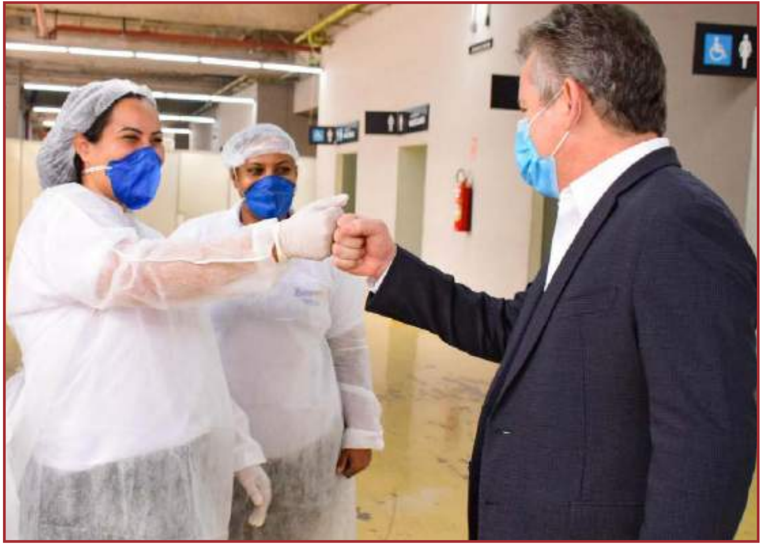
Decreto encerrou no último dia 30 de setembro

"Além de garantir que os serviços de combate à covid-19 sejam prestados com qualidade, essa prorrogação também visa valorizar os nossos profissionais que têm ajudado o Estado a salvar milhares de vidas", destacou o governador.