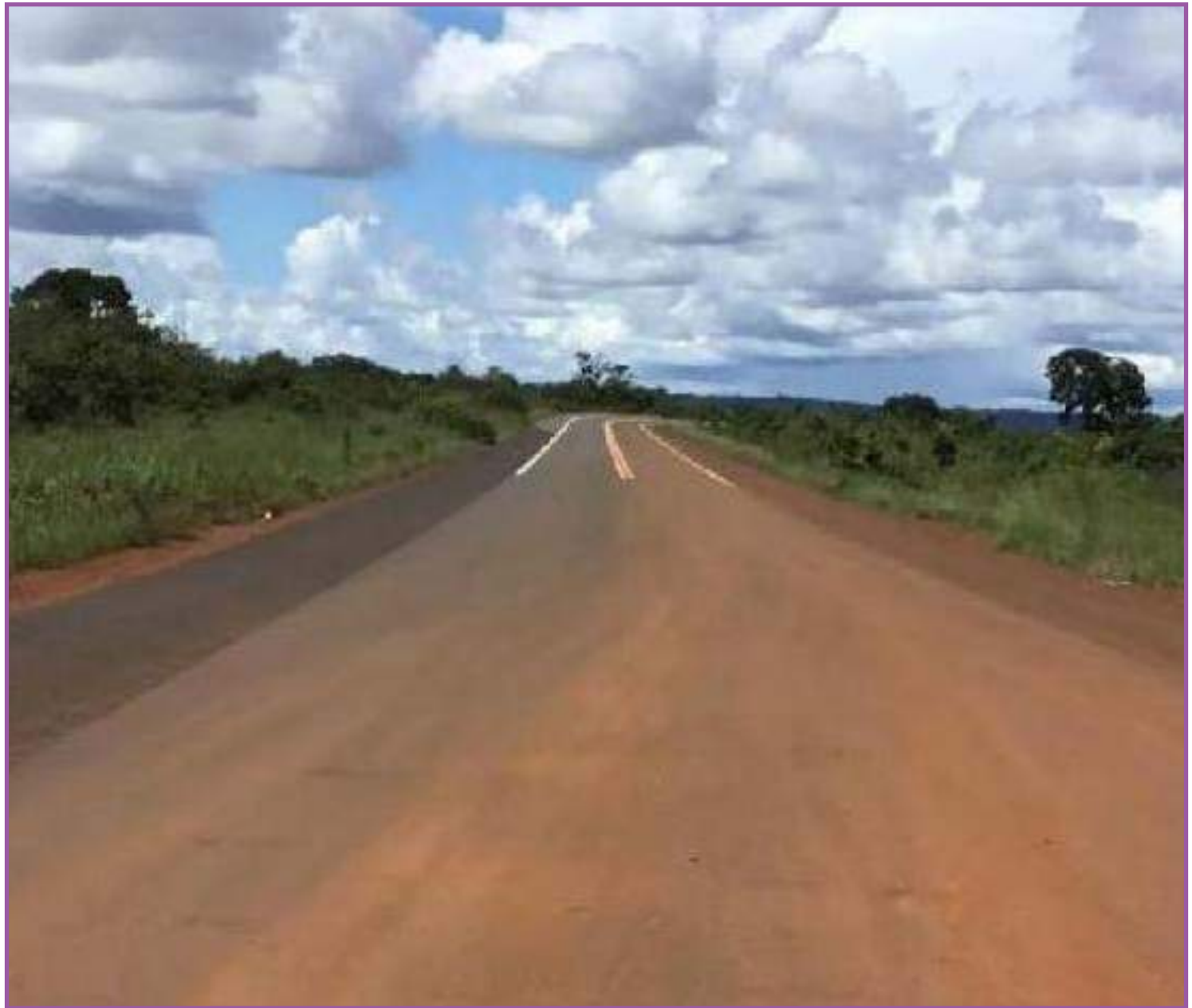
Governo assina contrato para concluir pavimentação

Também está em licitação a realização dos serviços de melhoramento em 45,4 quilômetros da MT-110 no trecho que compreen-