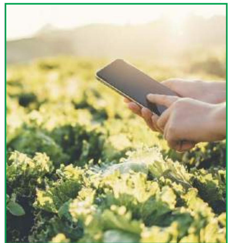
Aplicativo SISDAGRO ajudará produtores