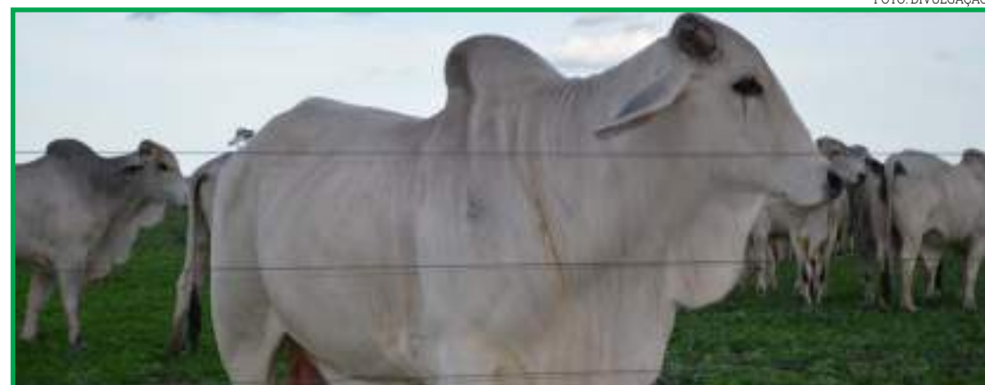
Preços estavam atrativos para dezembro

No pregão da B3 de quarta-feira, o dia foi animador e mais uma máxima foi quebrada. O contrato futuro de dezembro/20 ultrapassou a faixa dos R$ 290 por arroba, e encerrou cotado a R$ 290,45, um ga-