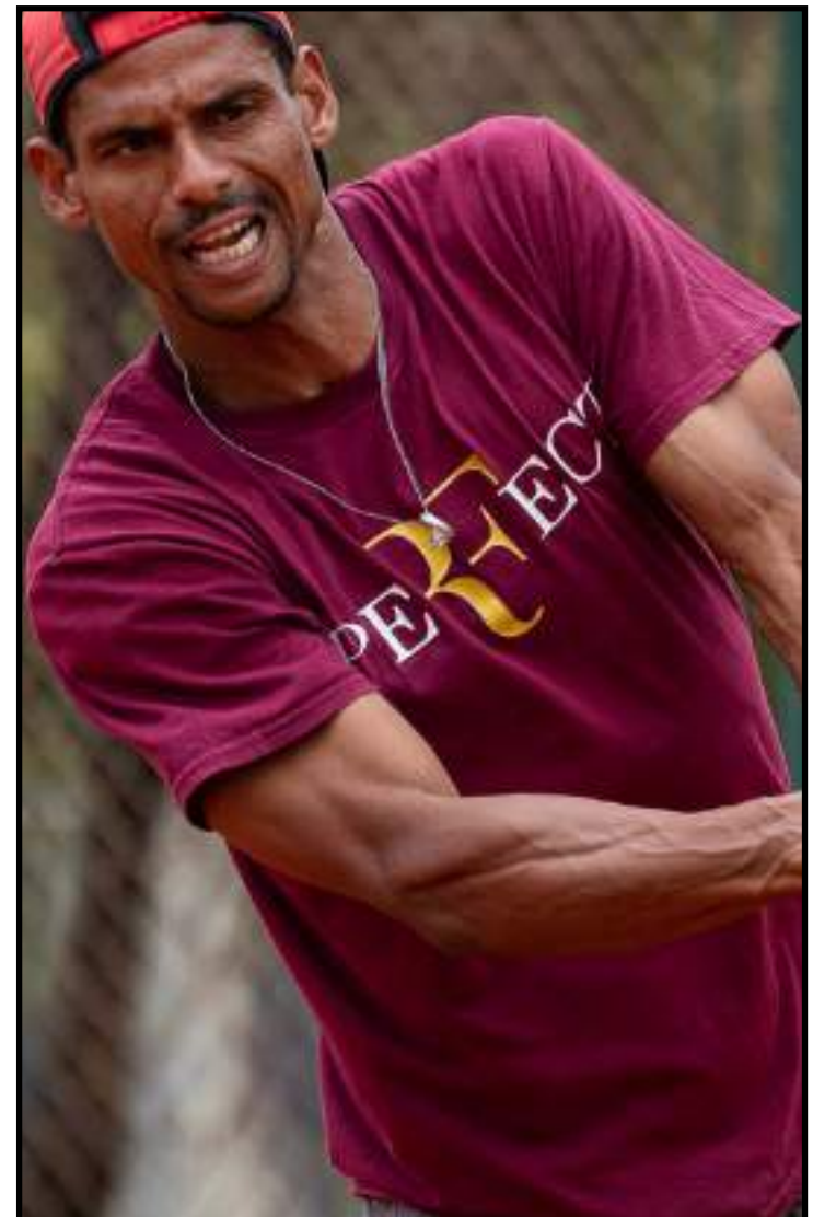
Próxima etapa será na Academia Benegas Tênis Sorriso