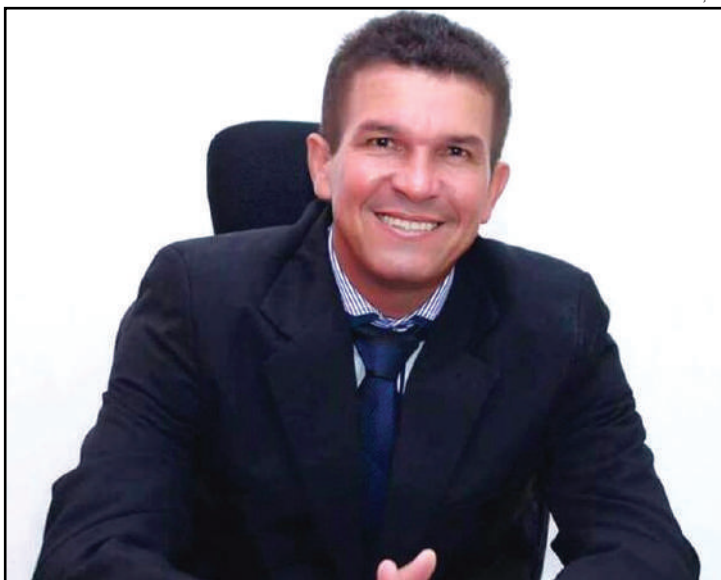
Prefeito foi preso na noite de sábado (27)