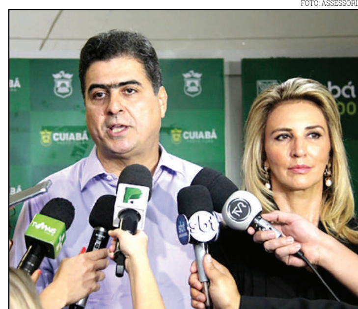
Entrevista coletiva do prefeito Emanuel Pinheiro

ou mais fiadores, que comprovem ter condições financeiras para arcar com o novo acordo.