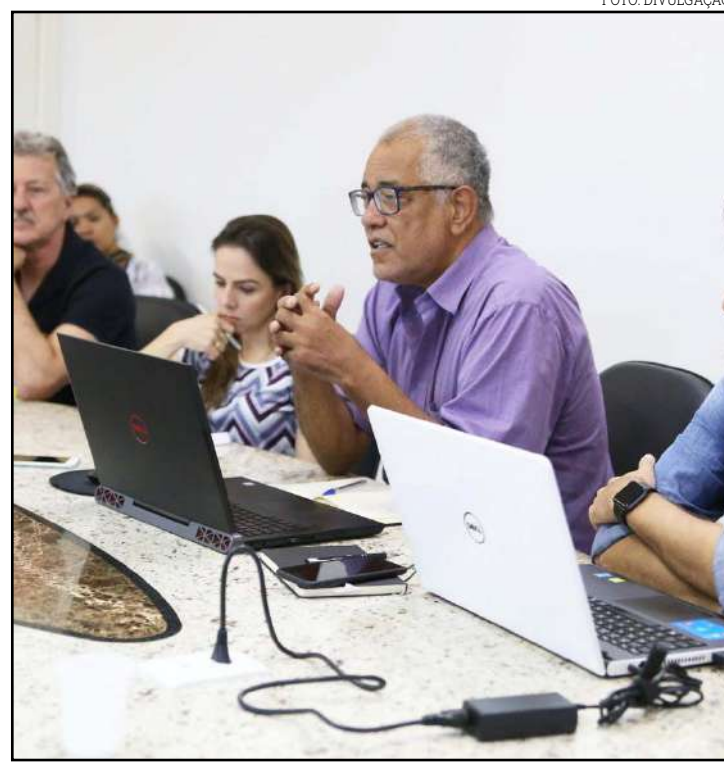
Empresa apresenta os primeiros resultados do estudo

O diagnóstico também leva em consideração a ab-