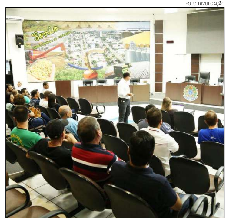
Reunião discutiu o trânsito em Sorriso