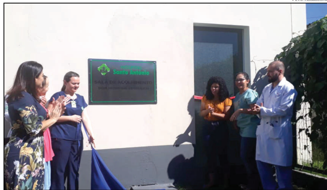
Hospital em Sinop criou espaço para acolher mães com filhos internados na UTI neonatal

“A sala é um espaço para acolher as mães com filhos internados na UTI neonatal. Acolher as mães nesse momento é um ato importante para a aproximação da mãe e de seu filho que também pode acompanhar e participar dos cuidados ofere-