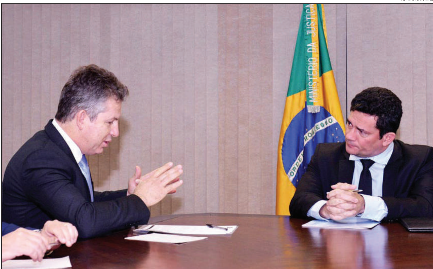
Reunião entre Mauro Mendes e Sérgio Moro

Ainda de acordo com o governador, o apoio do Governo Federal é fundamental para que seja possível ampliar a infraestrutura e melhorar as condições de trabalho de todos os policiais que atuam na região de fronteira.