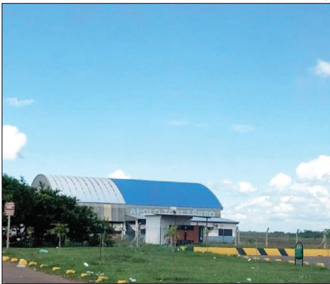
No estacionamento do aeroporto, quatro pessoas foram atingidas; uma morreu

Isso porque o local fica constantemente sujo com garrafas de bebidas alcoólicas consumidas no local, além de energéticos, copos, sacolas e latinhas.