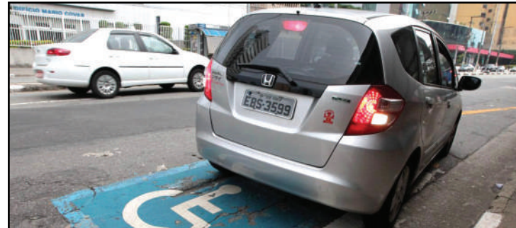
Isenção para compra de carro pode ser feita no site da Receita Federal

Isso foi possível porque Sisen utiliza bases de dados de outros órgãos públicos, como Registro Nacional de Carteira de Habilitação (Renach), o Registro Nacional