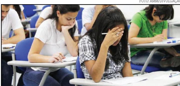
Prefeito foi preso na noite de sábado (27)

do em renegociar a dívida com o Fies deve procurar a mesma agência bancária onde fez o contrato, com um