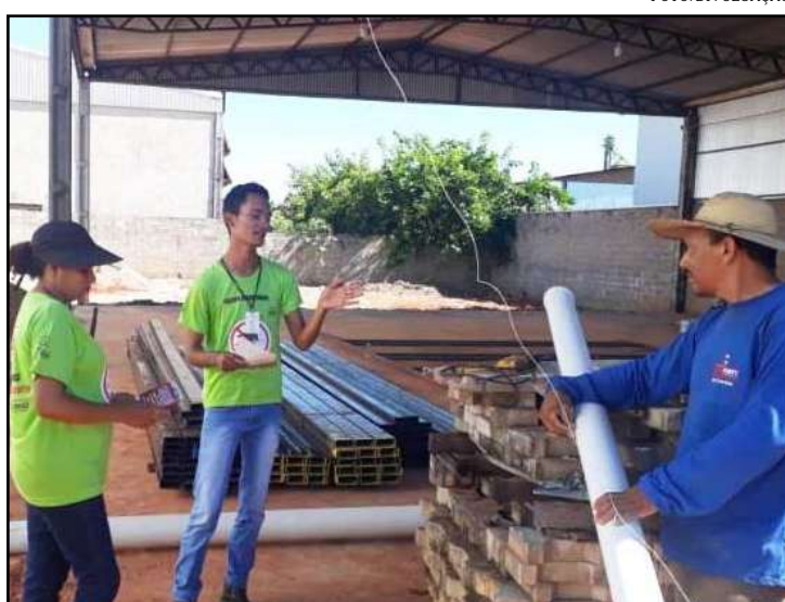
Bairros apresentam 15% de infestação

Outra região que o resultado do levantamento do índice de infestação do mosquito apresentou alto, foi