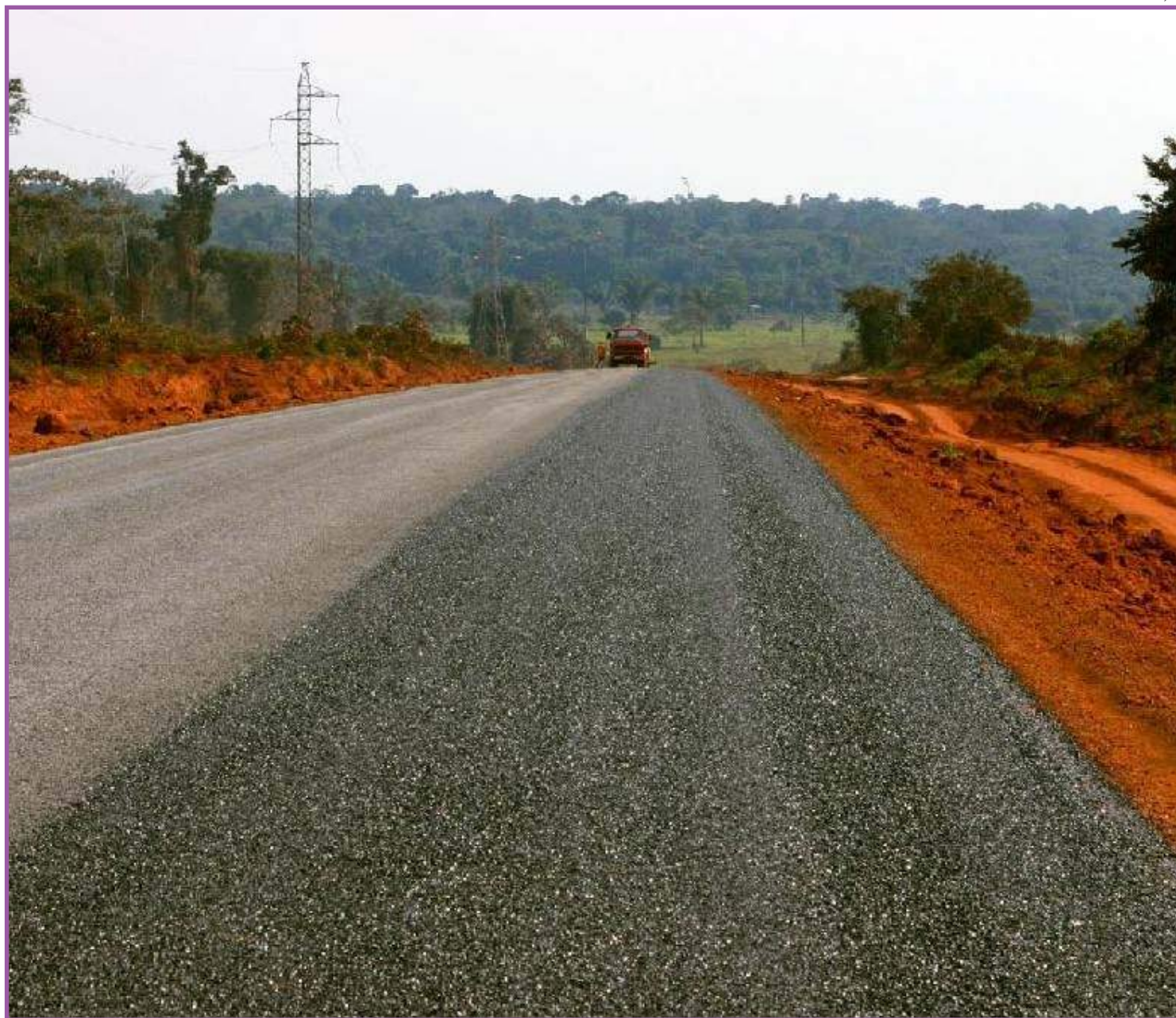
Serão aplicados R$ 920 milhões para a restauração da malha viária

O Mais MT é o maior programa de investimentos da história de Mato Grosso, que vai investir R$ 9,5 bilhões em quatro anos (2019-2022). O programa está