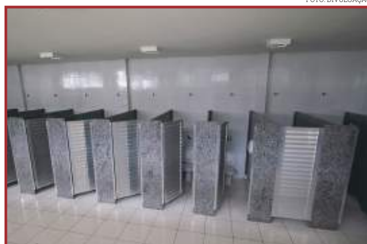
Banheiro foi construído no Parque de Exposições

Entre os pontos suspeitos também está descrita a falta de fiscalização e acompanhamento por parte da prefeitura. "A Controladoria Geral do Município verificou em inspeção in-loco realizada no dia 27/06/2018, que a obra objeto do processo licitatório já estava em estado avançado de execução antes mesmo da assinatura do Contrato nº 103/2018 e da Ordem de Início da Obra, levantando suspeitas de que a execução dos serviços já havia sido contratada verbalmente antes do procedimento licitatório", descreve