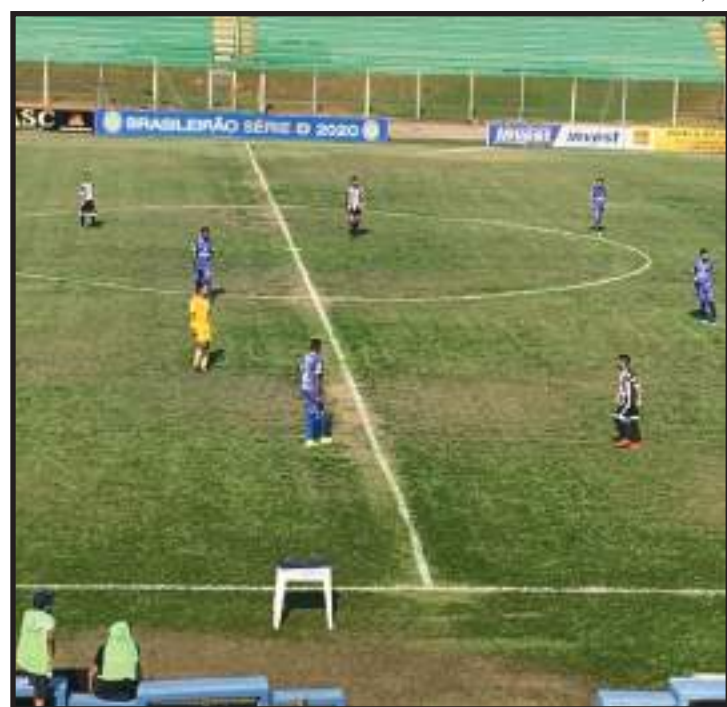
Sinop não tem mais chances de se classificar