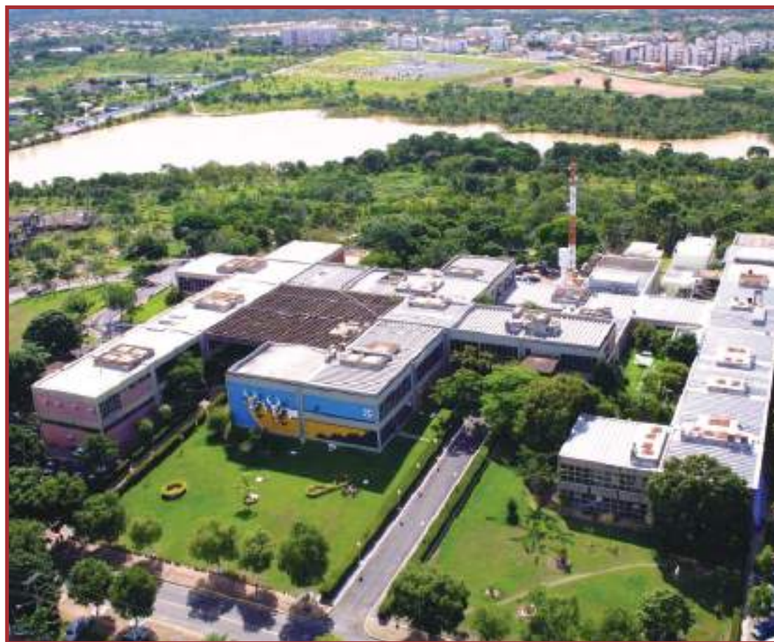
Governo pretende gerar mais economia reduzindo os gastos

acesso. Com a digitalização dos serviços, tributos e processos, otimizaremos o tempo do cidadão e do servidor. Sem papel, sem filas, é mais eficiente, seguro e célere. Realmente, um grande case de sucesso para o Governo de Mato Grosso", ressalta Basílio Bezerra.