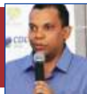
Por Clemerson Mendes