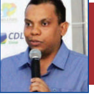
Por Clemerson Mendes