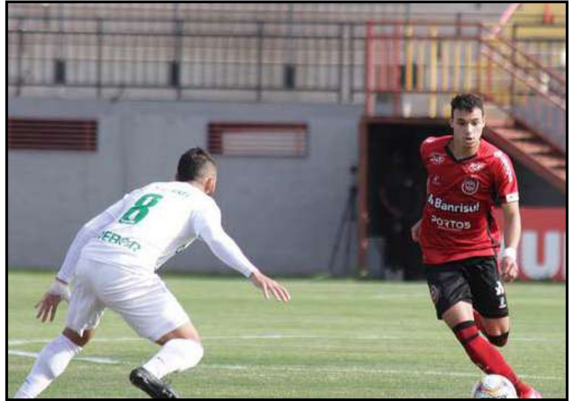
Cuiabá poupou os titulares diante do Brasil e acabou derrotado por 3 a 0

O feito também aconteceu nos últimos três anos. Em 2019, o Tricolor ganhou cinco jogos um atrás do outro na reta final do Brasileirão, entre as rodadas 28 e 32. Em 2018, encarreirou três partidas pelo Brasileirão e as duas das oitavas de final da Libertadores contra o Atlético Tucumán. Já em 2017, a marca abrangeu quatro jogos no começo da Série A e o segundo das oitavas da Copa do Brasil diante do Flu-