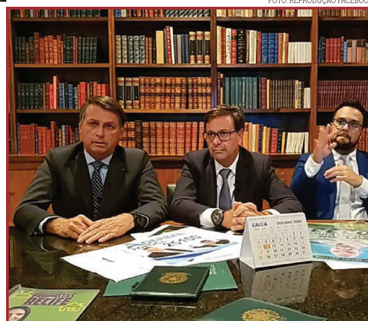
Declaração foi dada pelo presidente Bolsonaro

"Se não fosse o auxílio emergencial de R$ 600 por cinco meses e agora, até o final do ano, complemento de R$ 300, acredito que a economia nossa tinha ido para o espaço, então foi muito difícil isso porque