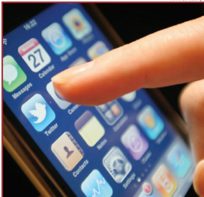
O consumidor precisa de um bom atendimento

Segundo o projeto, na hipótese de redução da velocidade de conexão à internet móvel estar em desconformidade à franquia contratada, a operadora de telefonia móvel deverá fazer a compensação no valor total do consumo, observado o período da ocorrência do dano ao consumidor, nos termos da Lei nº 8.078, de 11 de setembro de 1990 (Código de Defesa do Consumidor).