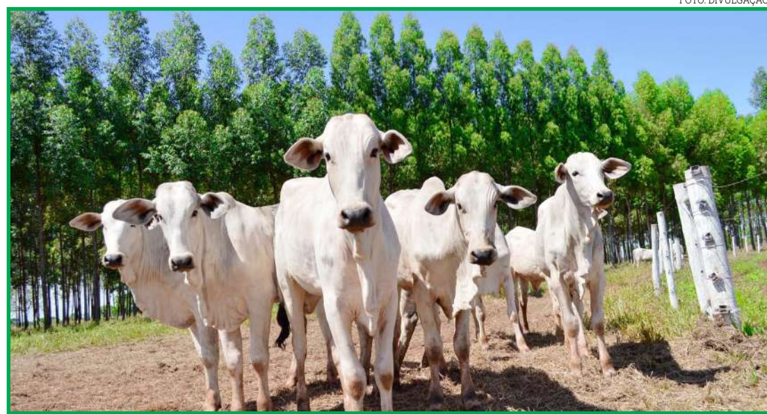
MAIOR AUMENTO FOI REGISTRADO NO SISTEMA DE RECREIA-ENGORDA

Quanto aos gastos com suplementação, os pecuaristas