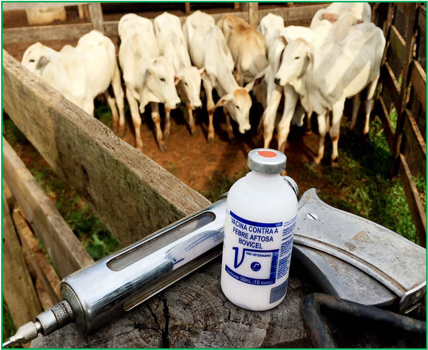
Exigência foi suspensa em instrução normativa do Ministério da Agricultura

"É preciso manter a pistola higienizada; colocá-la no gelo antes de fazer a primeira carga para já deixá-la resfriada na hora que for abastecê-la para evitar riscos de choque térmicos com a vacina; desinfetar as agulhas; trabalhar com calma; conduzir os animais com manejo racional; etc", explica o analista de pecuária da Famato. Vale lembrar que este é um compromisso que o estado assumiu e é muito importante o produtor manter a vacinação da forma correta, dentro dos prazos e com muito capricho.