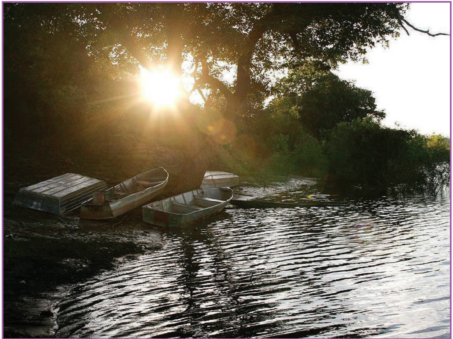
Quase 50 kg de pescado foram apreendidos

A Resolução do Conselho Estadual de Pesca (Cepesca), que determina o período de defeso da piracema nos rios de Mato Grosso, foi publicada no Diário Oficial no dia 26 de junho de 2020.