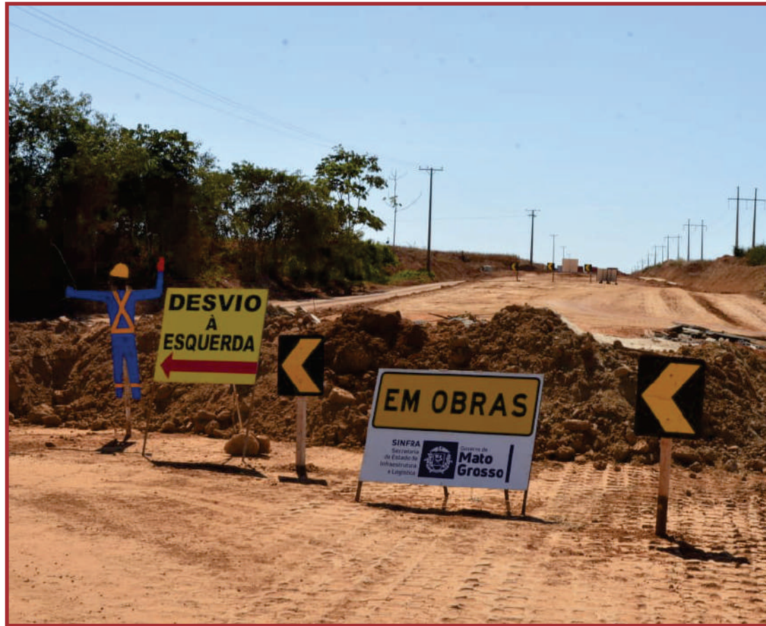
Trecho que compreende o km 17,90 até o 52,36 na rodovia MT-485