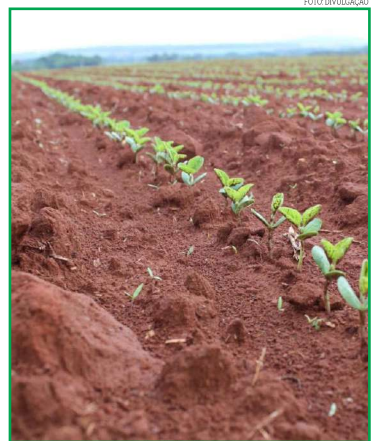
ESTIAGEM FEZ PLANTIO DE SOJA DAR UMA PAUSA

a temperatura durante a incubação e o controle da umidade da sala de armazenamento.