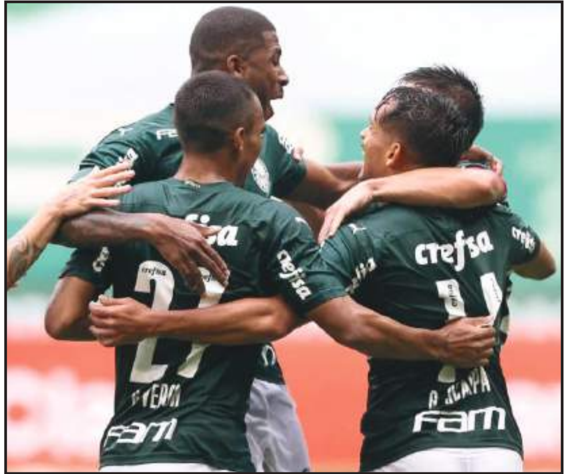
Jogadores do Palmeiras comemoram gol em vitória sobre o Ceará