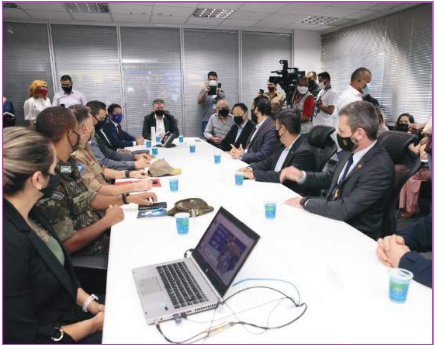
Operação Segurança atuará nos 141 municípios nas eleições de domingo

Por parte do Exército Brasileiro, a atuação será em 32 pontos, operando com oito bases e com o emprego de dois helicópteros, viaturas e embarcações. Já a Polícia Federal atuará de forma preventiva e repressiva, com ênfase na função da Polícia Judiciária Eleitoral. Ao todo, serão empregados 240 profissionais e 50 viaturas. "A Polícia Federal se sente muito honrada em fazer parte da democracia, de garantir o voto, mas é preciso dizer que a PF não atua somente na semana das eleições. Nós temos uma atuação permanente de apuração de crimes eleitorais. Para o final de semana das eleições, estamos prevendo rondas ostensivas com a ideia de diminuir a possibilidade