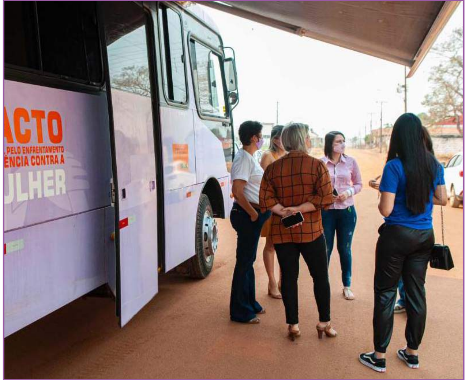
Ação em comunidades quilombola de Vila Bela da Santíssima Trindade