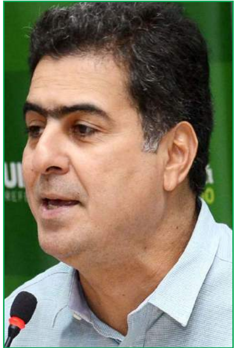
Corrido ao Alencastro está pegando fogo