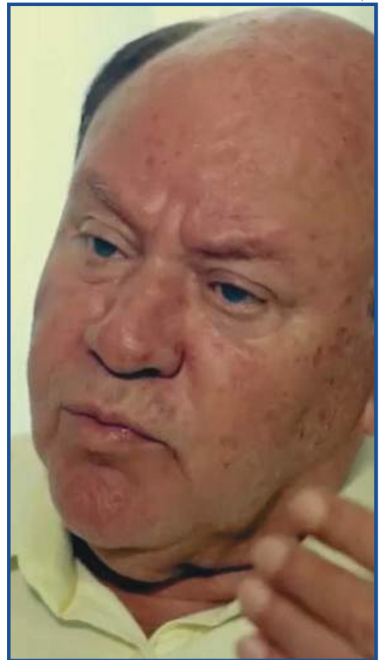
Pesquisa foi realizada entre os dias 9 e 11 de novembro