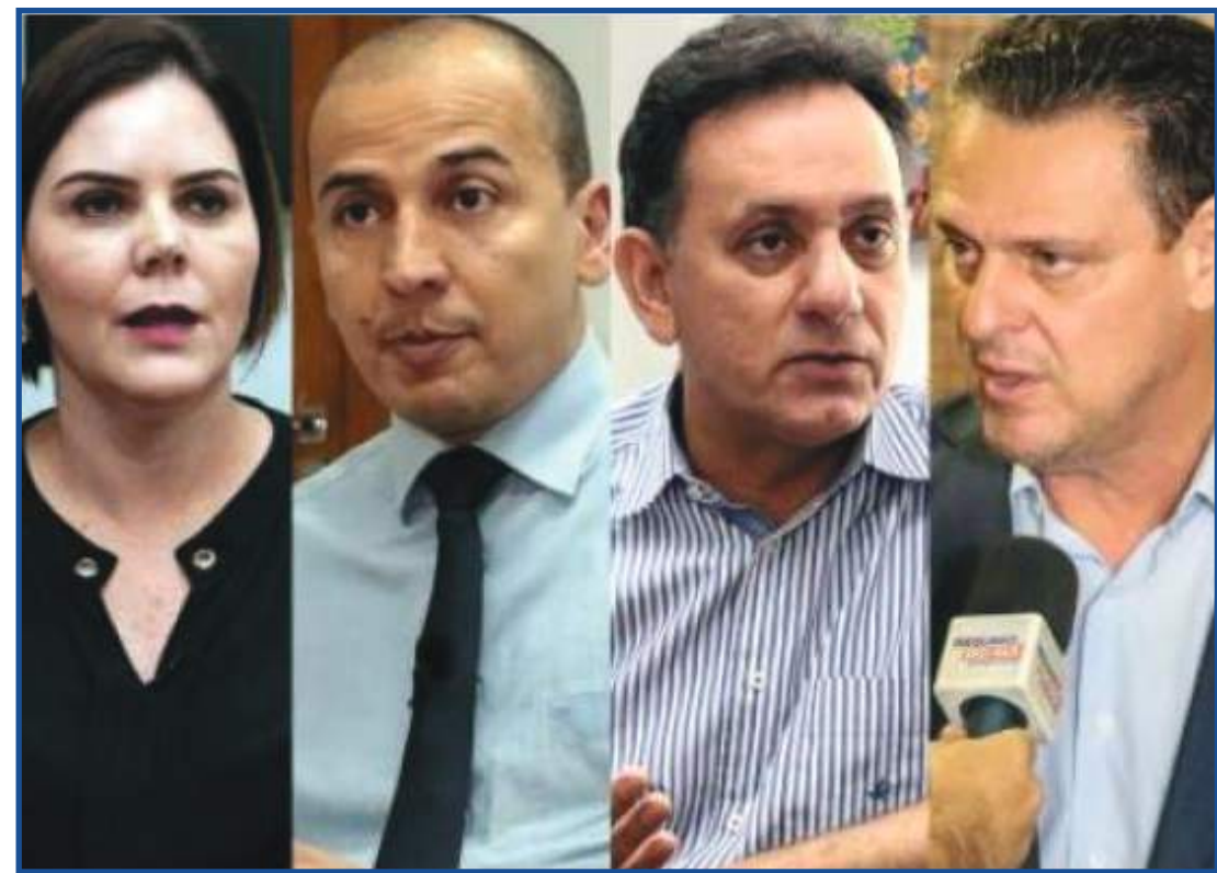
Um deles deve ficar com a vaga de Selma Arruda