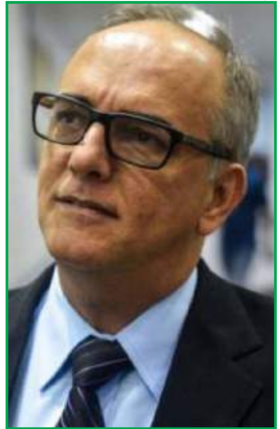
Justiça validou apenas uma pesquisa