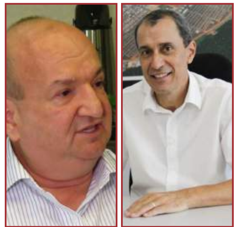
400 eleitores foram ouvidos pelo Real Dados