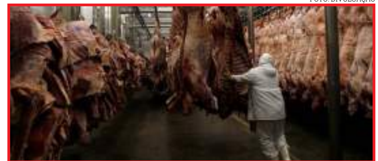
Wuhan afirma que detectou 3 amostras do vírus na parte externa de pacotes