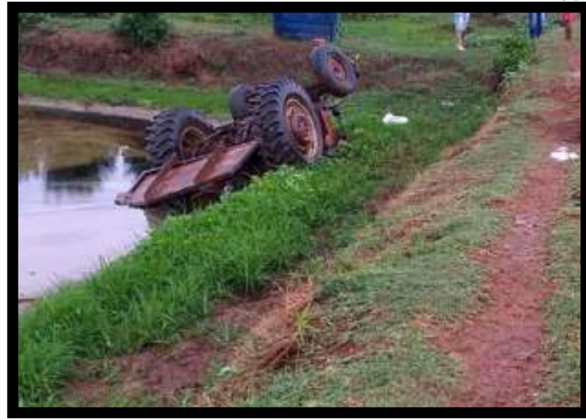
Valdomiro Martins de Sousa, 56 anos, morreu após tombar um trato em um tanque de peixes, na zona rural de Juscimeira. A fatalidade aconteceu na noite de quarta, quando ele saiu para puxar um bezerro que havia morrido por volta de 22h. Com a demora para retornar, buscas foram feitas e o corpo foi localizado preso na máquina. As polícias Civil e Militar estiveram com a Politec para fazer as análises necessárias.