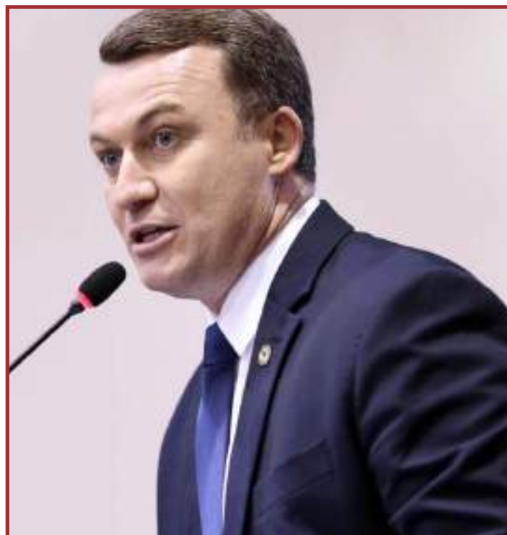
Disputa ficou polarizada entre Lafin e Xuxu