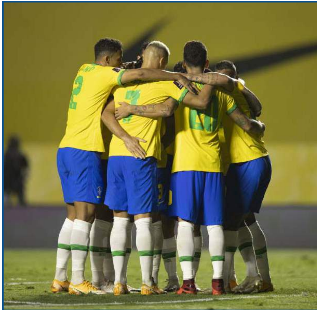
Contra a Venezuela, Brasil conquistou 3ª vitória seguida

Neste início de Eliminatórias, o Brasil venceu a Bolívia por 5 a 0, o Peru por 4 a 2 e a Venezuela por 1 a 0. Os artilheiros do Brasil até aqui são Neymar e Roberto Firmino, com três gols cada.