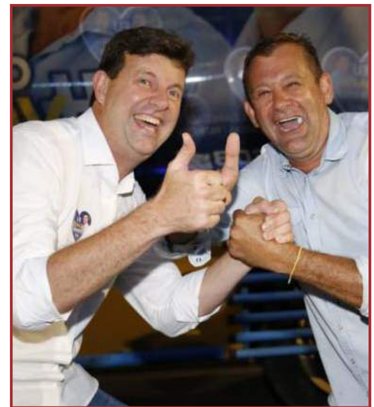
Atual prefeito venceu com folgas

foi prefeito de Lucas, em 2014. Na campanha desde ano, teve apoio do vice-governador de Mato Grosso, Otaviano Pivetta.