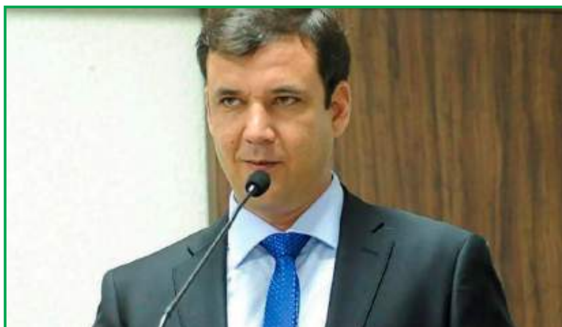
Ele era o único candidato na disputa