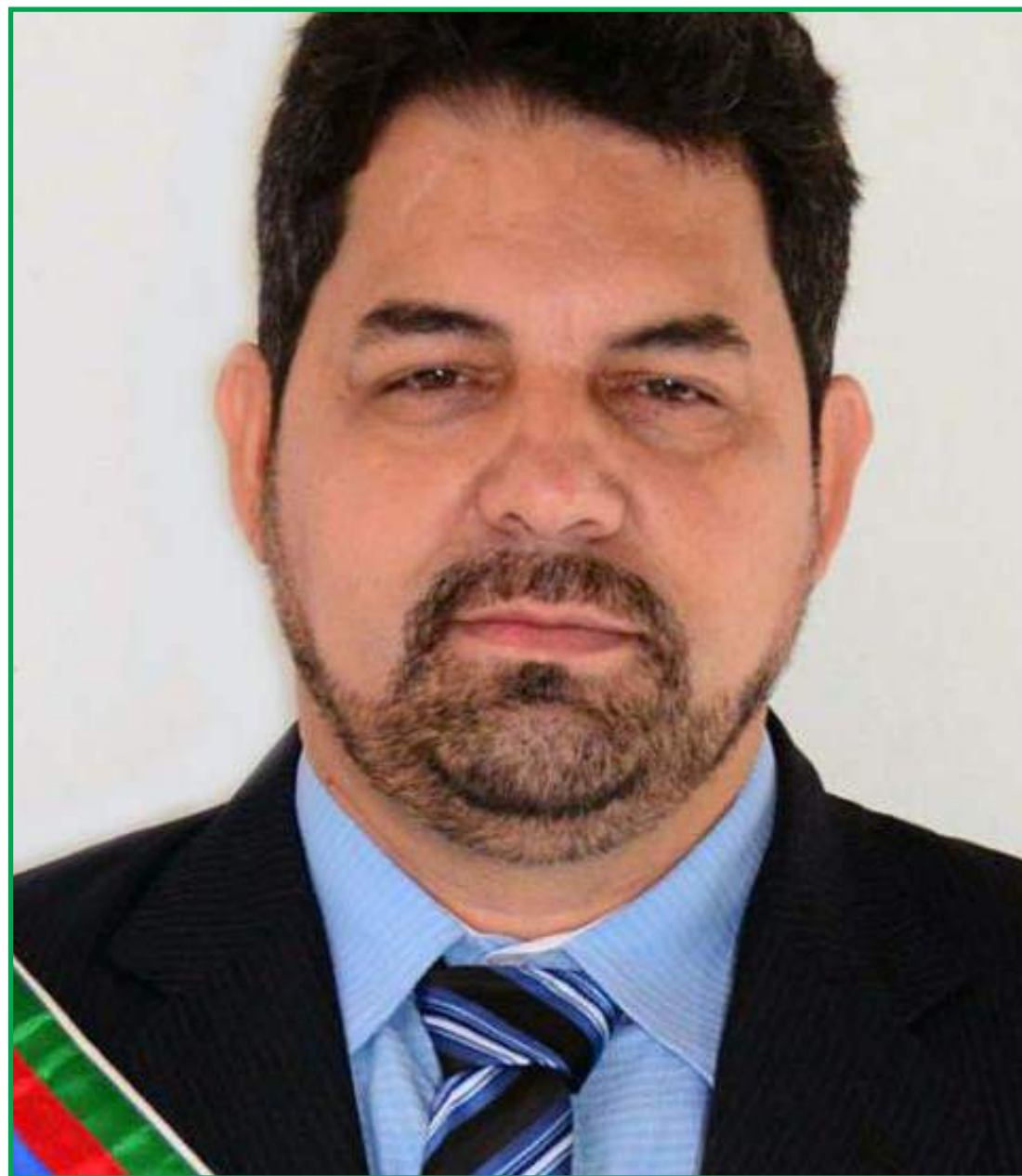
Ele era o único candidato na disputa

Em União do Sul, nove vereadores foram eleitos, Vandeco (DEM) com 352 votos (17,46%), Carlinhos (MDB) com 170 votos (8,43%), Enfermeira Talita (DEM) com 154 votos (7,64%), Silas da Rondon (DEM) com 121 (6,00%), Cesar Guergoleti (MDB) com 117 votos (5,80%), Gordo (PL) com 91 votos (4,51%), Joao Borelli (MDB) com 87 votos (4,32%), Levi (PL) com 79 (3,92%) e Chapéu (DEM) com 74 votos (3,67% 74).