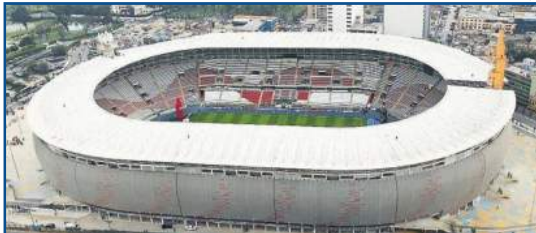
Partida está marcada para esta terça no Estádio Nacional

O Federação Peruana de Futebol recebeu garantias dos órgãos de seguran-