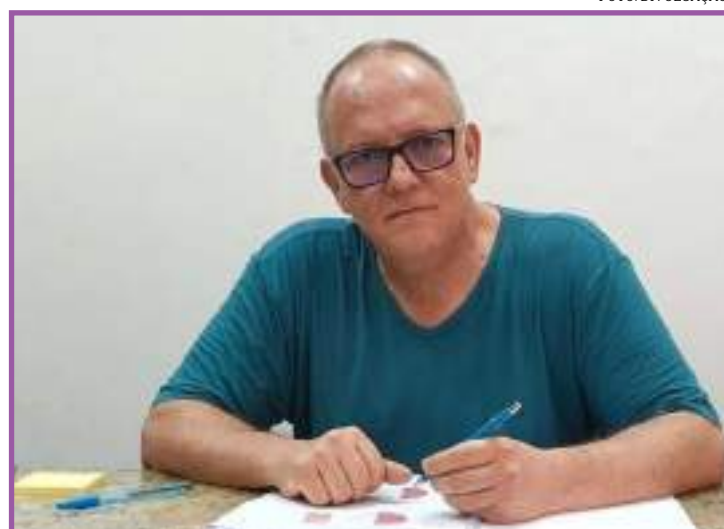
Ele teve 43,87% dos votos dados a todos os candidatos