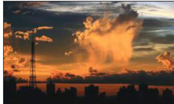
Na capital, o excesso de nuvens e as chuvas devem ocorrer até o dia 9