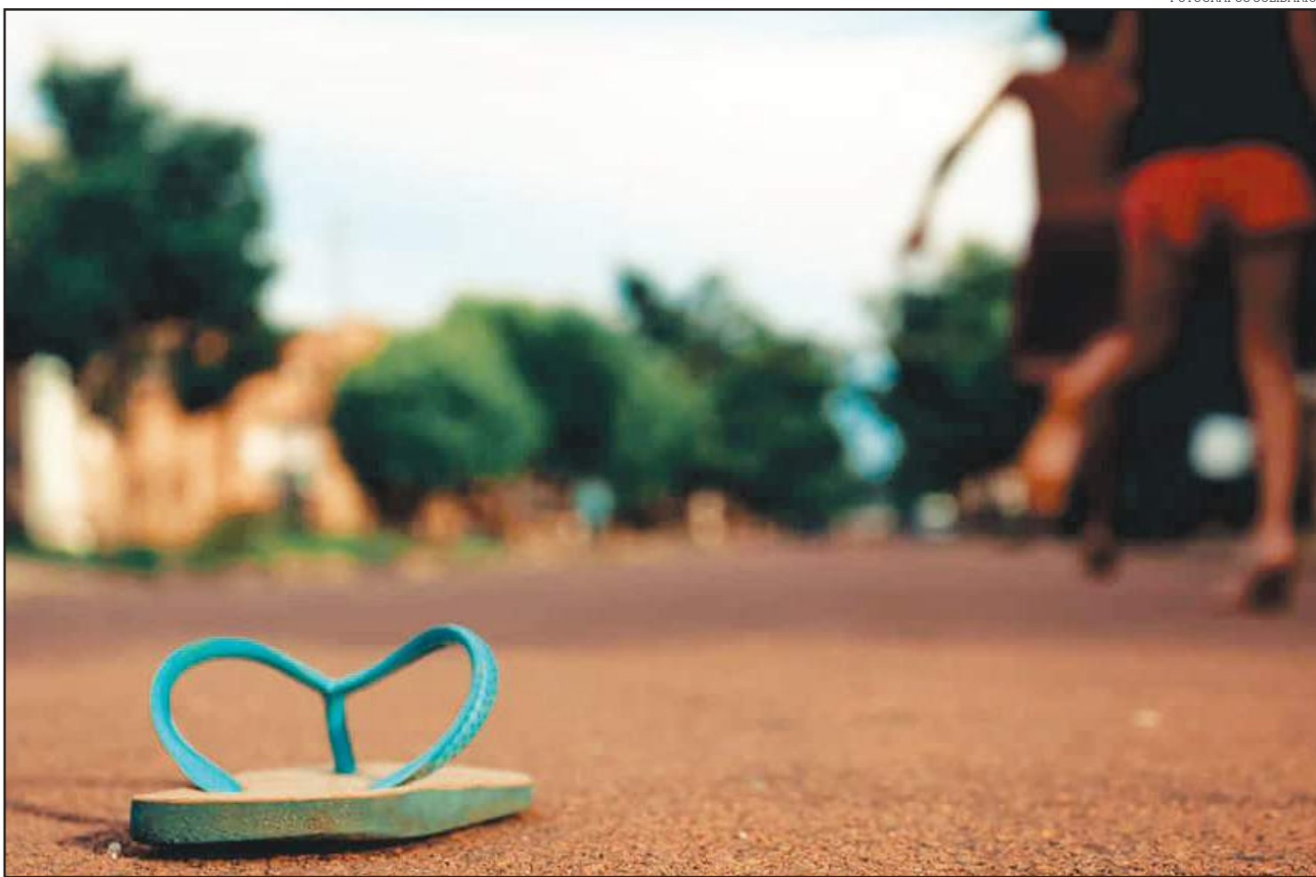
Projeto "Fotógrafos Solidários" é desenvolvido por estudantes

Quem quiser acompanhar o belo trabalho desenvolvido pelo trio pode acessar a página do projeto no Facebook: https://www.facebook.com/fotografossilariosnp/ .