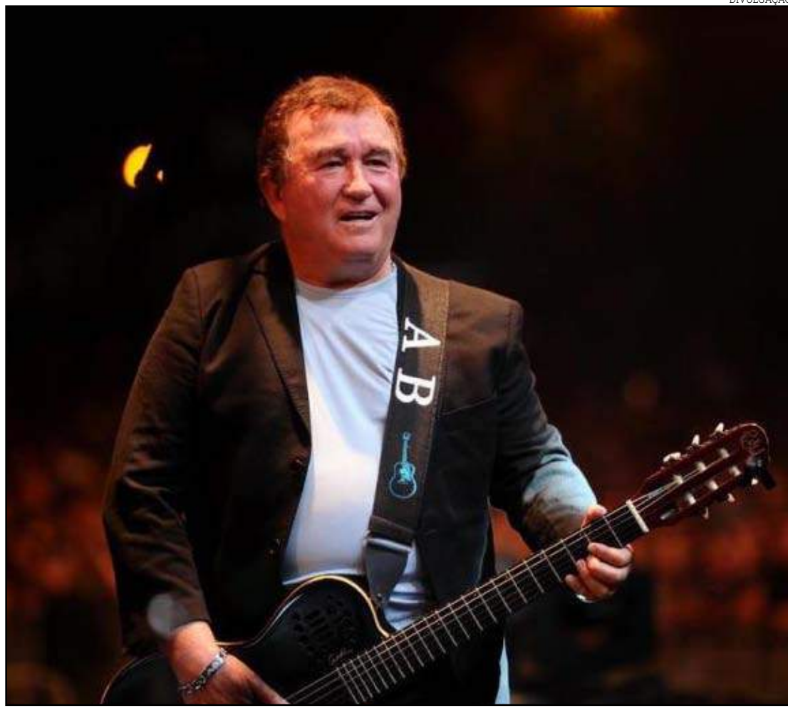
Amado Batista será a atração da festa gratuita no dia 13 de maio

“A expectativa é a melhor. Estamos vendendo muitas cartelas e camarotes. Vamos trazer muita coisa boa, inovando, trazendo muitos expositores que não vieram no ano passado. Estamos mon-