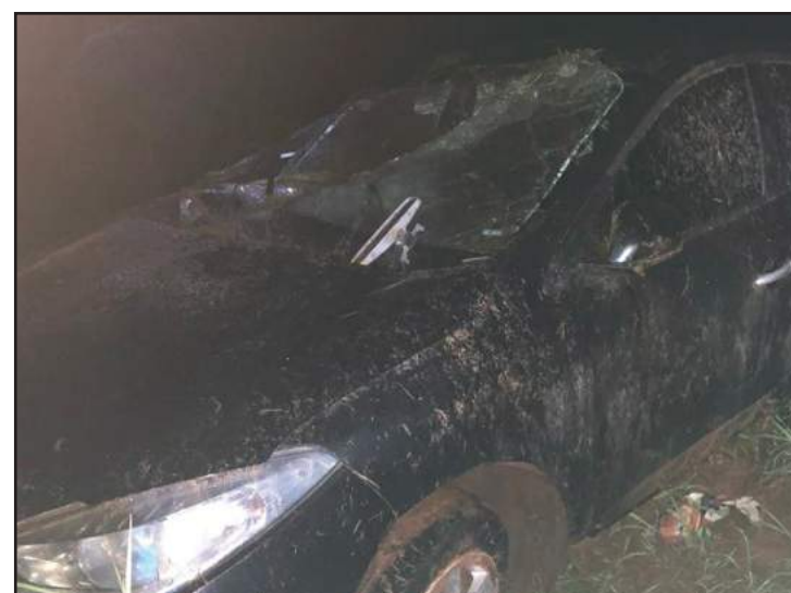
Acidente ocorreu em Nova Ubitatã, próximo da ponte do Rio Celeste