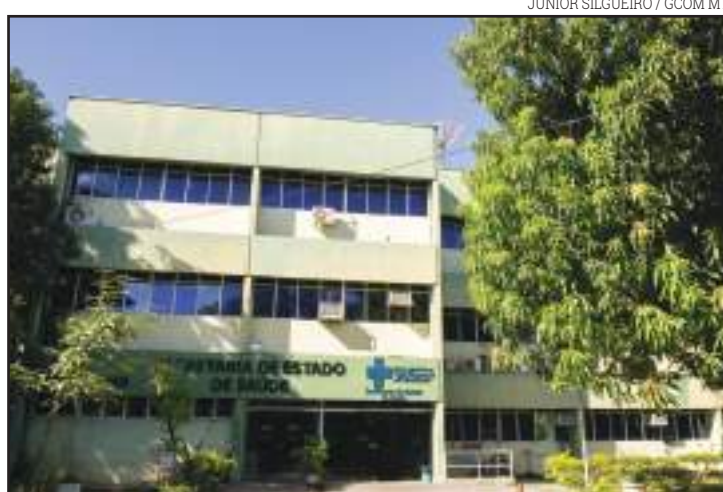
Secretaria de Saúde disponibilizo R$ 9,95 milhões

O montante foi dividido entre os fundos de cada um dos 11 municípios, que receberam os seguintes valores: Cuiabá R$ 3.300.000,00, Várzea Grande R$ 2.600.000,00, Rondonópolis R$ 1.300.000,00, Juína R$ 301.000,00, Juara R$ 500.000,00, Primavera do Leste R$ 300.000,00, Diamantino R$ 250.000,00, São Félix do Araguaia R$ 500.000,00, Jaciara R$ 200.000,00, Confresa R$ 500.000,00 e Nortelândia