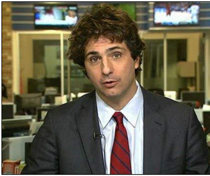
Em 2018, ele atuou como correspondente do jornal Estadão no Oriente Médio e, depois, em Nova York. Também foi correspondente da Folha de S.Paulo em Buenos Aires.