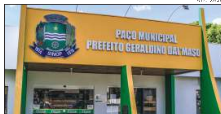
Sede da prefeitura de Sinop

O limite máximo do Executivo Municipal, estabelecido pela Lei de Responsabilidade Fiscal (LRF), é de 54%, o que faz com que a prefeitura de Sinop esteja chegando ao seu limite, antes de entrar no mesmo problema enfrentado pelo executivo cuiabano. "A prefeitura já está chegando no teto de gasto", pontuou. O limite de alerta (48,60%) e o limite prudencial (51,30%) já foram ultrapassados.