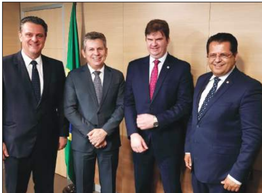
Reunião das autoridades mato-grossenses com o ministro Canuto

Além do pedido para que seja acelerada a liberação dos R$ 62 milhões, Mendes aproveitou a reunião com o ministro Canuto para pedir