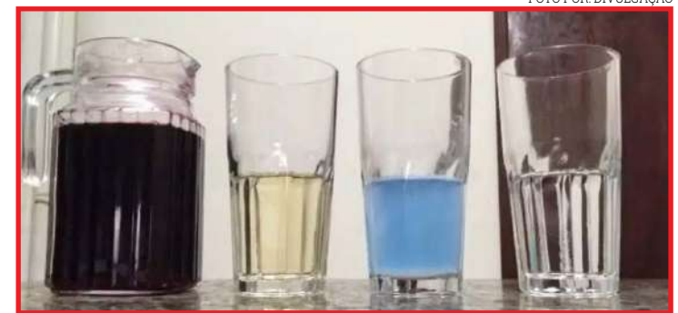
No experimento, os alunos utilizaram suco de beterraba