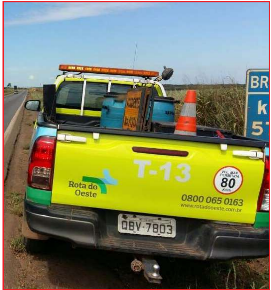
Entre os motivos, desleixo e falta de educação ao descartar objetos

Todo material recolhido é avaliado e classificado. O que é considerado lixo vai para descarte adequado, de acordo com a sua origem. Já os objetos que podem ter sido perdidos ou esquecidos na rodovia são armazenados e catalogados pela Ouvidoria da Rota do Oeste, setor