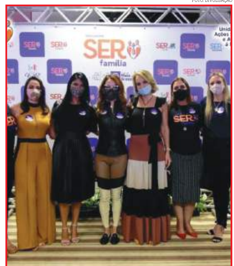
Programa do Governo ofertará valor às famílias necessitadas