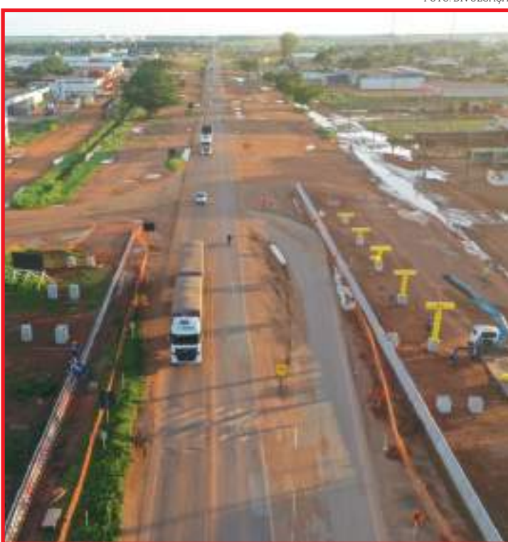
Passarela foi içada no Alto da Glória

Além da passarela já finalizada em 2016 na região de Sorriso, a Rota do Oeste atualmente trabalha na instalação de dois novos dispositivos: este de Sinop e outro no km 202 da BR-364, em Rondonópolis.