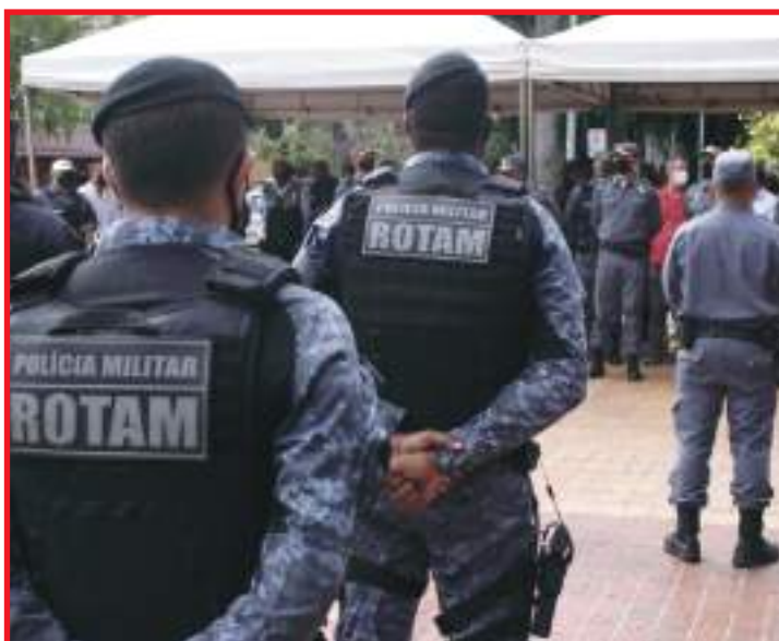
Reforço no policiamento não se restringe às áreas comerciais

O comandante assinalou que os policiais estão nas ruas se empenhando na segurança dos cidadãos. E que para garantir reforço à segurança a PM escalou o efetivo que atua no administrativo dos quartéis. Para somar forças com a PM,