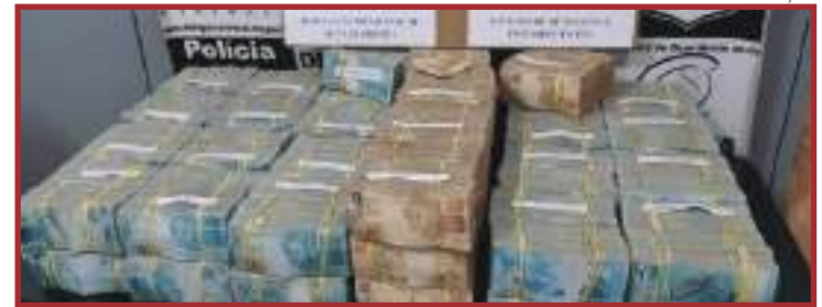
Avião foi apreendido com R$ 4,6 milhões