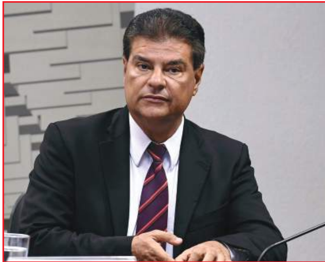
Grupo discute cooperação e desenvolvimento sustentável da Amazônia

Criado em 17 de abril de 1989, o Parlamaz funcio-