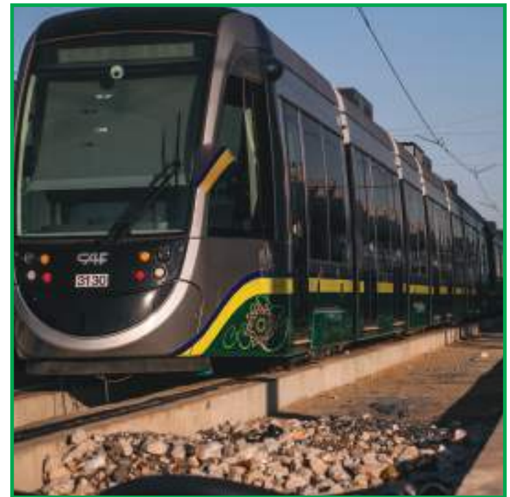
Para a entidade a decisão mostrou-se viável em diversos pontos