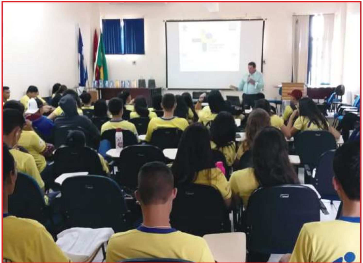
Os Institutos Federais também podem ser escolhidos

As novidades no ciclo 2021/2022 são a possibilidade de aderir ao Programa Crescer Saudável e manifestar interesse ao progra-