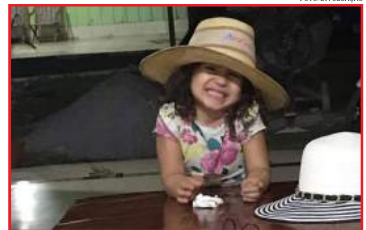
Menina estava no abrigo municipal Lar Pequeno Príncipe