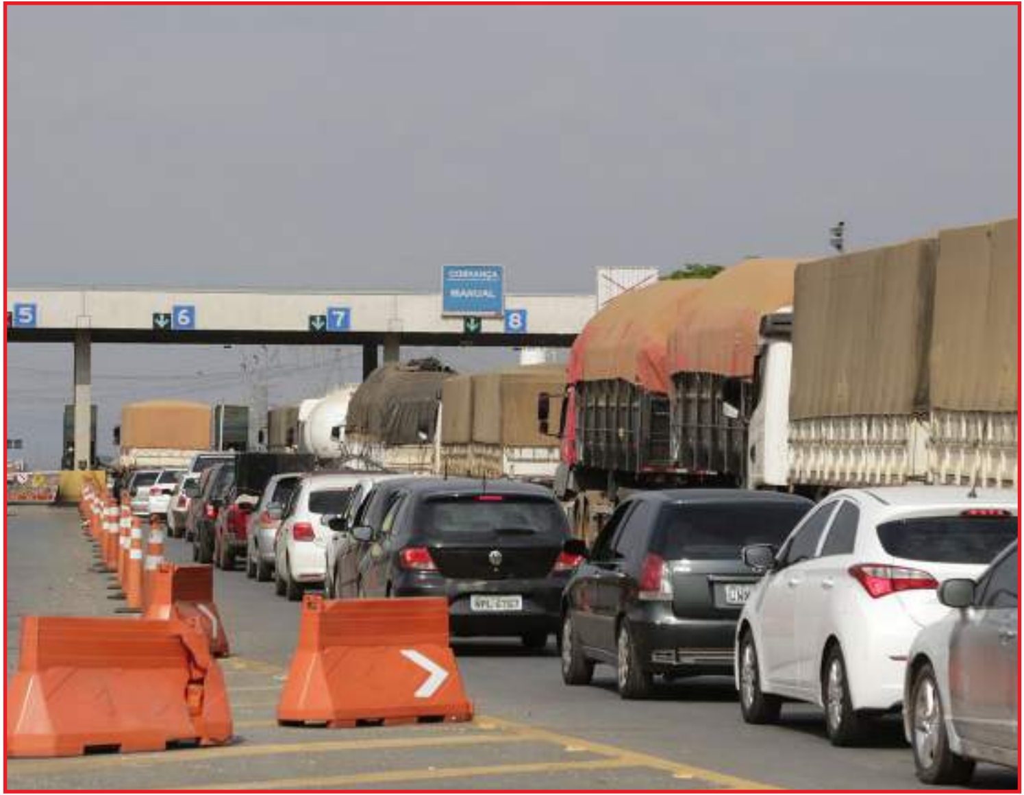
Porcentagem foi 23% menor em relação ao Natal

O usuário pode acionar o suporte da Rota do Oeste pelo 0800 065 0163, que funciona 24 horas por dia, sete dias por semana. Além de solicitar atendimento, neste canal de contato os motoristas podem obter informações sobre as condições de tráfego, intervenções na rodovia, condições climáticas etc. em tempo real.