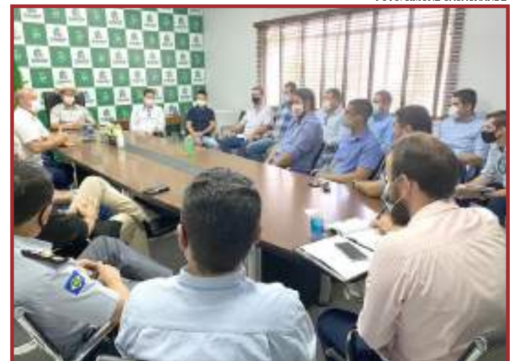
Prefeito se reúne com entidades para definir ações de prevenção