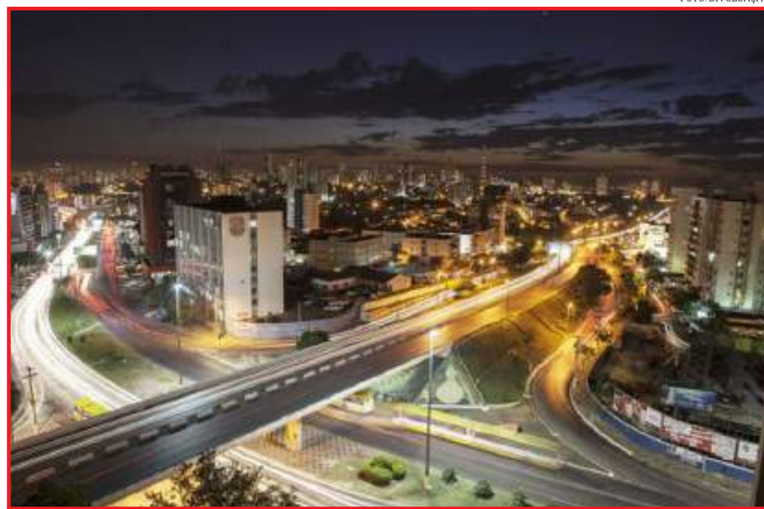
Só com a renúncia, municípios receberão o recurso

Serão repassados anualmente até 2030, sendo o aporte reduzido para R$ 500 milhões ao ano, encerrando o pagamento em 2037. O texto estabelece que a União realize as transferências no valor de R$ 58 bilhões ao longo de 18 anos, para compensar as perdas da Lei Kandir, sendo que 75% serão destinados aos Estados e 25% aos Municípios, seguindo os mesmos critérios de distribuição do ICMS.