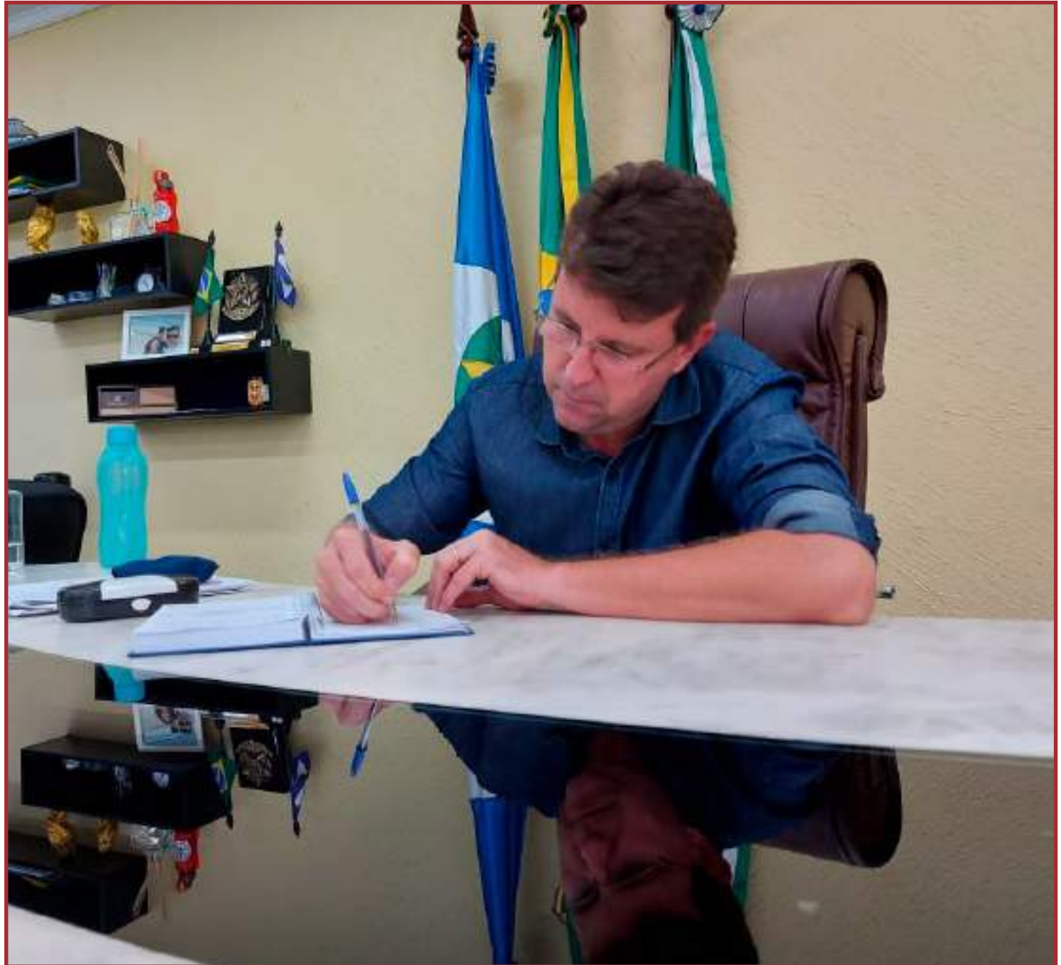
A empresa havia solicitado reajuste tarifário de 5,67%

De acordo com o prefeito, a empresa já foi acionada em R$ 12 milhões em multas por problemas nos serviços prestados. "Nós aguardamos a decisão da Justiça em relação a liminar do MP", frisa o prefeito. "Sendo assim, até não termos a decisão da Justiça, a melhoria dos serviços prestados e a recuperação do poder de compra da nossa população, afetada pela Covid-19, entendemos que não há como conceder reajuste", diz.