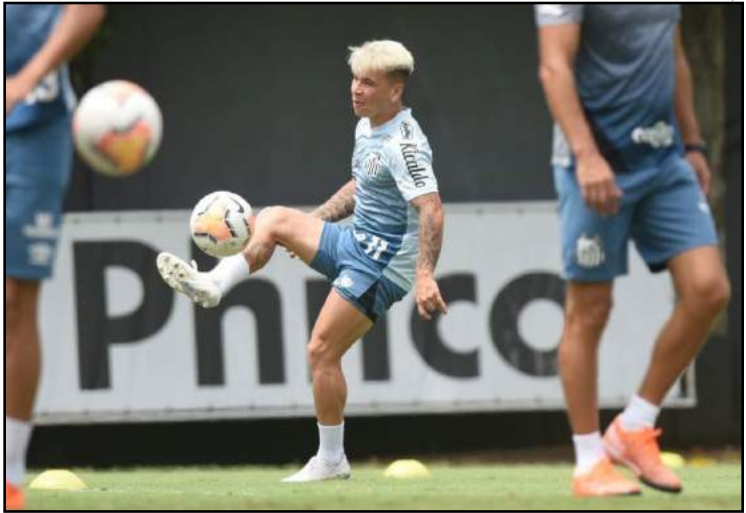
Soteldo volta à equipe nesta quarta

No último sábado, no empate por 2 a 2 contra o River Plate, Tévez ficou no banco de reservas, poupado pelo técnico Miguel Ángel Russo. Entrou aos 12 da segunda etapa, na vaga de Zárate e foi fundamental: após linda jogada individual, deu assistência para Sebastián Villa marcar aos 40, decretando o placar