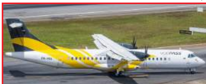
Voos começam em fevereiro

“Nosso principal objetivo é reforçar e fomentar a aviação por todas as regiões do Brasil. Acreditamos na força do segmento no regional, conectado com as empresas nacionais, nesse caso com a Voepass e Gol. O acordo com a Asta nos possibilitará oferecer mais opções de destinos aos passageiros do interior do Mato Grosso, que é uma região importante por sua força