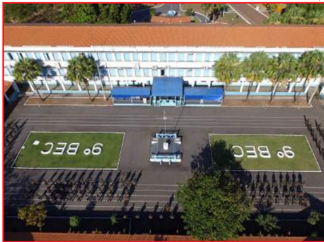
Primeiro retornam os profissionais e depois os alunos

Além de Mato Grosso, mais 14 estados já anunciaram que a educação será retomada no sistema presencial a partir deste mês. Goiás e Piauí querem os alunos nas salas de aula ainda