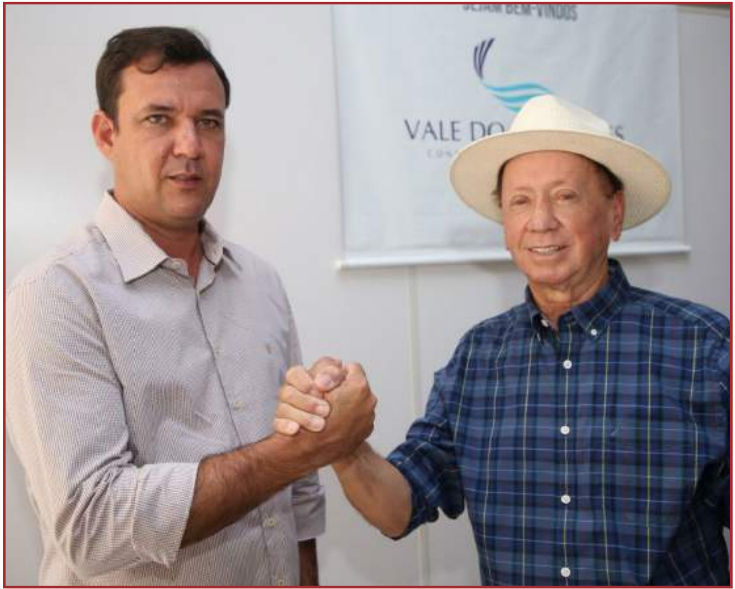
Eles foram eleitos pelos 15 prefeitos que fazem parte do Consórcio