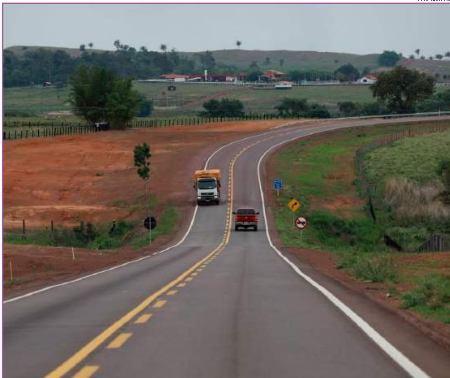
Planos são necessários para a assinatura dos contratos de concessão

Ao todo, os contratos de concessão somam quase R$ 6 bilhões e os investimentos previstos para serem aplicados na melhoria dos três lotes das rodovias ao longo do período de concessão são da ordem de R$ 3,341 bilhões. Dentre as melhorias na infraestrutura na malha rodoviária