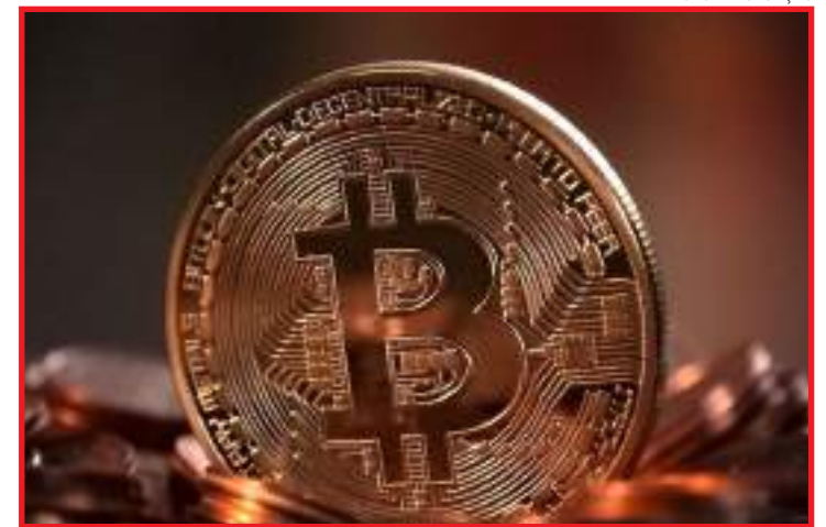
Operações envolvendo moedas digitais atingiu US$ 68,3 bilhões/dia