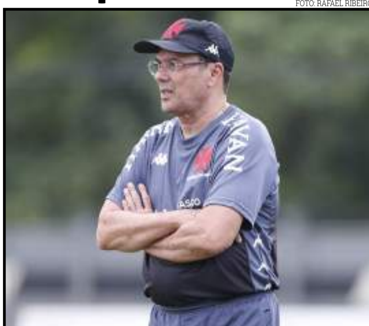
Vanderlei Luxemburgo observa treino do Vasco neste sábado