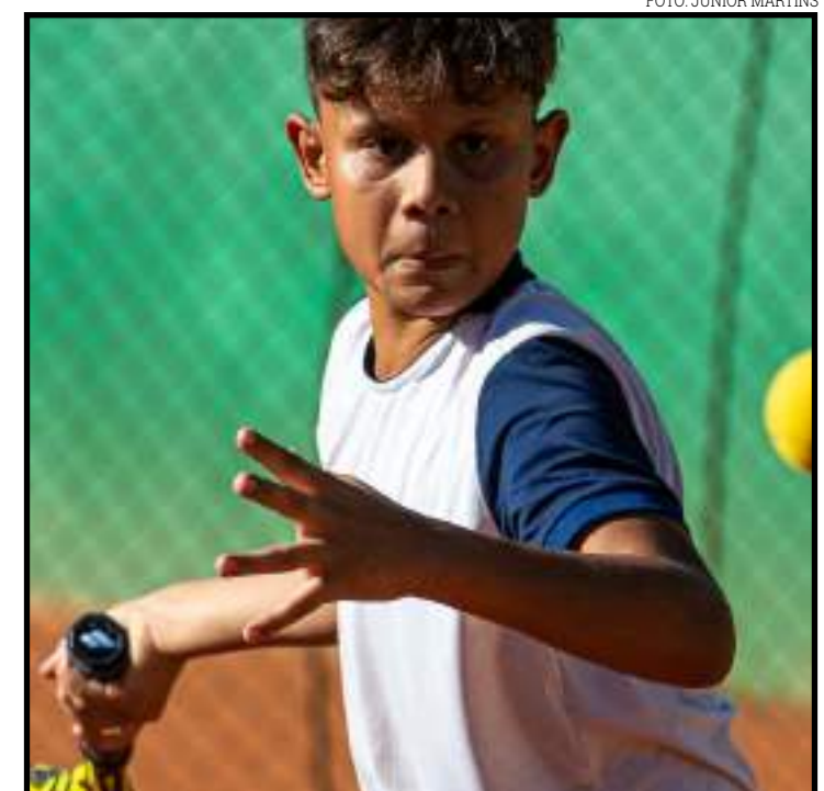
Tenistas de Sorriso e Cuiabá entram em quadra neste mês