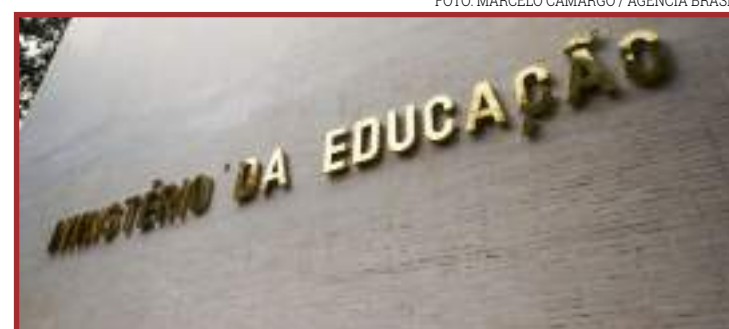
Documento orienta instituições de ensino

As alterações flexibilizarão a organização curricular do ensino médio "por itinerários formativos, que deverão ser organizados por meio da oferta de diferentes arranjos curriculares, conforme a relevância para o contexto local e a possibilidade dos sistemas de ensino", inclusive por meio de um itinerário dedicado à formação técnica e profissional. O parecer diz ainda que as alterações ocorreram em