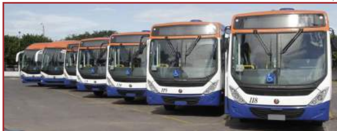
É preciso aguardar antes de renovar frota de ônibus

De acordo com a nota técnica, como haverá a retomada do processo de im-