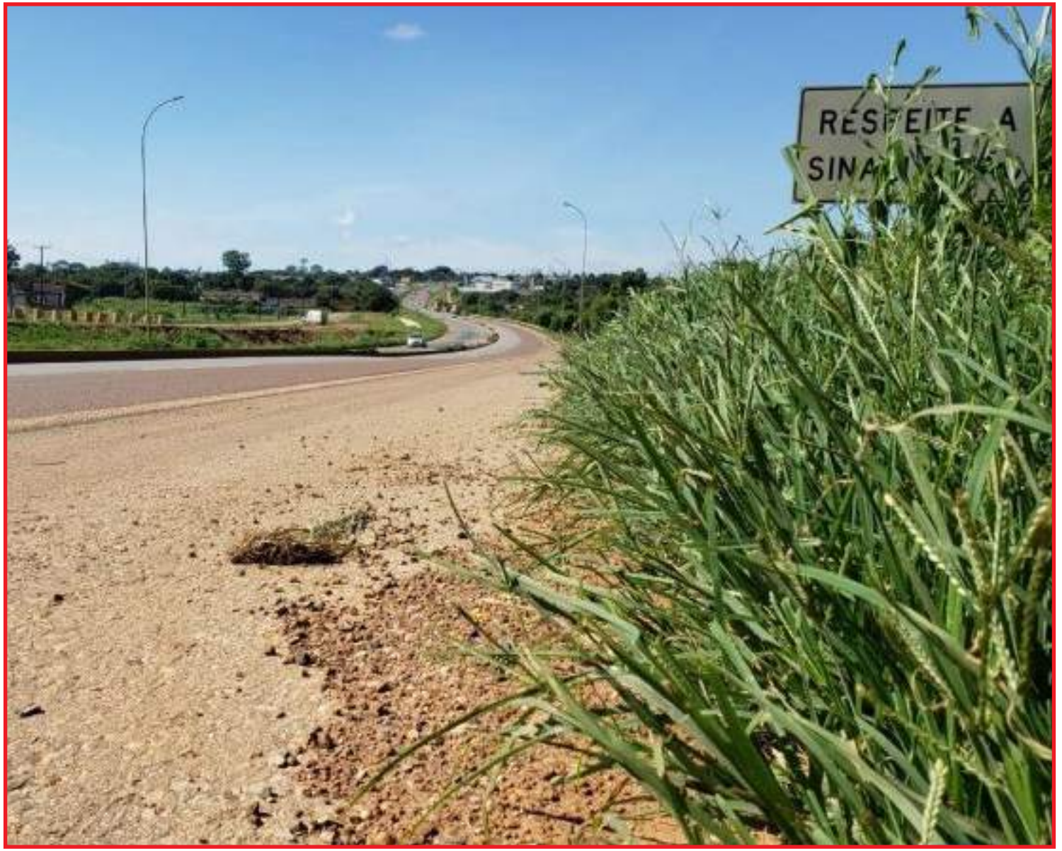
Muito mato na entrada de Sorriso

A Prefeitura de Sorriso informou que fez o pedido à concessionária para assumir a limpeza do perímetro urbano da BR-163. Segundo o Executivo, uma reunião deverá ocorrer amanhã para discutir o termo de cooperação entre a municipalidade e a Concessionária para que o serviço seja, finalmente, realizado.