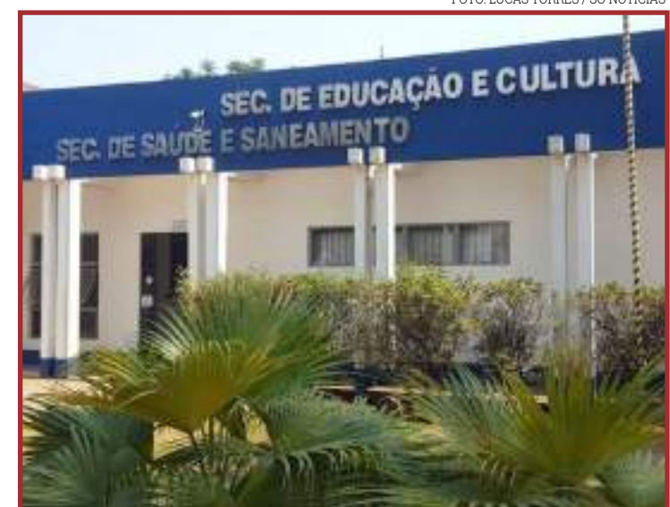
O calendário escolar de 2021 terá 204 dias letivos

Instrumento que serve de referência para instituições e redes de ensino para a oferta de cursos técnicos, o catálogo inclui todos os cursos reconhecidos pelo MEC e também especifica as necessidades de aprendizado para cada área.