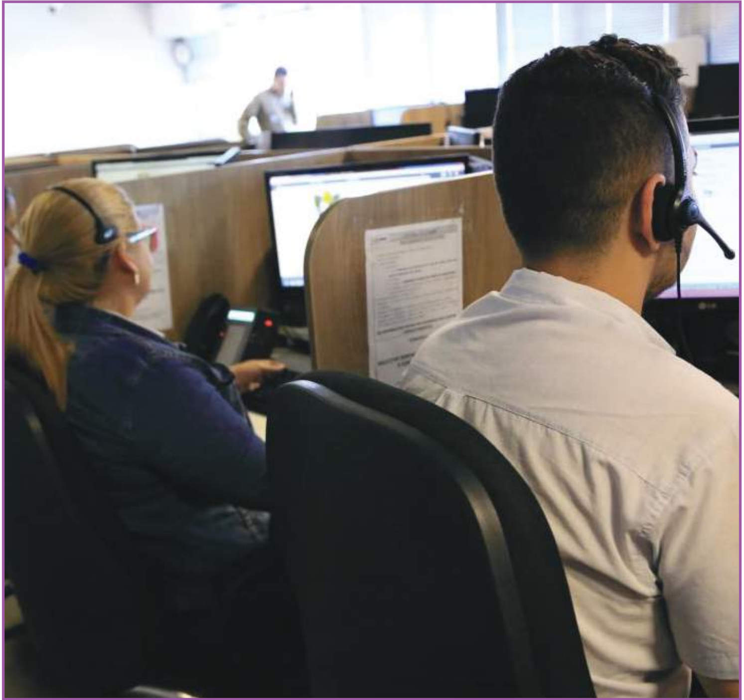
Tráfico de drogas lidera lista de crimes mais denunciados

O Ciosp recebe também os números de emergência da Polícia Militar (190), Corpo de Bombeiros Militar (193), Guarda Municipal (153), Trânsito do Município (118), Defesa Civil (199) e Polícia Rodoviária Federal (191). Além dos canais disponíveis, o setor dispõe de um número celular com WhatsApp para receber denúncias e informações complementares (fotos e vídeos). O contato é 65 99991-1197. A identidade do denunciante é mantida em sigilo absoluto.