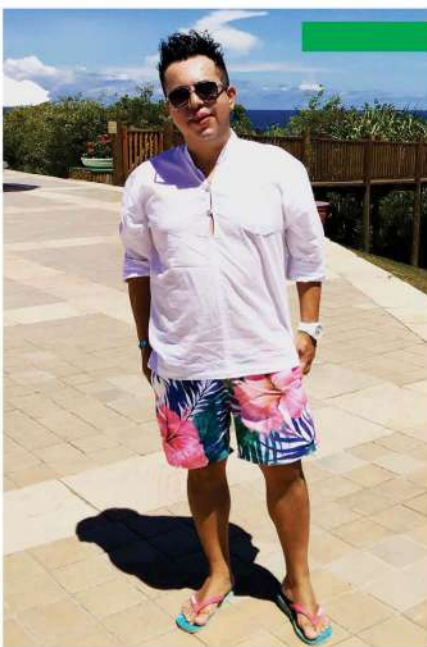
Dias atrás estive passando dias memoráveis no chiquérrimo Club Med, em Trancoso, localizado na linda Bahia. Convite mais que especial da Fenix Travel Viagens com tudo all inclusive. Foi perfeito, já quero de novo!!!