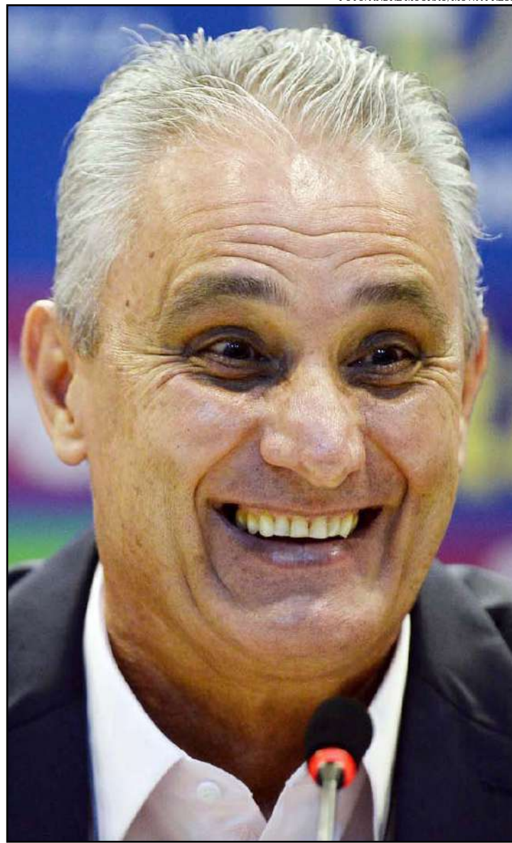
Tite durante a convocação da seleção brasileira

A seleção brasileira está no Grupo A da Copa América do Brasil, que conta também com Bolívia, Venezuela e Peru. A estreia do Brasil será no dia 14 de junho contra os bolivianos, no Morumbi. Na sequência, o time de Tite pega a equipe venezuelana em Salvador e encerra sua participação na primeira fase contra os peruanos na Arena Corinthians.