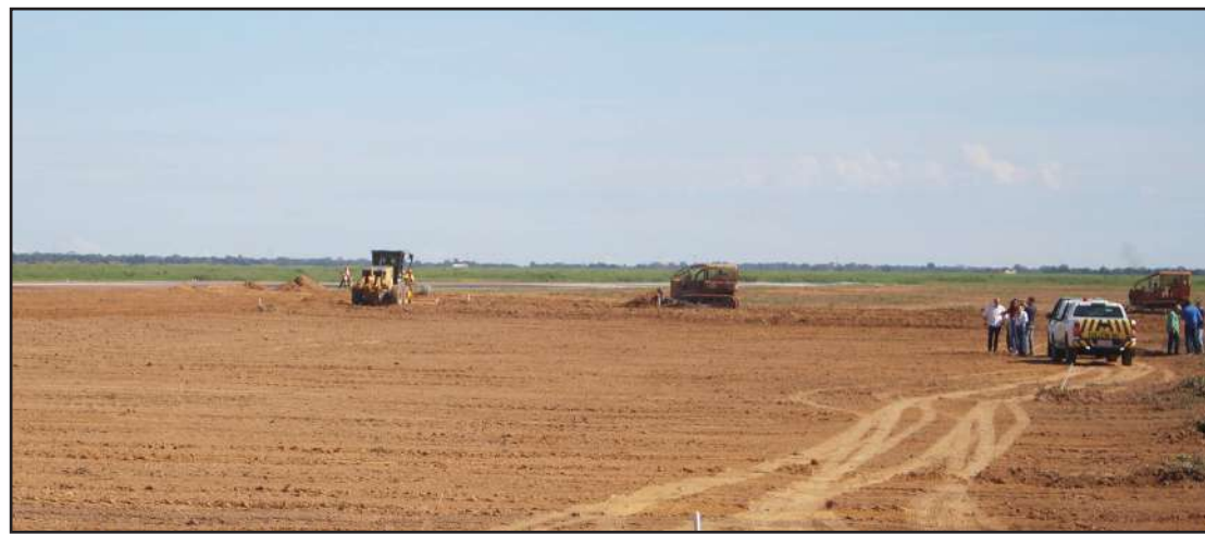
Rosana visitou parte do alargamento da pista