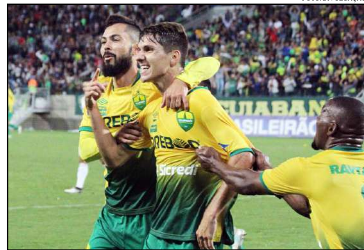
Cuiabá segue invicto e lidera a competição – Foto: Divulgação

O líder neste quesito é o União, que balançou as redes adversárias 14 vezes,