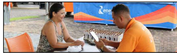
População poderá trocar lâmpadas e participar de atividades

Nesta sexta (1º), das 8h às 17h, serão realizadas palestras educacionais e trocas de lâmpadas, e das 18h30 às 19h30, terá apresentação teatral, com a peça "O inimigo invisível". No sábado, dia 2, serão realizadas trocas de lâmpadas, das 8h às 12h.