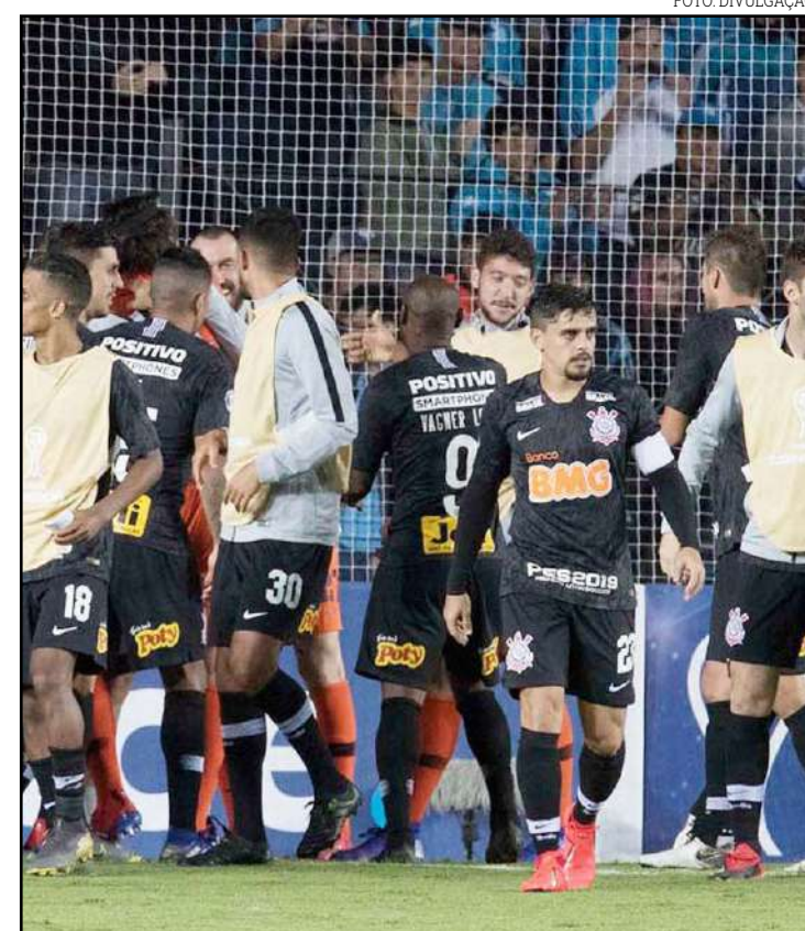
Avaliação do Clarín é que equipe de Carille deixou muitos espaços