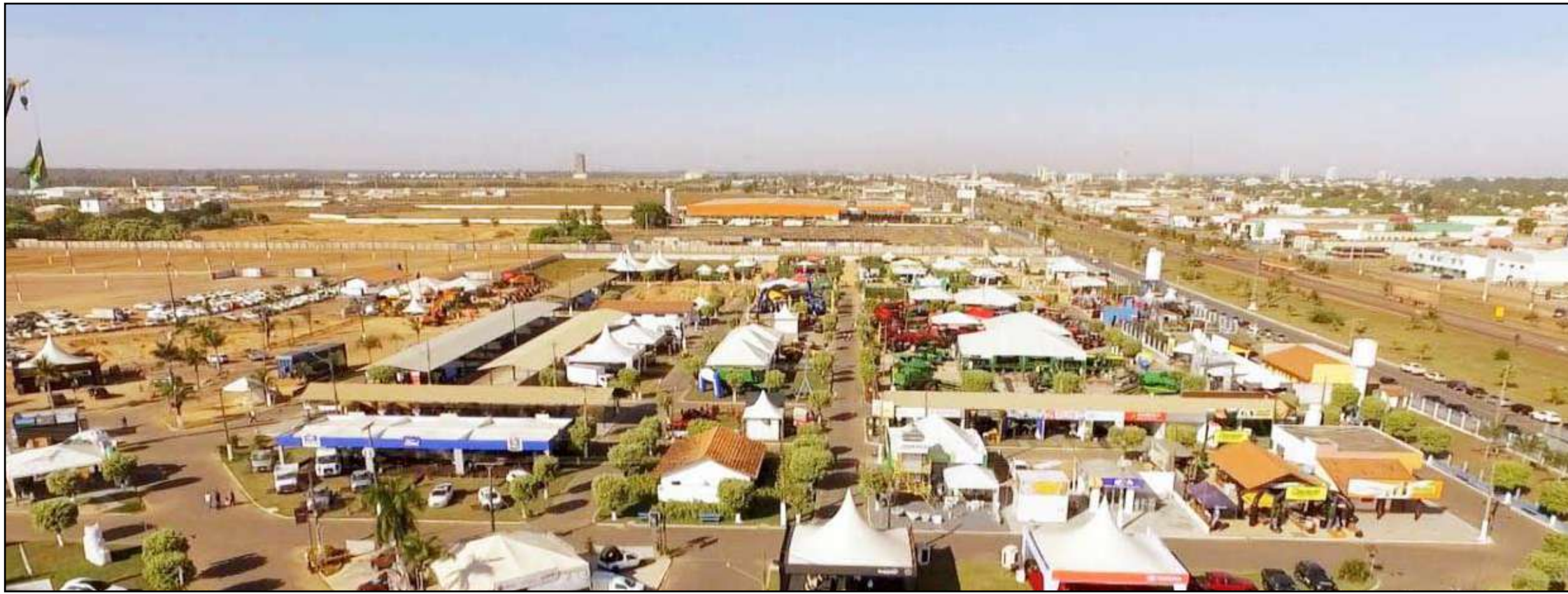
Evento ocorre de 14 a 17 de abril, na Acrinorte, em Sinop