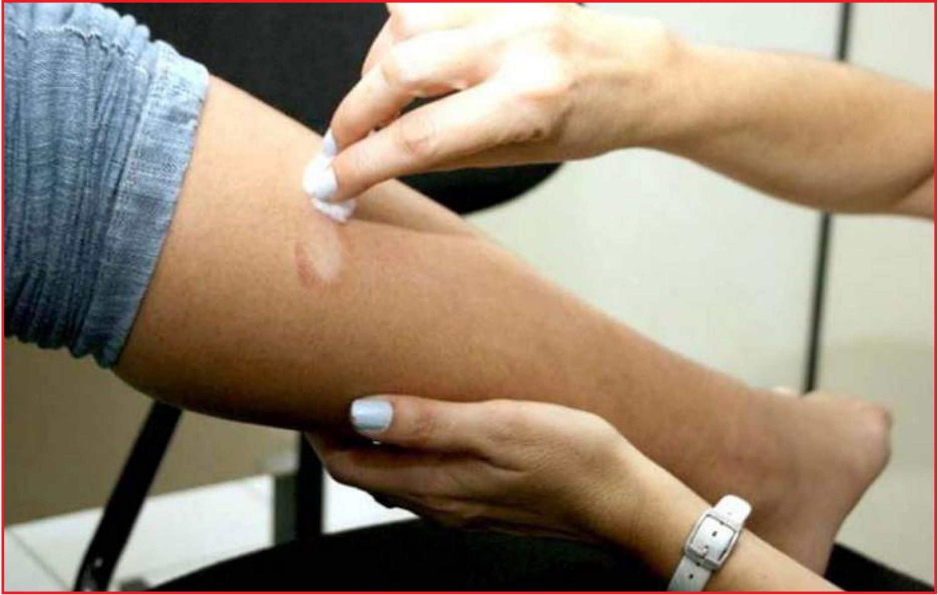
Casos subnotificados de hanseníase no estado

Saúde firmou um termo de cooperação técnica com a ong Aliança Contra a Hanseníase, para fortalecimento do programa "Mato Grosso em Redes: Cuidado Integral em Hanseníase".