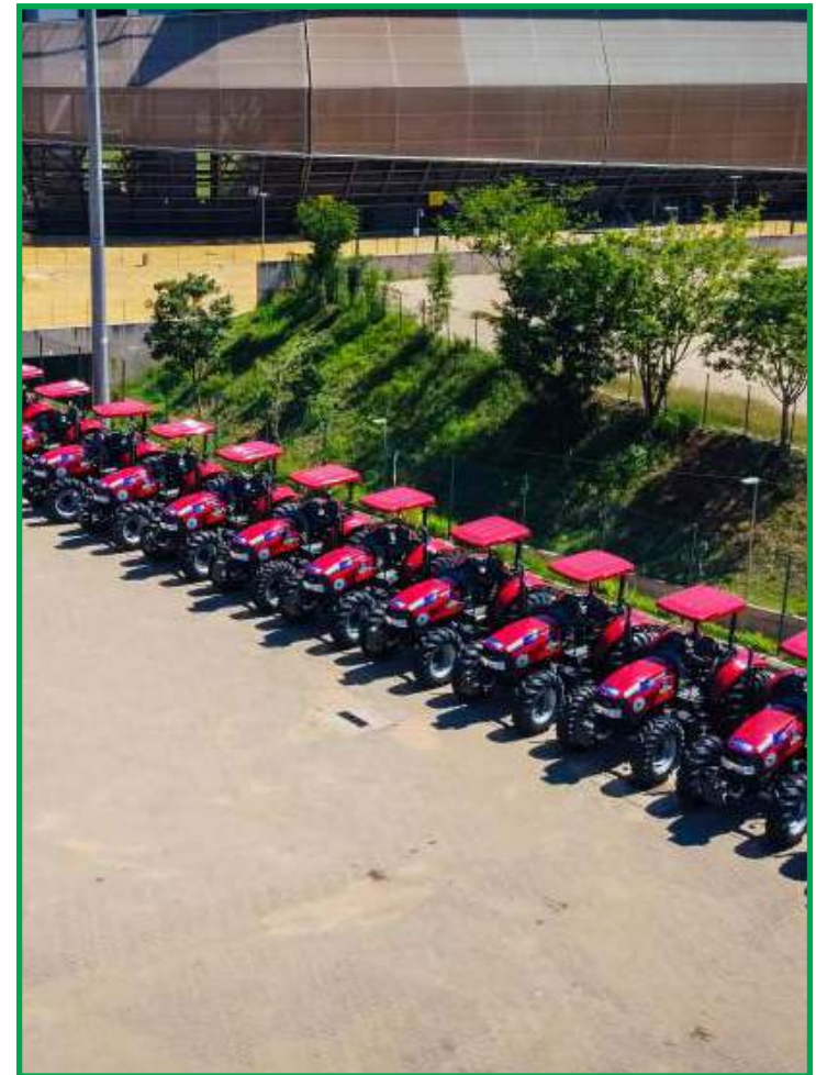
Solenidade será realizada no pátio do ginásio Aecim Tocantins, em Cuiabá

As 100 caixas de abelhas, montadas com madeira apreendida em fiscalizações realizadas pela Secretaria de Estado de Meio Ambiente (Sema), foram construídas pelas mãos de reeducandos da Fundação Nova Chance. Parte delas será destinada a Confresa, município que servirá de projeto piloto na inserção da comunidade indígena no trabalho de fortalecimento que o Governo do Estado começa a realizar em prol da apicultura mato-grossense. Todas elas custaram aos cofres estaduais R$ 12,5 mil, em gastos voltados para a montagem.