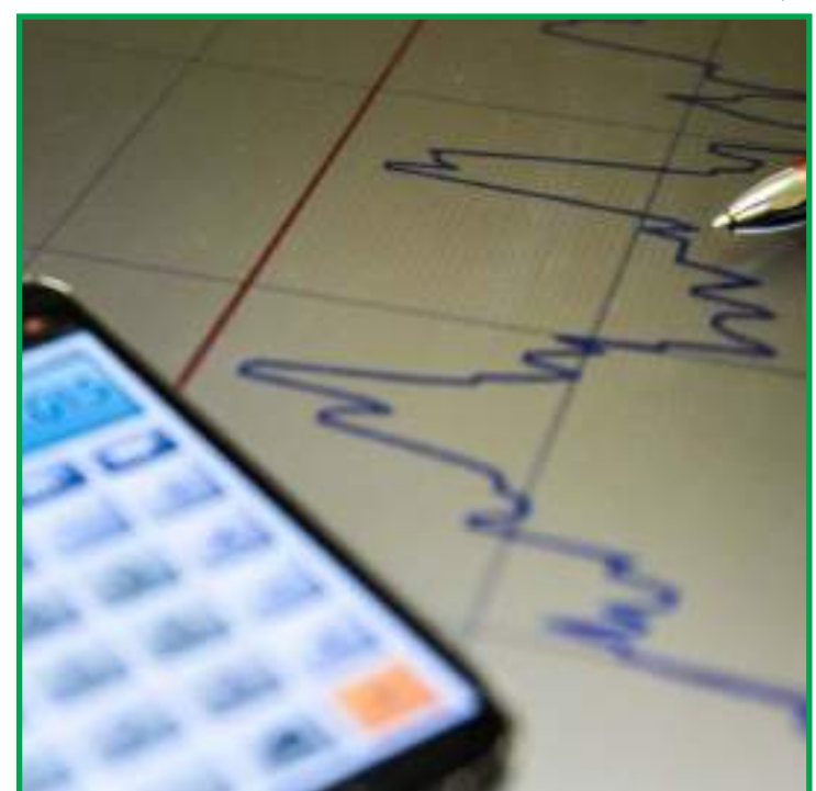
Desempenho das commodities explica o valor exportado em 2020

O desempenho das commodities, na avaliação do Ibre, explica os 66% do valor exportado em 2020, o que representa o maior percentual da série histórica iniciada em 1998, quando foi de 40%. O valor das exportações de commodities cresceram 0,5% de 2019 para 2020 e das não commodities recuaram 18,5%. Em volume, as commodities cresceram 7,4% e as não commodities recuaram 13,5%. Com o aumento de volume de 7,4%, o setor agropecuário foi líder nas exportações brasileiras em 2020, explicada pelo aumento do volume das exportações para a China (17%). A participação do país saiu de 28,1% para 32,3% de 2019 para 2020. Os demais países da Ásia também registraram contribuição positiva de 11,1%, e explicou 14,9% das exportações brasileiras.