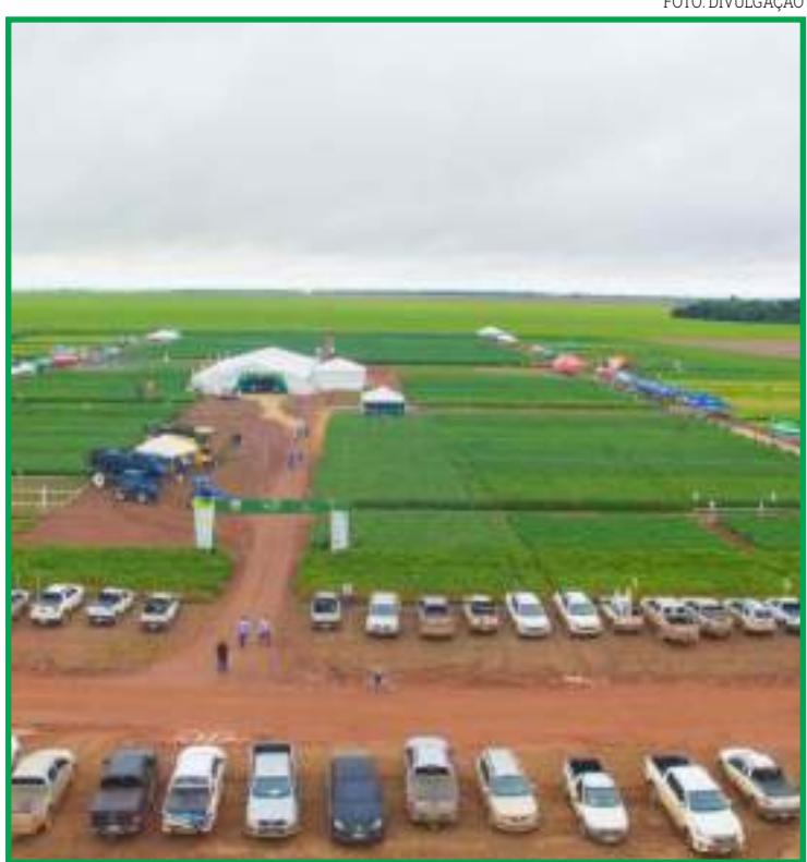
Querência recebe o evento na sexta

A organização espera a participação de um público maior que na edição de 2020, entre produtores, agrônomos e técnicos agrícolas, que poderão ver os resultados de variedades de ciclo precoce, médio e tardio, com diferentes manejos, posicionamentos e emprego de tecnologias.