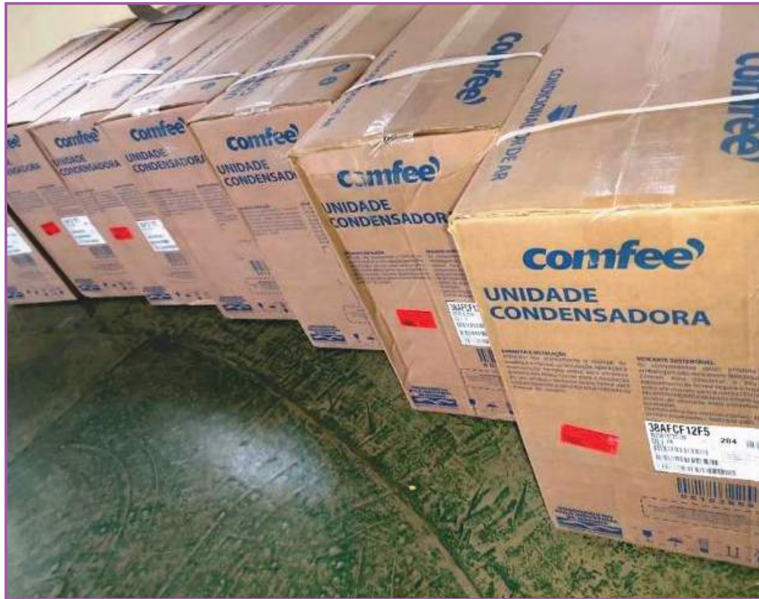
Compra de 17 aparelhos de ar condicionado com os prêmios do Nota MT

Para participar do Nota MT, as entidades precisam estar cadastradas no