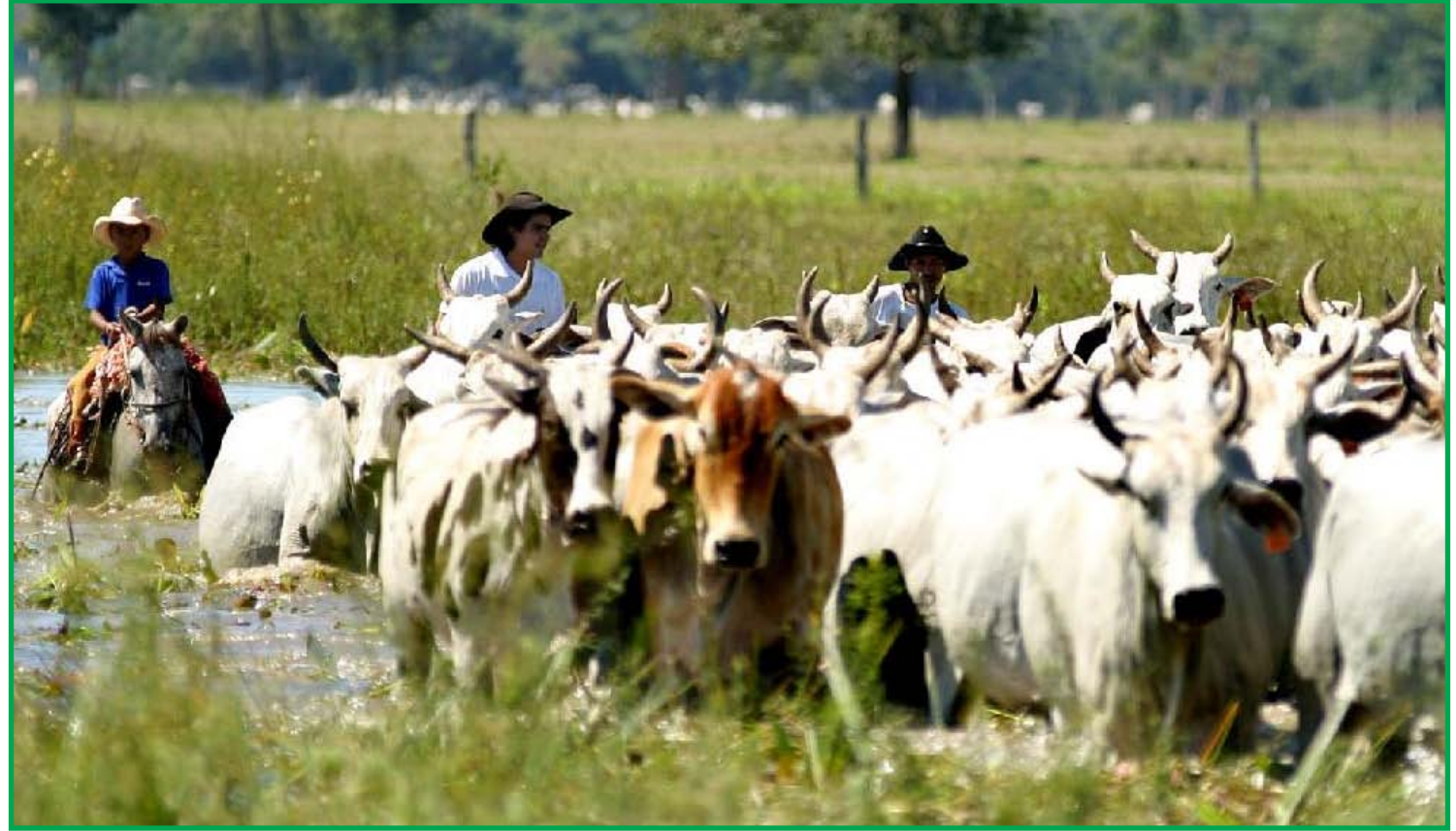
Decreto especifica quais são os capins nativos dos campos do Pantanal

Conforme o artigo 10º, "o uso do fogo para manejo di-