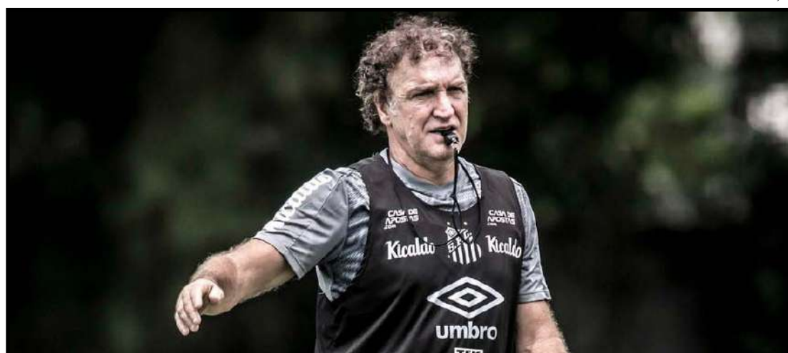
Cuca deve escalar Santos reserva hoje