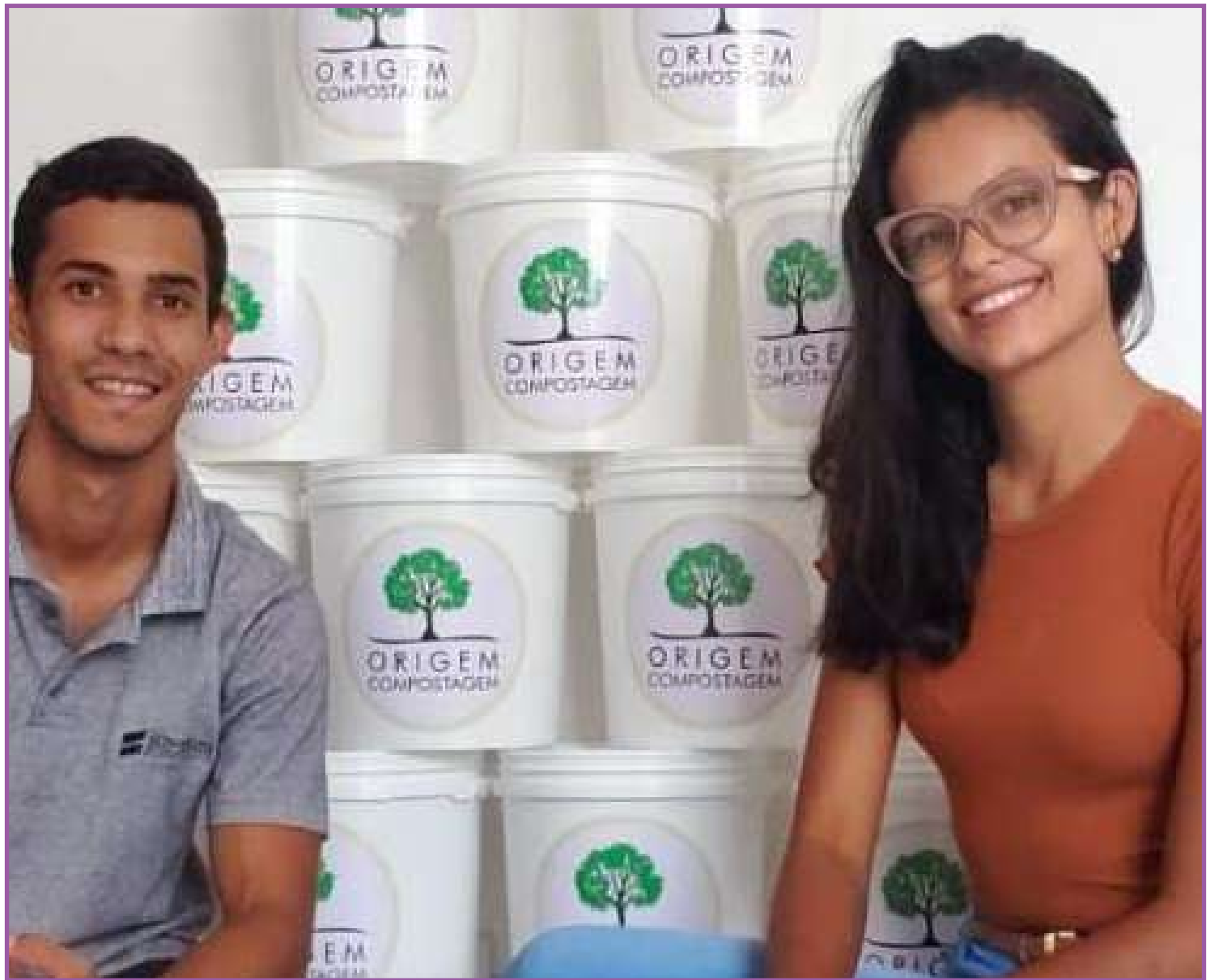
Casal transforma restos de comida em adubo

faz todo processo fica localizado na estrada para Chapada dos Guimarães (a 60 km de Cuiabá), cerca de 4 km da Fundação Bradesco. O local está sendo reformado para comportar visitas futuras de escolas. "A gente quer trazer as várias