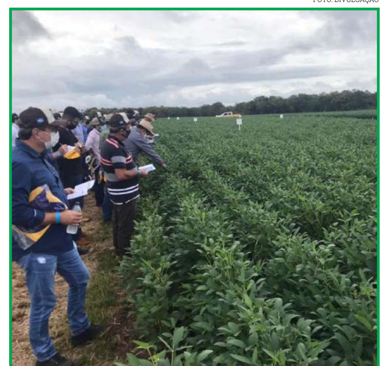
Comitativa esteve em Campo Novo na terça

do com os demais setores da economia, a construção de um Brasil pujante.