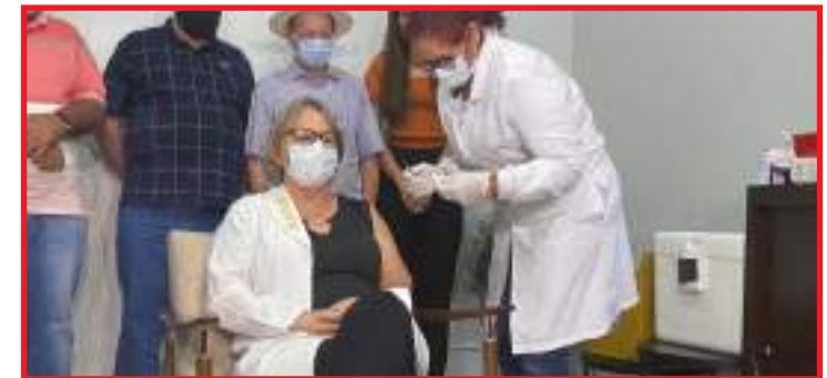
Começou a vacinação contra Covid em Sinop