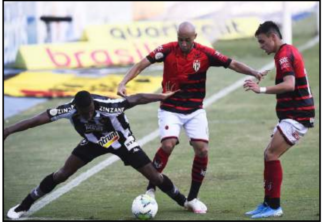
Botafogo está cada vez mais fraco no Campeonato Brasileiro

"Em nenhum dos sete jogos a gente levou vantagem para o intervalo. Levamos gol nos sete jogos que