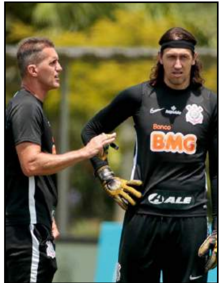
Vagner Mancini com Cássio no Corinthians