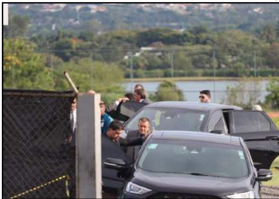
Presidente compareceu à atividade do time carioca

O treino do Flamengo em Brasília após a vitória sobre o Palmeiras foi marcado pela presença do presidente Jair Bolsonaro. Ele esteve na atividade, que ocorreu na tarde desta sexta-feira, no CT do Brasiliense. A chegada de Bolsonaro ao local foi marcada por hostilidades de parte dos 50 torcedores que aguardavam na entrada do CT tentando entrar para acompanhar o treino. Outro grupo, entretanto, reclamou da atitude, temendo que o acesso fosse negado pelo Flamengo posteriormente, temendo novas hostilidades. Pouco depois da chegada da comitiva presidencial no CT, um grande grupo de seguranças entrou no local. Apesar da animosidade inicial entre os torcedores, não foram registradas confusões ou agressões na entrada do CT do Brasiliense.