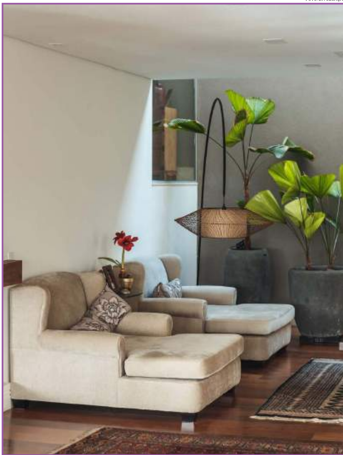
Dicas de como cultivar plantas no apartamento

Durante o dia, portas e janelas abertas também, para a luz entrar.