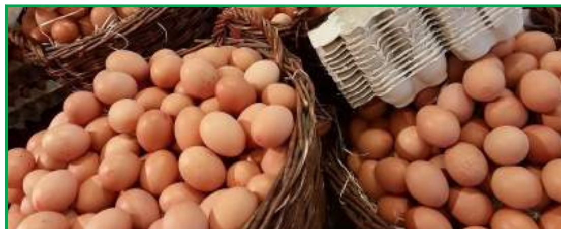
Cage free, free range, sistema tradicional ou produção de ovo orgânico?

Doutor em produção e nutrição de não-ruminantes, Luna também é instrutor cre-