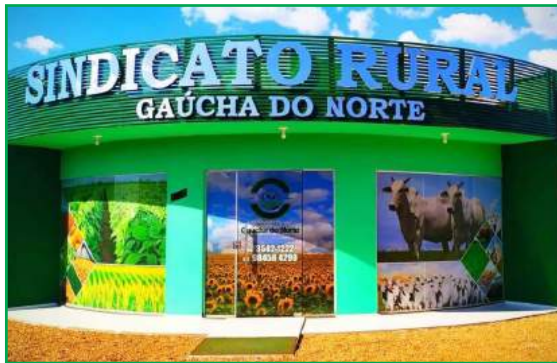
Sindicato abrirá cursos feitos pelo Senar

inscrever no Sindicato Rural localizado na Rua Paraná,