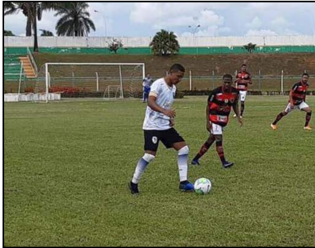
Sinop avançou após golear Águia Negra

No mesmo dia, mas às 15h, o Sinop FC pega o Atlético-GO, no Estádio Antônio Acioly. O Dragão disputa a elite do futebol nacional e é o adversário mais complicado