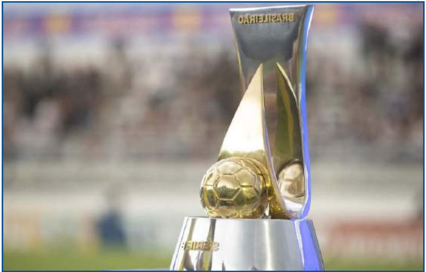
Entidade fabrica duas taças idênticas para partidas finais da competição

Na briga pela última vaga a elite do futebol nacional, estão na disputa o Juventude (58), CSA (57) e Avaí (55), separados por 3 pontos apenas. Os 3 jogam fora de casa na última rodada.