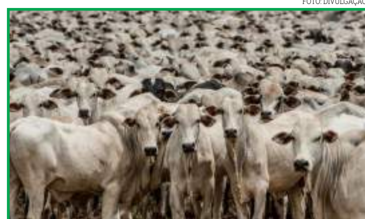
Produtores enviaram 323 mil bovinos

A queda no abate de gado se deve exclusivamente a pandemia do coronavírus, que enfraqueceu a economia e aumentou a taxa de desemprego. O reflexo pandêmico fica claro quando verificado o fluxo de animais em alguns meses. Em março/20, quando a Covid-19 começou a dar as caras de forma incisiva no país, os produtores da região enviaram 19.264 animais para