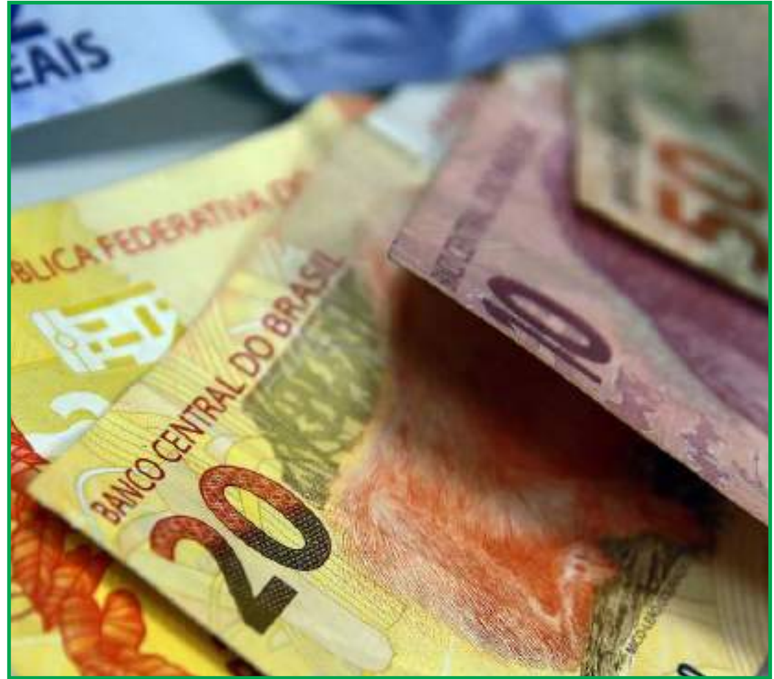
Destaque foi a redução de 5,8 pontos percentuais no crédito pessoal não consignado

Para as empresas, a taxa subiu 1,7 pontos percentuais no ano, para 10% ao ano.