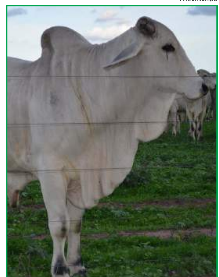
No acumulado deste ano, a valorização do animal chega a 11,55%

Para os animais destinados à exportação, o Brasil está em condições de atender a demanda, especialmente da China. "O país vai continuar dando preferência ao mercado chinês. Nesse momento, a China está bem abastecida por conta do feriado do Ano Novo Chinês. Após as festividades, o país deve retomar o maior ritmo de compras do Brasil, principalmente de carne bovina", destaca Iglesias.