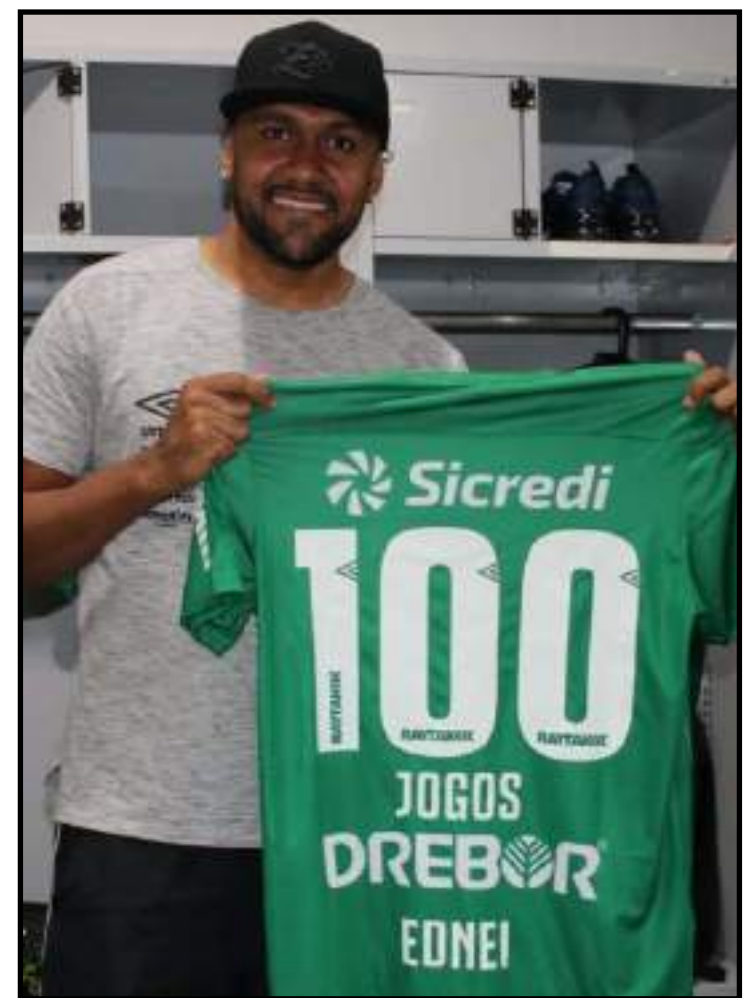
Zagueiro conquistou acessos para as Séries B e A e título da Copa Verde