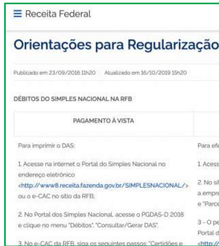
Pedido é feito exclusivamente pela internet

No caso de empresas que ainda não eram optantes pelo Simples, no momento da opção o sistema responde automaticamente se há pendências com os fiscos federal, estadual ou municipal. Para a regularização de pendências com a Receita Federal ou com a Procuradoria-Geral da Fazenda Nacional não é necessário que o contribuinte se dirija a uma unidade da Receita Federal, basta seguir as orientações para regularização de pendências no site da Receita Federal.