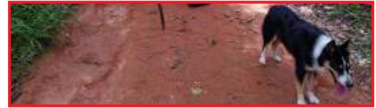
Idoso desapareceu há 2 meses em floresta