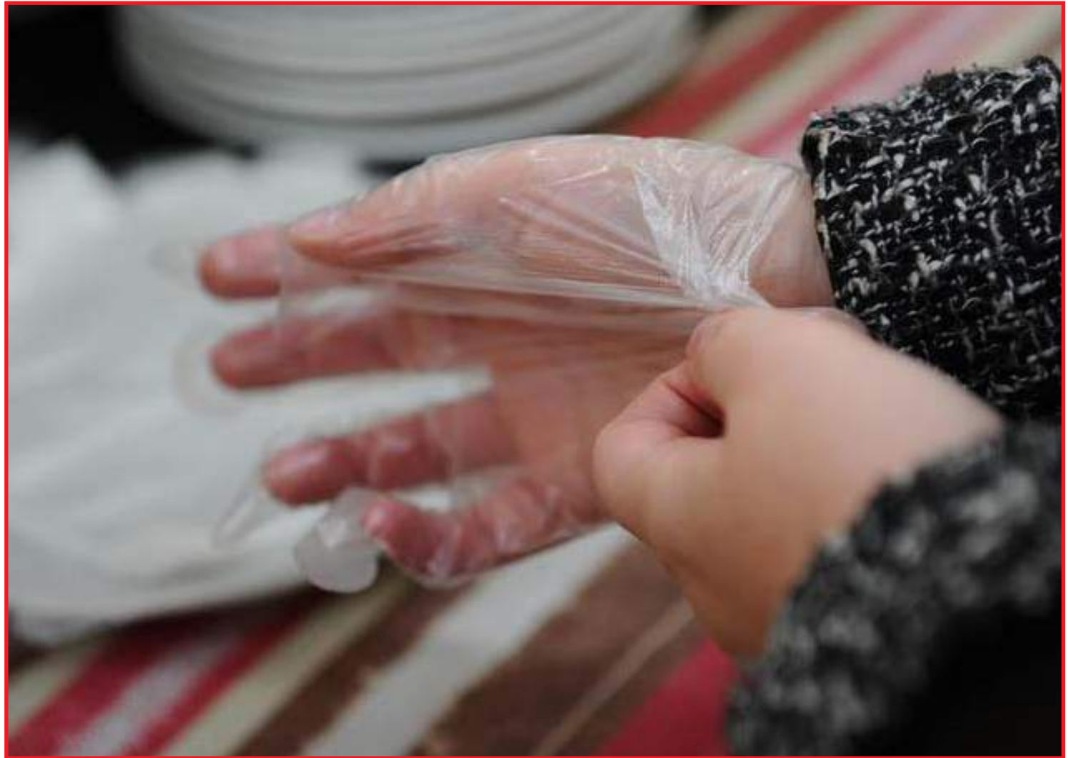
Usar luvas não deveria ser motivo de discussão, e sim de higiene