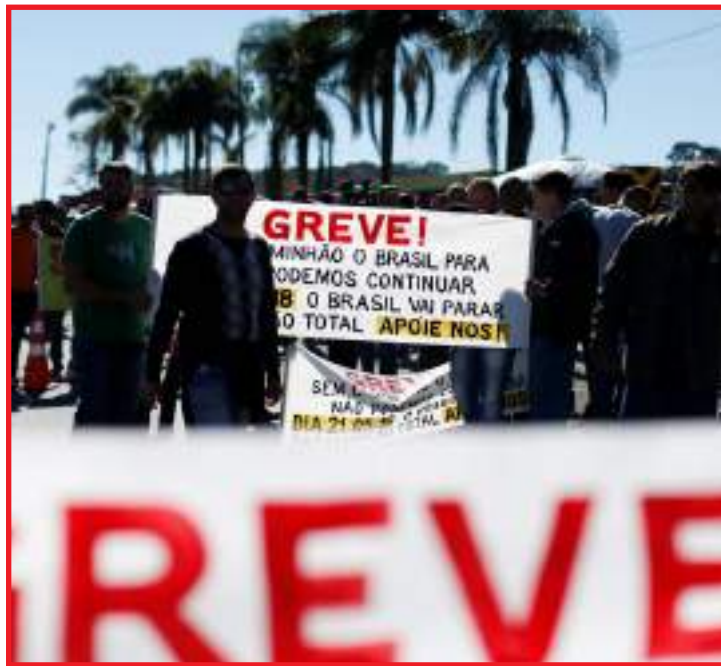
Caminhoneiros devem parar a partir de segunda

Durante a greve, 30% do total dos trabalhadores continuarão trabalhando, segundo o ofício, que foi encaminhado também ao Conselho Administrativo de Defesa Econômica (Cade). Em nota, o Ministério da Infraestrutura disse que o Conselho não é o responsável por falar pela categoria. Veja a seguir: "O Ministério da Infraestrutura esclarece que o Conselho Nacional do Transporte Rodoviário de Cargas (CNTRC) não é entidade de classe representativa para falar em nome do setor do transporte rodoviário de cargas autônomo e que qualquer declaração feita em relação à categoria corresponde apenas à posição isolada de seus dirigentes. O Minfra refor-