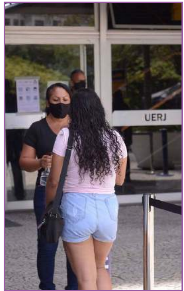
Participantes farão no domingo provas de redação, linguagens e ciências humanas