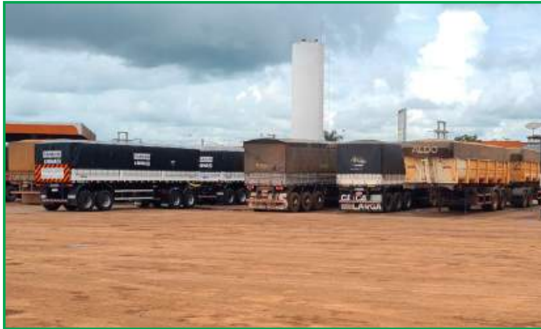
Demanda por caminhões para transportar a safra segue tímida em MT