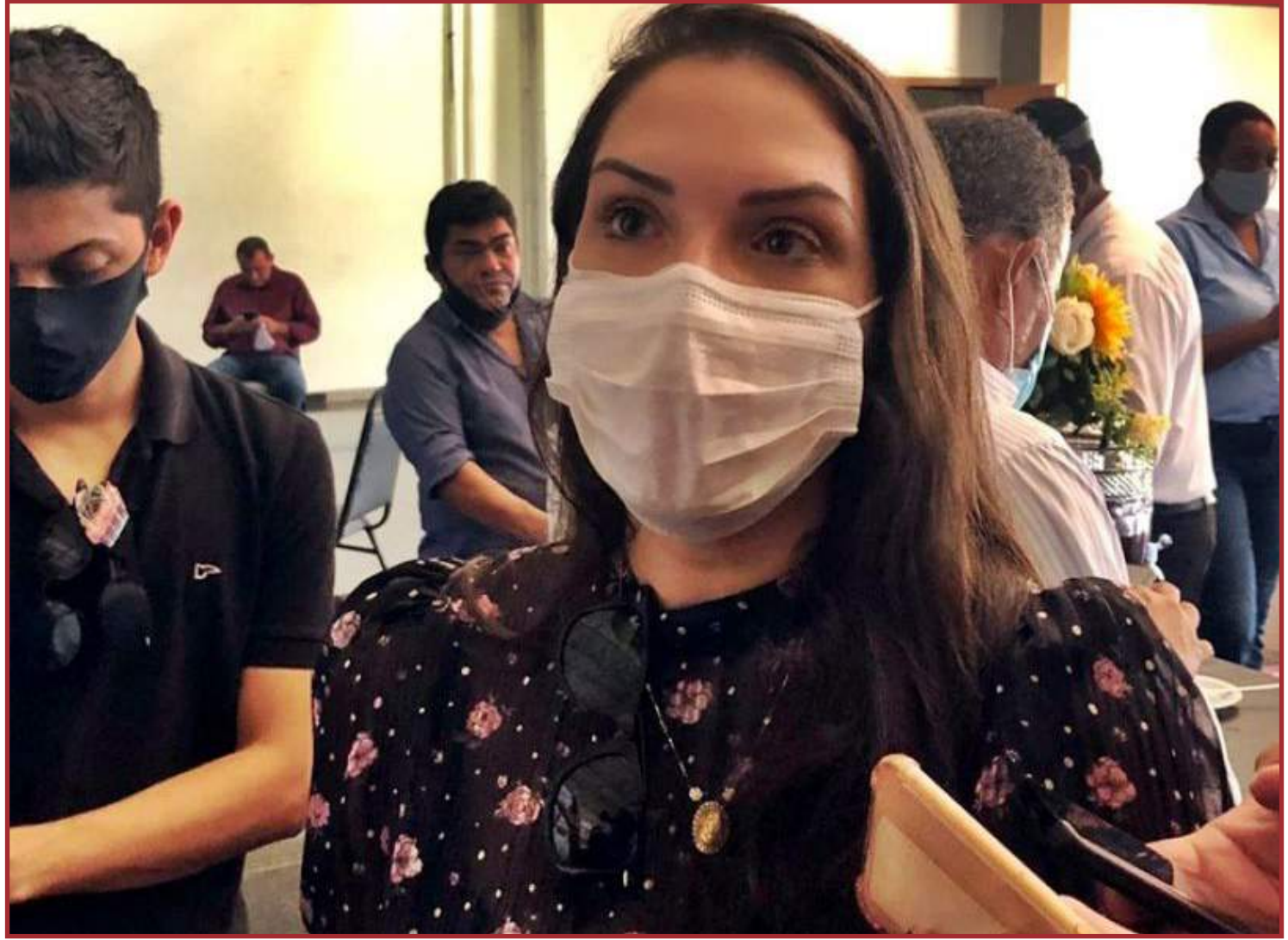
Deputada estadual defende o pagamento de RGA para servidores do Judiciário