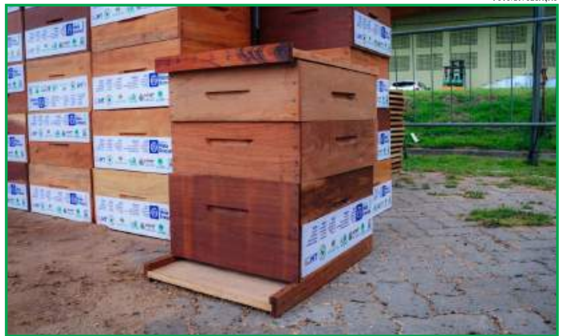
Crescimento virá por meio do Programa MT Produtivo-Apicultura