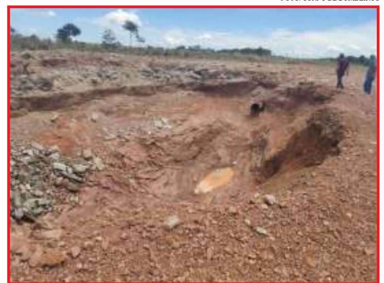
Explosão deixou duas mulheres feridas por detritos