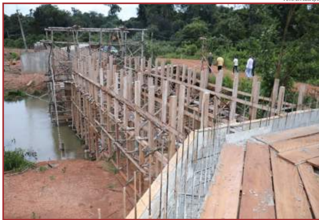
Prefeitura está construindo pontes, galerias e bueiros

Já estão sendo providenciadas pela empreiteira os demais serviços comple-