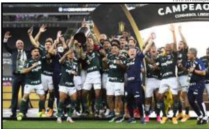
Palmeiras comemora o título da Libertadores

O contrato com a Crefisa também prevê bonificações