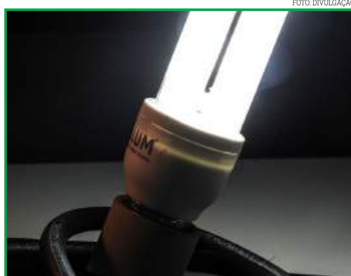
Decisão foi tomada pela Agência Nacional de Energia Elétrica

Quando o quadro piora, a bandeira pode ser alterada em uma escala que vai de verde (sem taxa extra) para amarela (taxa extra de R$ 1,34 por 100 Kw/h) e, no pior cenário, para a vermelha (R$ 6,2 por 100 Kw/h).