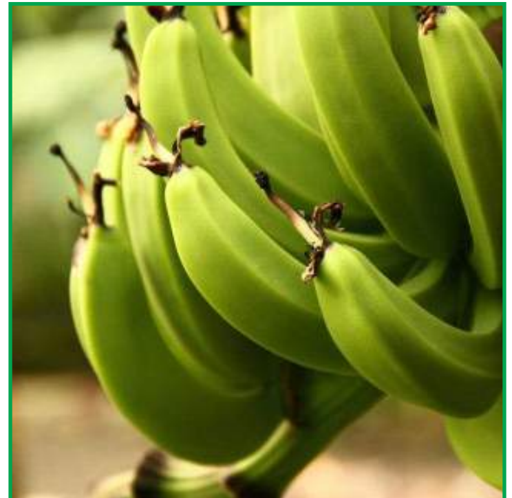
Gleder faz parte do grupo de 30 produtores que recebem assistência técnica