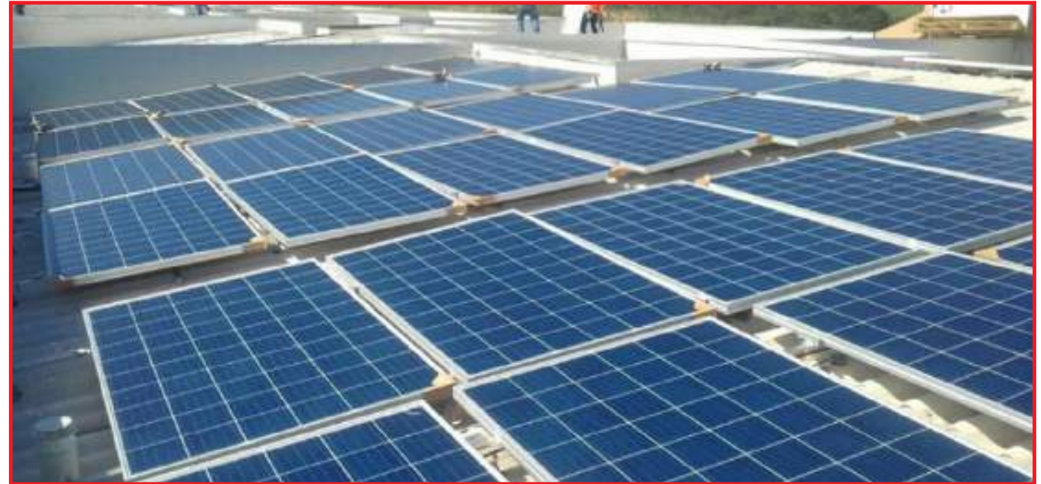
Célula fotovoltaica orgânica: barateamento das placas solares

A energia solar é uma alternativa de consumo no país desde 2012. Atualmente representa apenas 1,7% de toda a matriz energética, segundo a Agência Nacional de Energia Elétrica (Aneel). Conforme dados da Associação Brasileira de Energia Solar Fotovoltaica (Absolar) o Brasil atingiu, no ano de 2020, a marca de 30 mil imóveis com o sistema. Isso representa um cres-