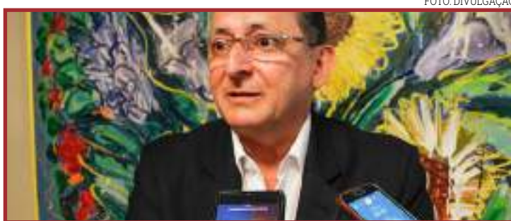
Galindo é dos que aparecem na lista da CGE de proibidos de contratar

Galindo foi deputado estadual e prefeito de Cuiabá entre 2010 e 2012 e agora reside em São Paulo. Segundo a CGE, ingressou no cadastro em 2019 pelo Tribunal de Justiça de Mato Grosso por pendência com antiga Secretaria de Estado de Planejamento (Seplag) e está proibido de fazer negócios com Governo Estadual pelo período de três