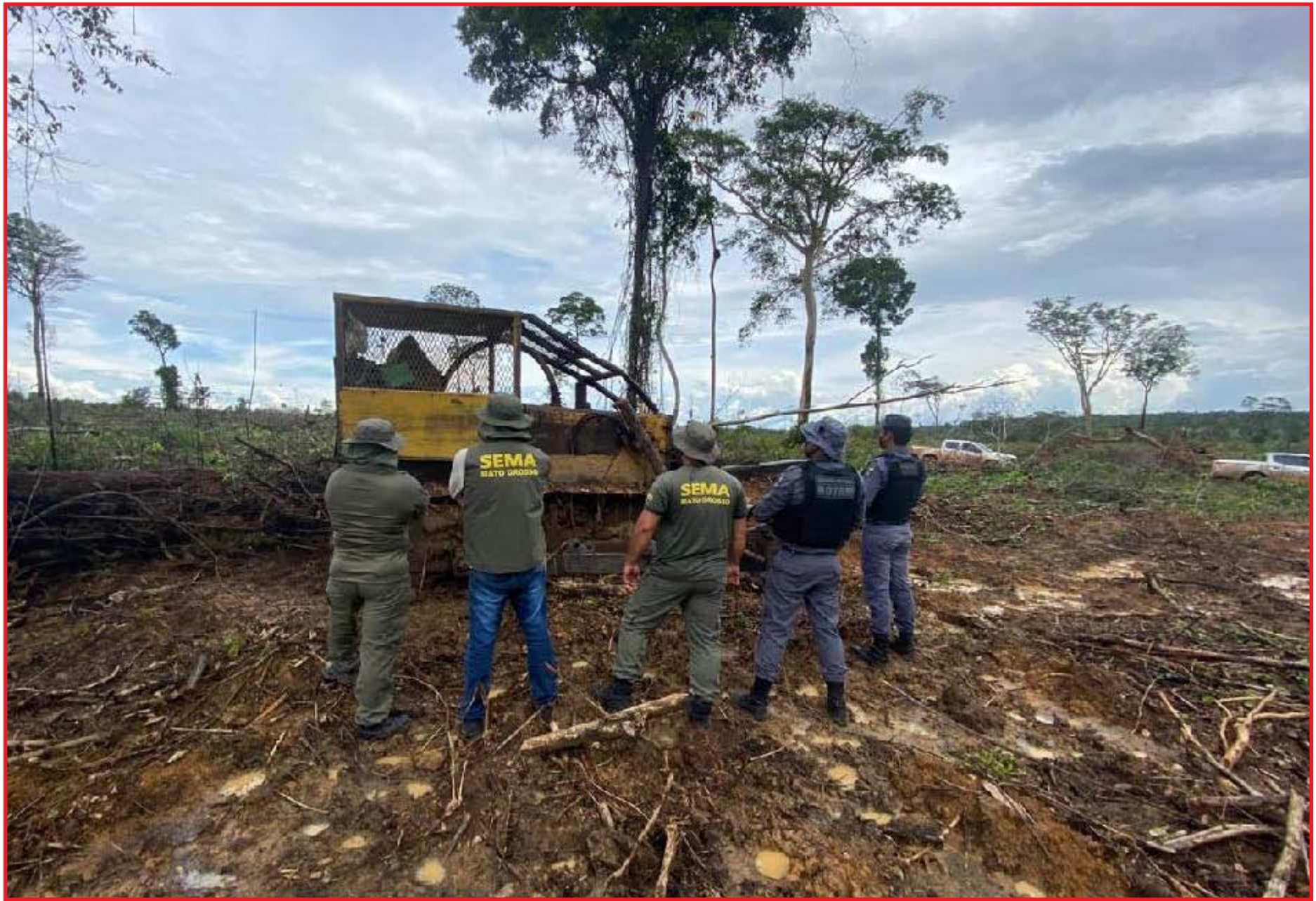
Metodologia ajudou a apreender equipamentos logo no primeiro mês do ano

Durante operação, realizada entre os dias 19 a 29 de janeiro, a Sema, em parceria com Batalhão de Rondas Ostensivas Tático Móvel (Rotam) e o 1º Batalhão da Polícia Militar, fiscalizou quatro áreas em Peixoto de Azevedo, Ma-