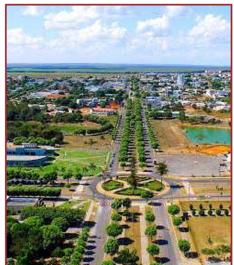
Prefeitura lançou campanha com previsão de arrecadar R$ 11 milhões