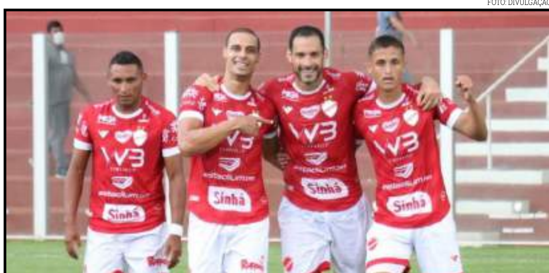
Goianos eliminaram o Palmas; confronto em dois jogos

Quem passar deste confronto vai enfrentar na semifinal o vencedor do duelo entre Brasiliense-DF e Atlético-