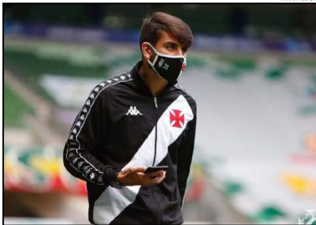
Graça atuará no clássico no lugar do suspenso Leandro Castan

Como o capitão Leandro Castan está suspenso, Graça será titular. A escala-