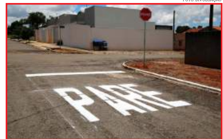
As mudanças começaram no início da semana