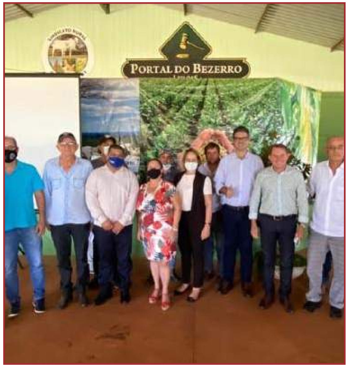
Municípios se unem contra implantação de área úmida

Seriam 17 os municípios atingidos: Água Boa, Araguaiana, Bom Jesus do Araguaia, Canabrava do Norte, Canarana, Cocalinho, Confresa, Luciara, Nova Nazaré, Nova Xavantina, Novo Santo Antônio, Porto Alegre do Norte, Ribeirão Cascalheira, Santa Terezinha, São Félix do Araguaia, Serra Nova Dourada e Vila Rica.