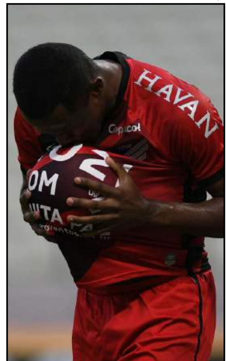
Jogadores trocaram camisas com adversários, algo proibido por conta da pandemia