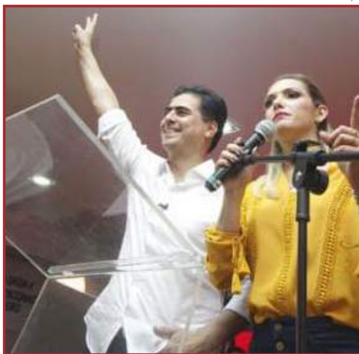
Os dois não conversam e não se entendem