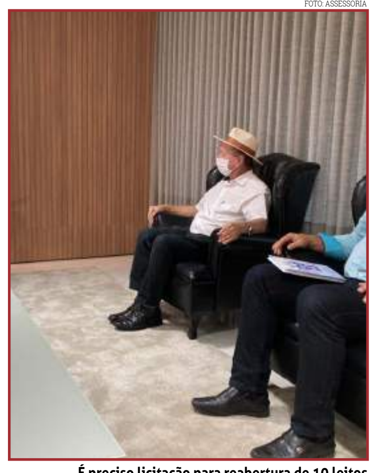
É preciso licitação para reabertura de 10 leitos de UTI em Sinop