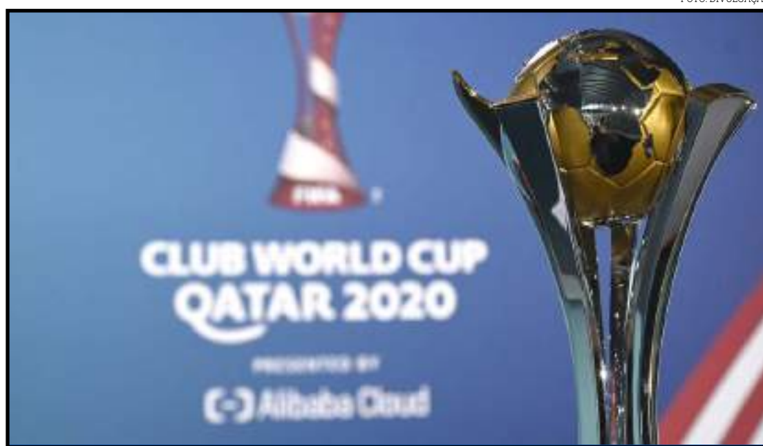
Palmeiras encara o Al Ahly, às 11h

notícias não são nada boas. Os atacantes Mahmoud Kahraba e Hussein El-Shahat foram banidos pela Fifa do jogo de hoje por violarem o protocolo contra o novo coronavírus estipulado pela