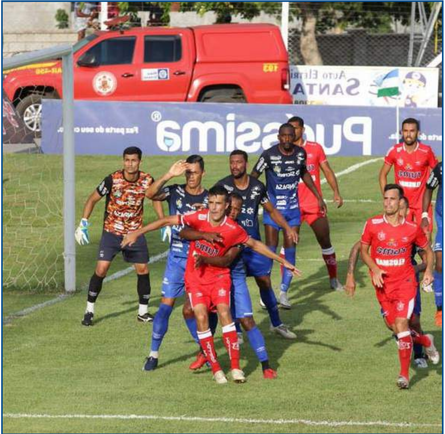
Nova Mutum estreou na elite e já foi campeão em 2020

O Dom Bosco é o quarto maior campeão, com 6 taças (a última em 1991). O Atlético tem 5 títulos e o Operário de Campo Grande tem 4 (à época em que Mato Grosso e Mato Grosso do Sul eram um só). Com 3 títulos, Sinop e Luverdense, seguidos por Sorriso e Juventude. Entre os que levantaram apenas um caneco estão Nova Mutum, União Rondonópolis, Cacerense, Americano, Paulistano, Vila Aurora, Operário FC, EC Operário e Comercial de Campo Grande (mesma situação do Operário-MS).