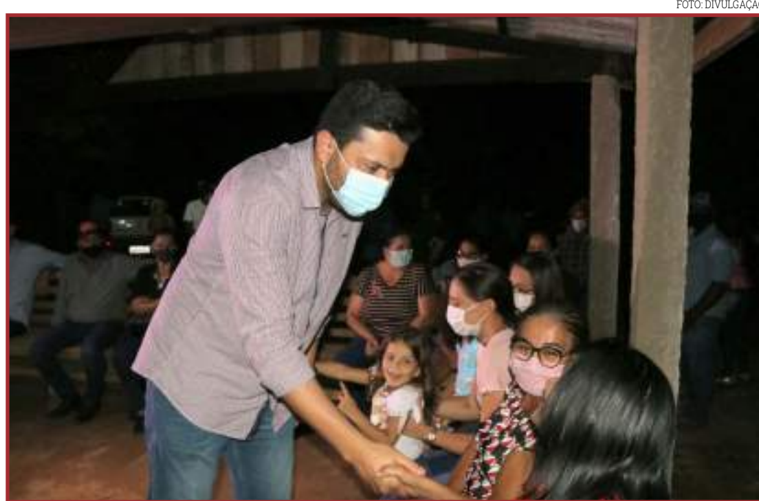
Prefeito visitou localidade e ouviu reclamações dos moradores