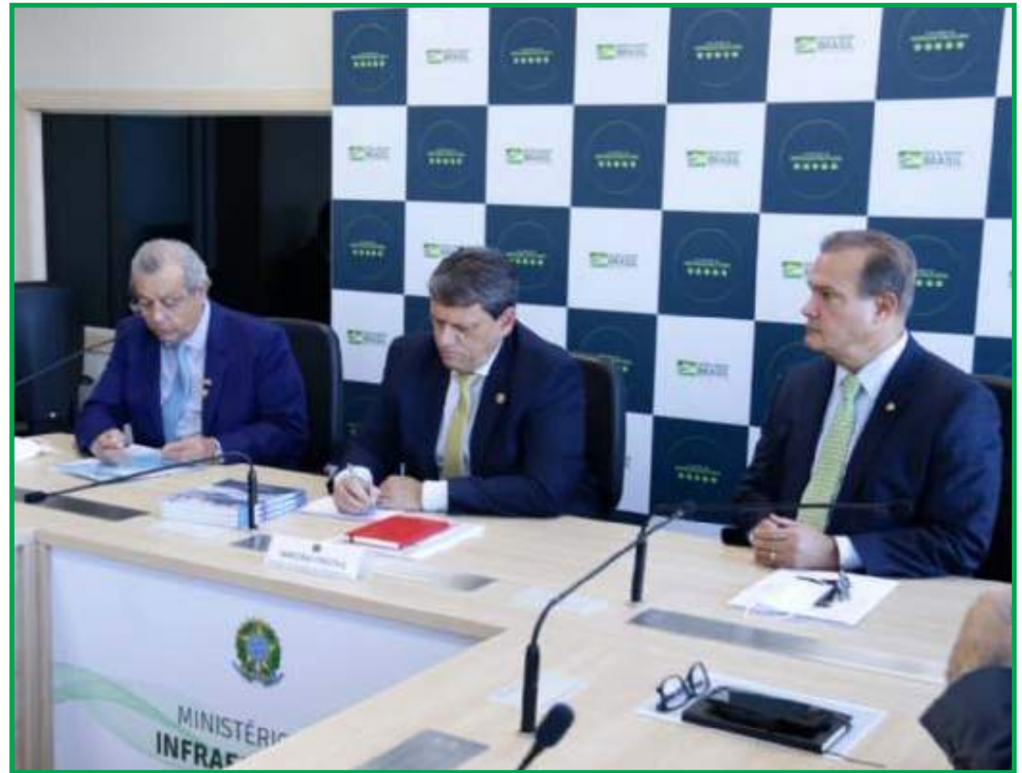
Ferrogrão será estendida a Cuiabá e L.R.Verde

O presidente da Frente Parlamentar de Logística e Infraestrutura, Wellington Fagundes, destacou que o entendimento firmado em torno do Projeto de Lei 257/2018 pode ser classificado como “excelente para o Brasil”. O projeto permite avançar as ferrovias para o Centro-Oeste em função da grande capacidade de produção.