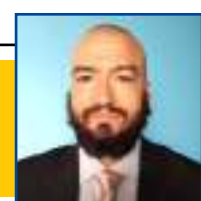
POR LEANDRO CARECA