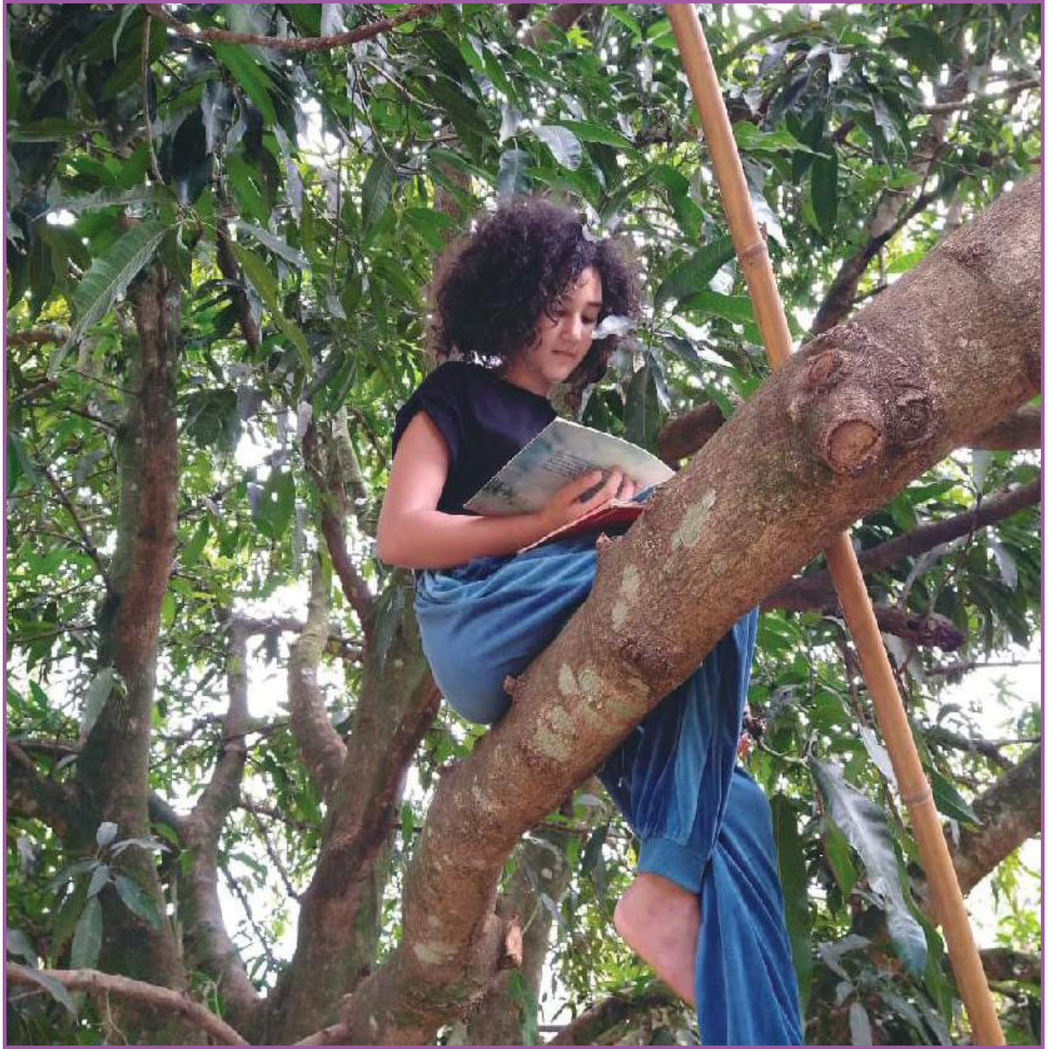
Pequena escritora prepara sua 1ª obra literária

Com edição da Editora Sustentável, sediada em Cuiabá, o livro foi viabilizado ao ter sido contemplado no edital MT Nascentes da Secretaria de Estado de Cultura, Esporte e Lazer (Secel-MT).