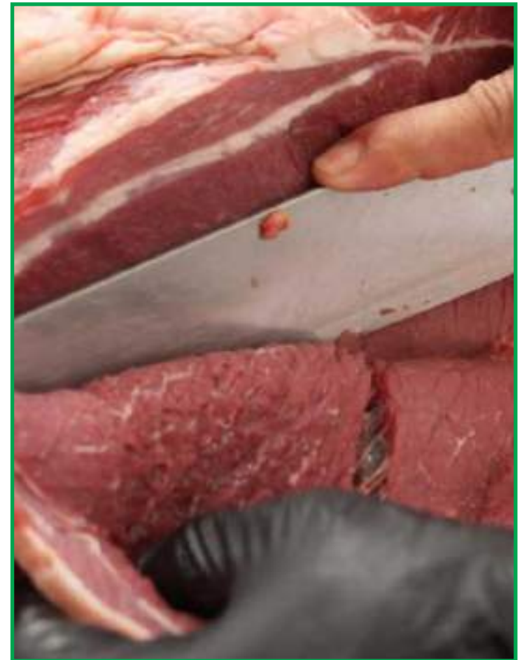
Corte que mais aumentou foi o coxão duro