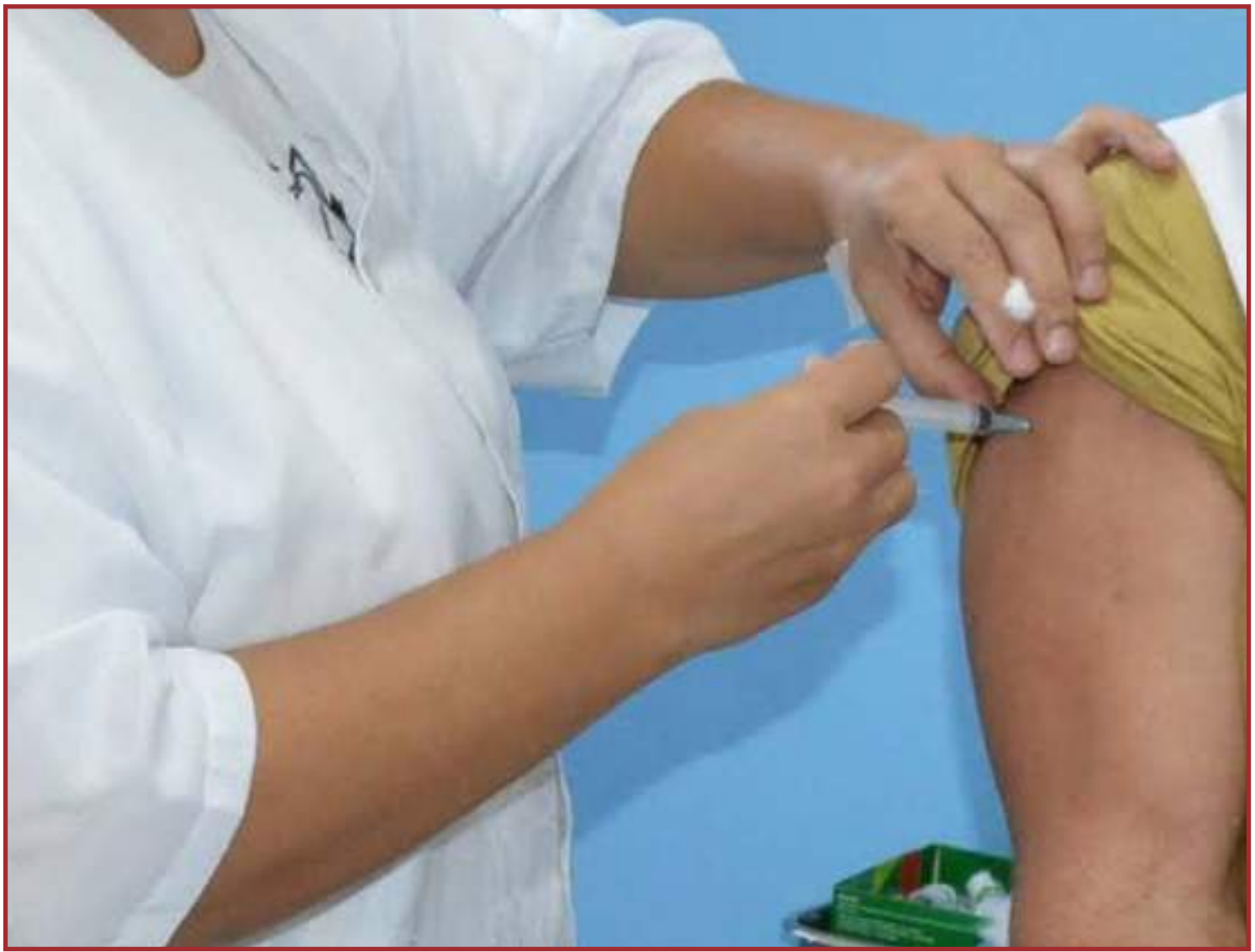
TCE pede lista de vacinados